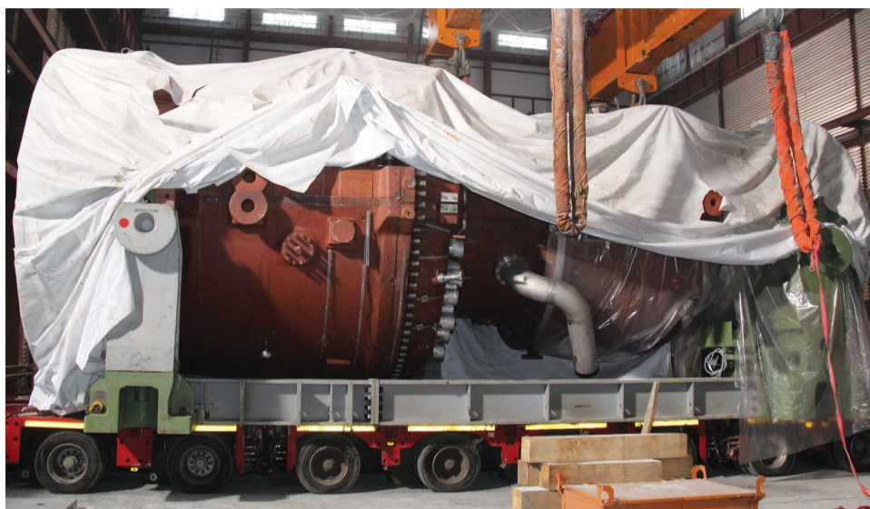
Первая газовая турбина доставлена и готова к установке.

О том, как везли эту махину весом более трехсот тонн стоит рассказать отдельно. Родом турбина тоже из Швейцарии. Так же как и генераторы, до речного порта Перми она была доставлена на барже, а затем была перегружена на железнодорожную платформу. И все бы ничего, но разница в сто тонн отразилась на размерах.