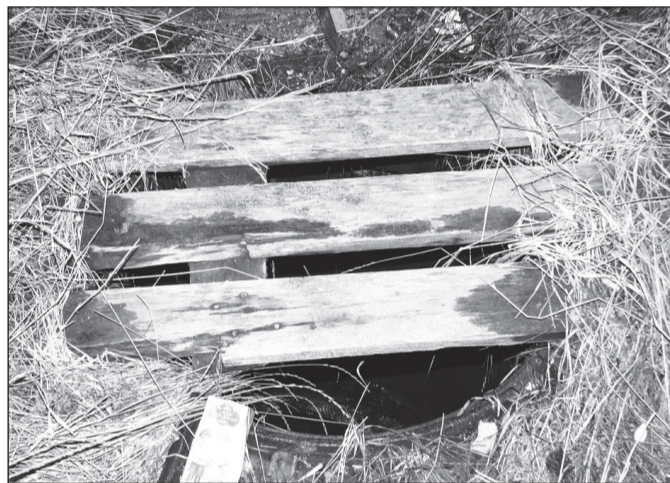
Жителям дома ветеранов надо быть начеку.

Прошли тысячелетия, вымерли мамонты, но методы охоты остались те же. Теперь в каменных джунглях можно запросто провалиться в подполье. Ловушки, замаскированные сверху досками и железками, обнаруживаются на тротуарах, рядом с жилыми домами. В темноте дворов заметить их очень сложно.