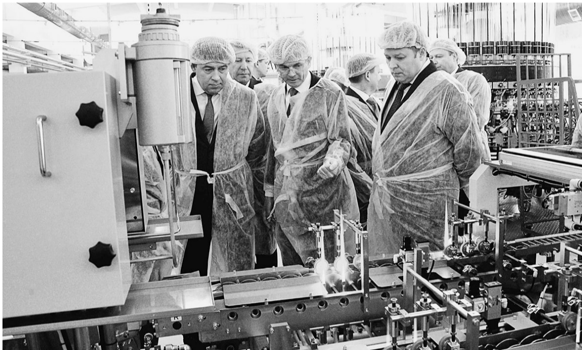
«В сфере фармацевтики у нас есть мощный задел для создания принципиально новых лечебных противовирусных препаратов (триазавирин), мы уже производим отечественный инсулин, ведутся исследовательские работы по разработке иных вакцин и препаратов, не уступающих зарубежным аналогам»

Не буду повторять набившие оскомину слова о том, что мест-