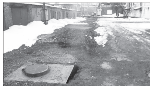
Во дворах по «сорокалетке» расставлены ловушки.

Сергей ФЕДОРОВ.