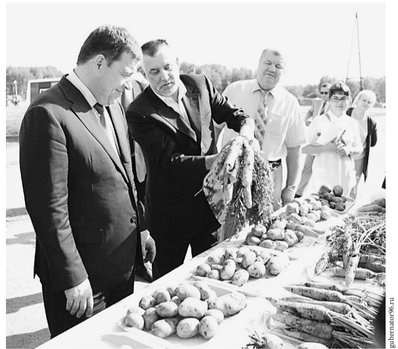
«Сегодня госбюджет в село вкладывает 5,7 миллиарда рублей, а получает продукции – молока, мяса, зерна, картошки и прочего – на 53 миллиарда рублей!»

Я не упоминаю здесь и другие не менее важные программы, над которыми мы работаем. Назову только одну – «Доступная среда», которая позволит существенно повысить качество жизни наших инвалидов. Но в целом рассказ о социальной политике Урала и о том, как она будет меняться, адаптироваться к реальной жизни – тема моей следующей статьи. Уж