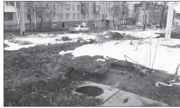
Недалеко от детсада «Алёнушка».