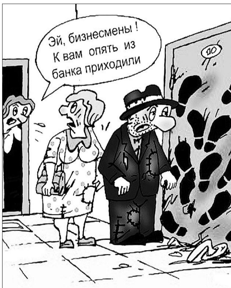
Иллюстрация с сайта http://caricatura.ru .