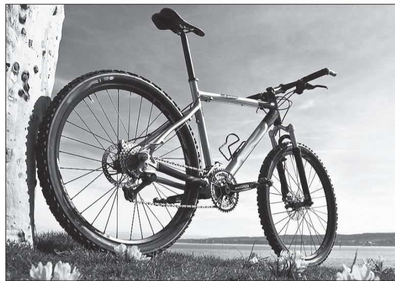
Современные велосипеды - сложные устройства.

Стоит обращать внимание на размер колес и тип тормозов.