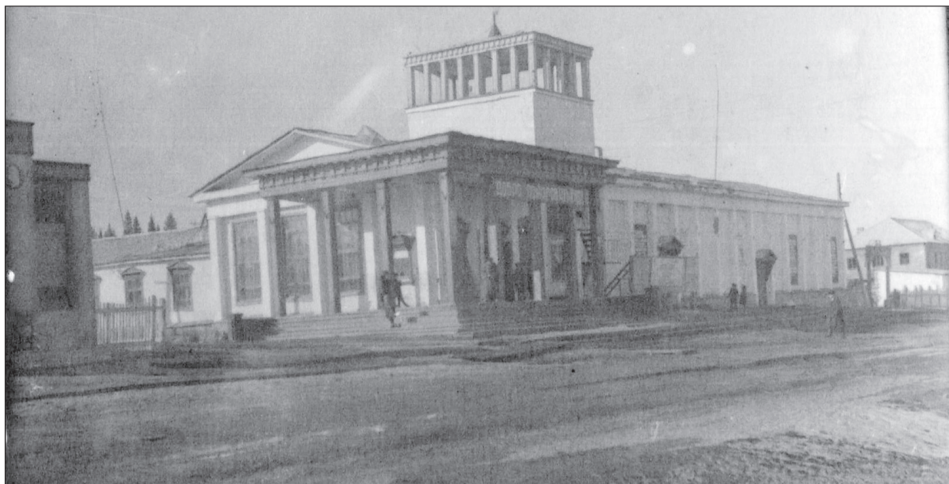
Так в начале 60-х годов прошлого века выглядел клуб «Энергетик».

В 1949 г. в поселке Октябрьский открылась школа рабочей молодежи №2 (ШРМ), учащиеся которой учились в третью смену в общеобразовательной школе. В 1954 году вечерняя школа разместилась в своем здании-бараке рядом с «Энергетиком» и работала в нем в две смены около 10 лет. Классы были большие, наполняемость их — от 20 до 40 человек. В 1963 г. школа получила новое просторное двухэтажное здание перед кинотеатром «Энергетик». Много сил, творчества вложил в оформ-