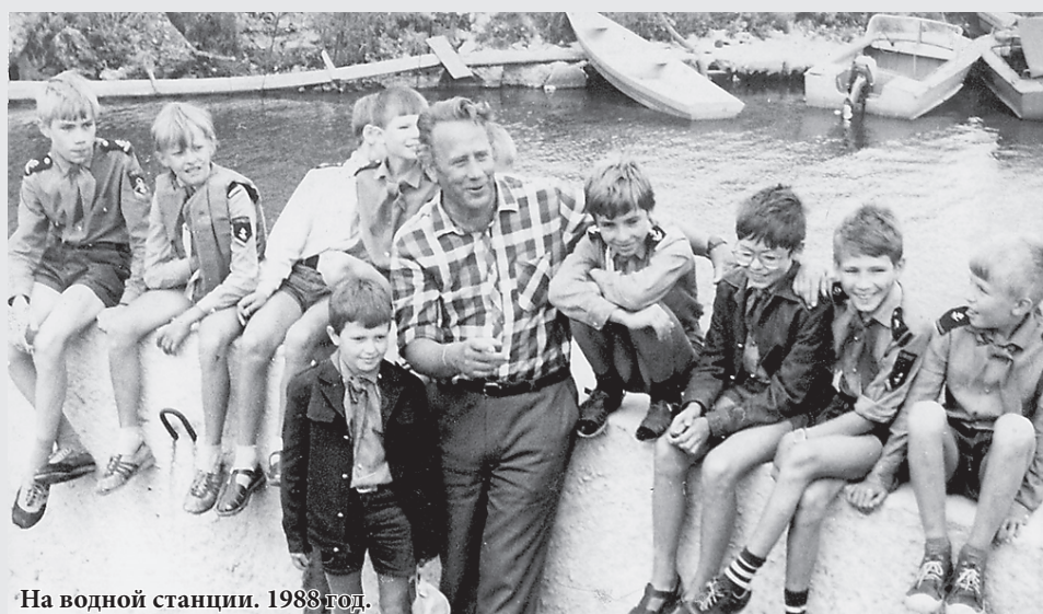
На водной станции. 1988 год.

В октябре прошлого года детский писатель, основатель легендарного отряда «Каравелла» Владислав Петрович Крапивин вернулся в родной для него Екатеринбург из Тюмени, где он прожил последние шесть лет.