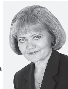
Председатель Законодательного Собрания Свердловской области Людмила Бабушкина поздравила коллег и всех земляков:

Сегодня Свердловская область входит в число динамично развивающихся регионов России. Здесь реализуются перспективные экономические проекты, проводятся масштабные международные мероприятия. Во многом это заслуга депутатского корпуса. За минувшие 20 лет сделаны огромные шаги в становлении и совершенствовании регионального законодательства. Правовая база Свердловской области стала основой для развития экономики, социальной сферы, поддержки здравоохранения, образования, науки и культуры, повышения благосостояния населения. В связи с этим мы напомним вам, уважаемые читатели, о законодательных решениях в различных сферах жизни на Среднем Урале за последние годы.