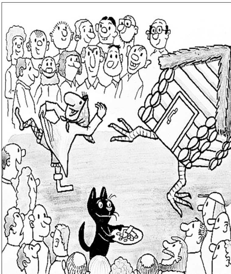
Иллюстрация с сайта http://caricatura.ru .