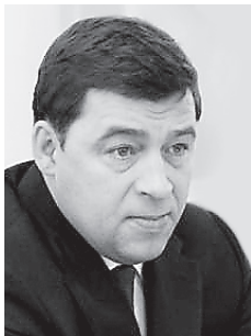
Депутатов Законодательного Собрания Свердловской области поздравил губернатор Свердловской области Евгений Куйвашев: