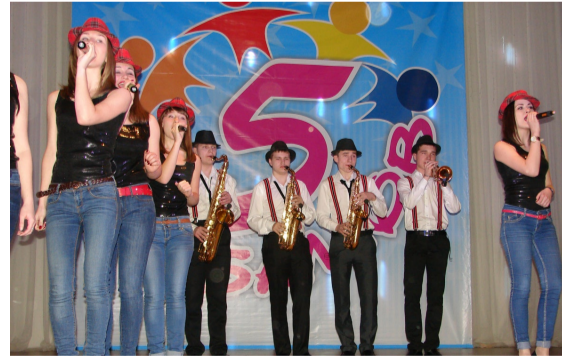
Вокальный ансамбль «Пепси+» – обладатель Гран-при фестиваля.

По инф. Дворца культуры.