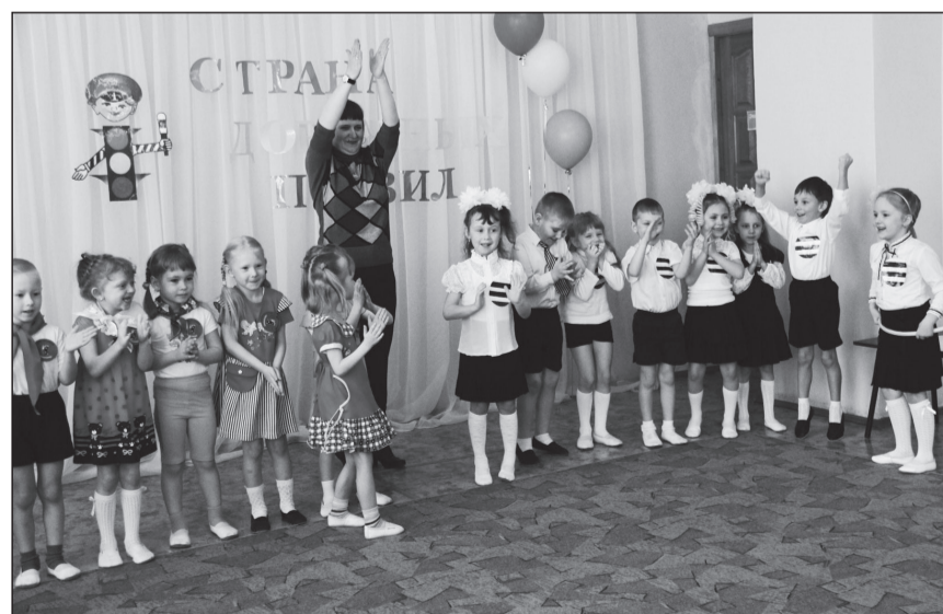
В «Чайке» знают Правила движения.

Команды блеснули знаниями, доказав, что они обладают необходимыми навыками, чтобы стать полноправными участниками дорожного движения. За старания в