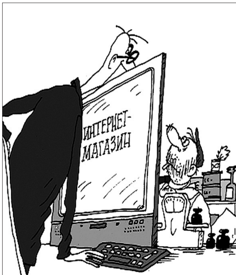
Иллюстрация с сайта http://caricatura.ru .