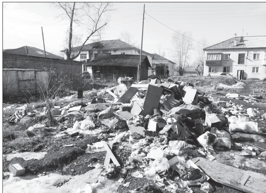
Несмотря на наличие контейнеров, эта площадка давно не видела мусоровозной машины.

По информации комитета ЖКХ администрации НТГО, дом №18 по ул. Советской находится под управлением ОАО «Областная управляющая жилищная компания», а дома №20 по ул. Советской и №1 по ул. Серова — под управлением ООО «УК Энергетик». К какому дому и к какой компании относится погребенная под слоем мусора контейнерная площадка, установить не удалось. Причина несвое-