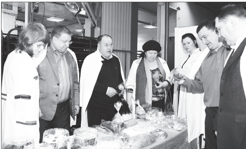
Всегда есть, что показать коллегам.