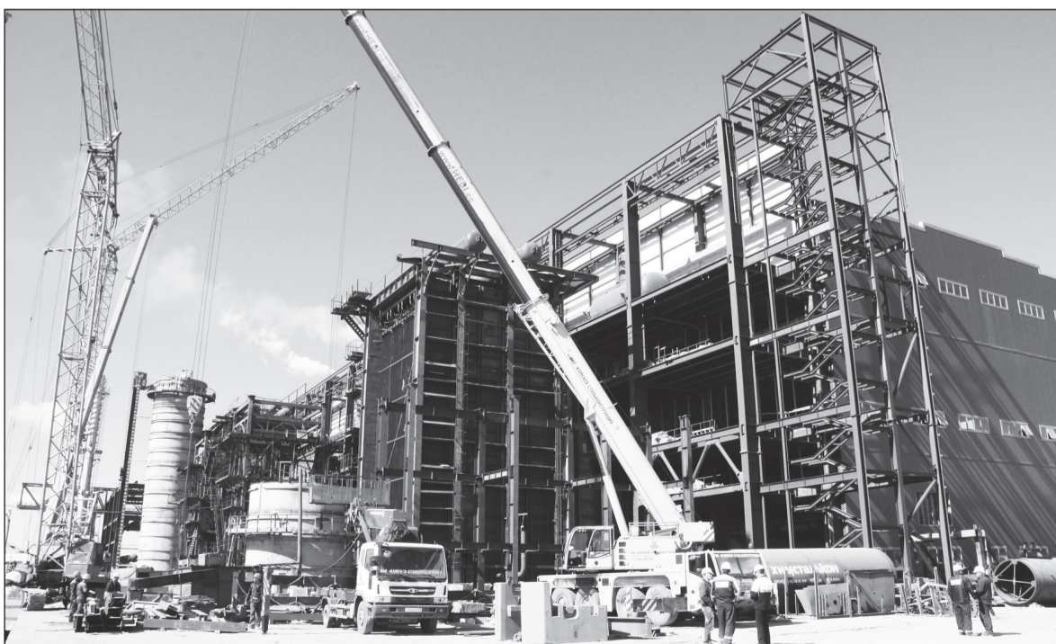
Почти завершён монтаж котлов-утилизаторов. Полным ходом идёт возведение дымовых труб.