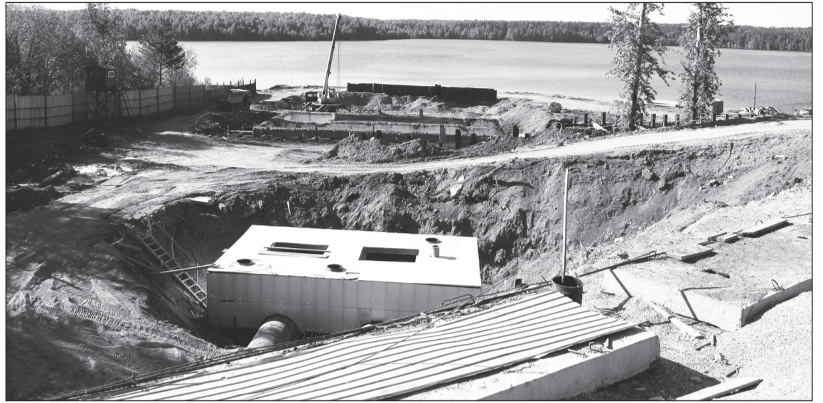
Здесь будет построена береговая насосная станция.

Такой метаморфозе будет подвергаться электрический ток, вырабатываемый новой станцией. Генераторы будут выдавать напряжение в 15 кВ, а перед выдачей в энергосистему оно будет увеличиваться до 220 кВ. Для этих целей рядом со станцией строится открытая трансформаторная установка. Всего в ней предусмотрено семь трансформаторов производства Запорожского и Тольяттинского заводов. В настоящее время пять трансформаторов уже смонтированы. Поражают размеры и вес этих устройств. Самые большие из них весят по 150 тонн в сухом состоянии. А вместе с