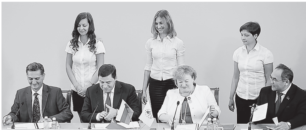
Трёхстороннее соглашение о сотрудничестве в сфере обеспечения межэтнического и межконфессионального согласия 5 июня 2014 года подписали губернатор Евгений Куйвашев, председатель Совета «Ассамблеи народов России» Светлана Смирнова и председатель правления «Ассоциации национально-культурных объединений Свердловской области» Фарух Мирзоев.

Нужно отметить, что на Среднем Урале последовательно воплощаются в жизнь положения Указа Президента России «Об обеспечении межнационального согласия» и Стратегии государственной национальной политики страны. В области утверждена комплексная программа «Укрепление единства российской нации и этнокультурное развитие народов России, проживающих в Свердловской области», и общий объём её финансирования составляет более 320 миллионов рублей.