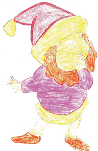
Печенье «Гномик» от Кати Мелехиной.

- С классом я ходила на экскурсию на хлебозавод. Там нас встретили радушно. Выдали нам фартуки и шапки. Мы прошли в цех к столу. На нем лежали скалки, кисточки, масло, разные начинки и кусочки теста. Для начала мы раскатали тесто, помазали маслом, засыпали сахаром и маком, завернули в трубочку и сделали надрез.