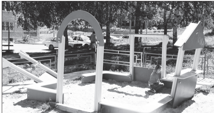
«Подарок» ко Дню защиты детей.