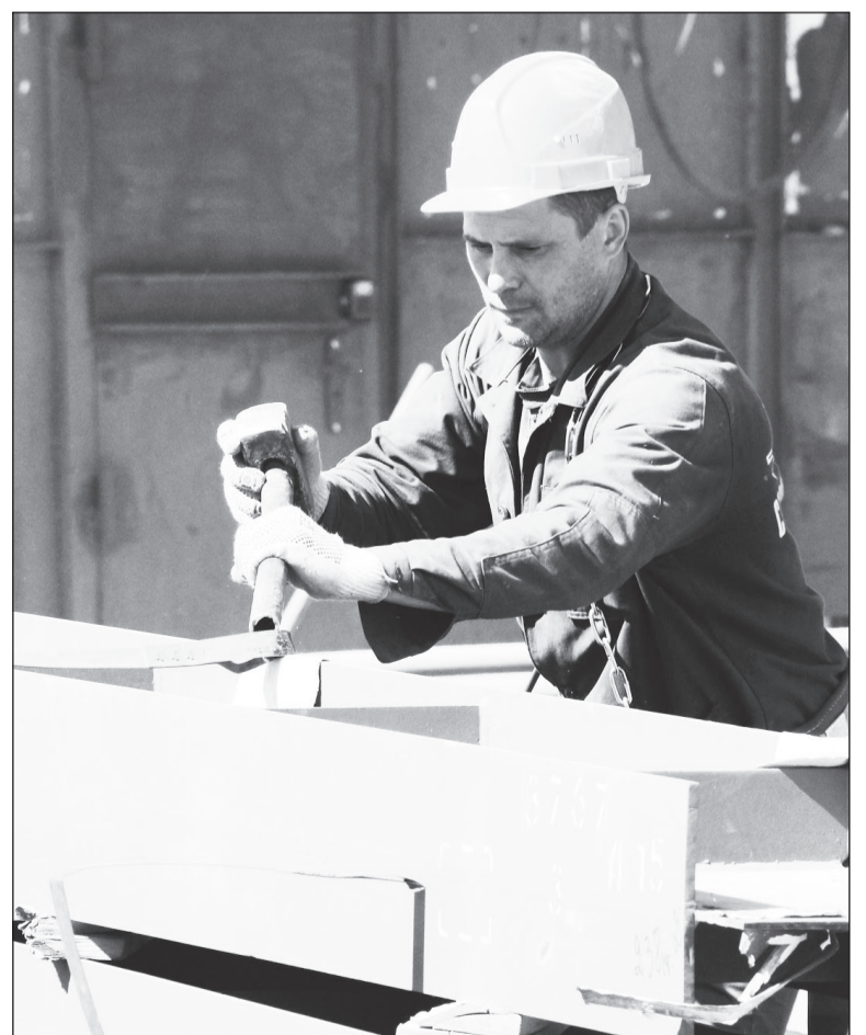
На стройплощадке задействовано почти 500 рабочих: монтажники, бетонщики, сварщики...