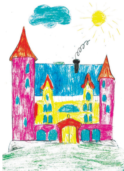
На рисунке - хлебокомбинат будущего.

Процесс приготовления булочек трудоемкий, но очень интересный. Профессия пекаря почетна. Мне так не хотелось, чтобы экскурсия заканчивалась.