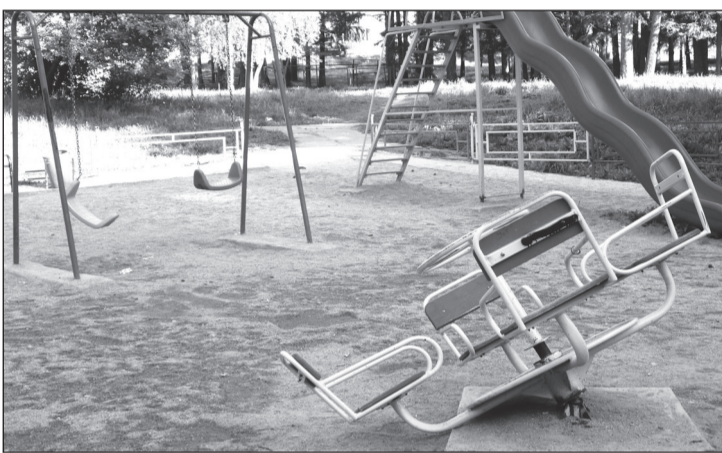
Ностальгия по старым качелям замучила?