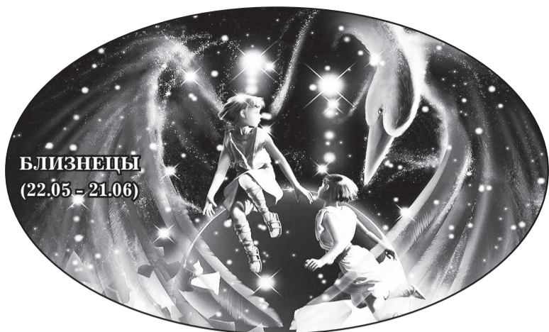
БЛИЗНЕЦЫ (22.05 - 21.06)