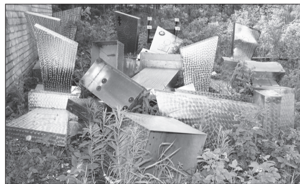
Как объяснить этот факт?