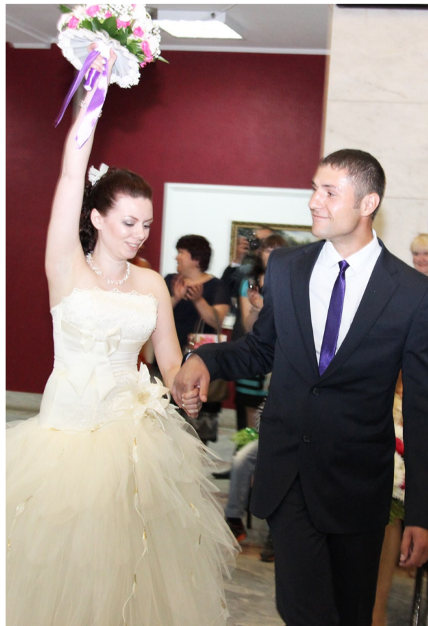
Сокольцевы знают друг друга со школы.