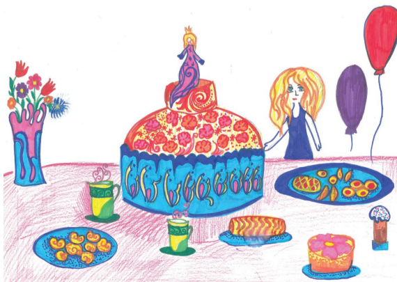
Рисунок Василисы Пшегоцкой.

Подготовила Вита ВИКТОРОВА.