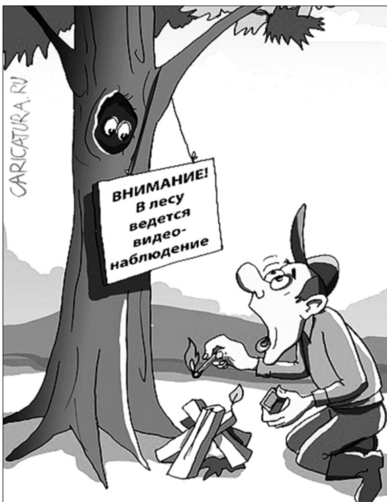
Иллюстрация с сайта http://caricatura.ru .