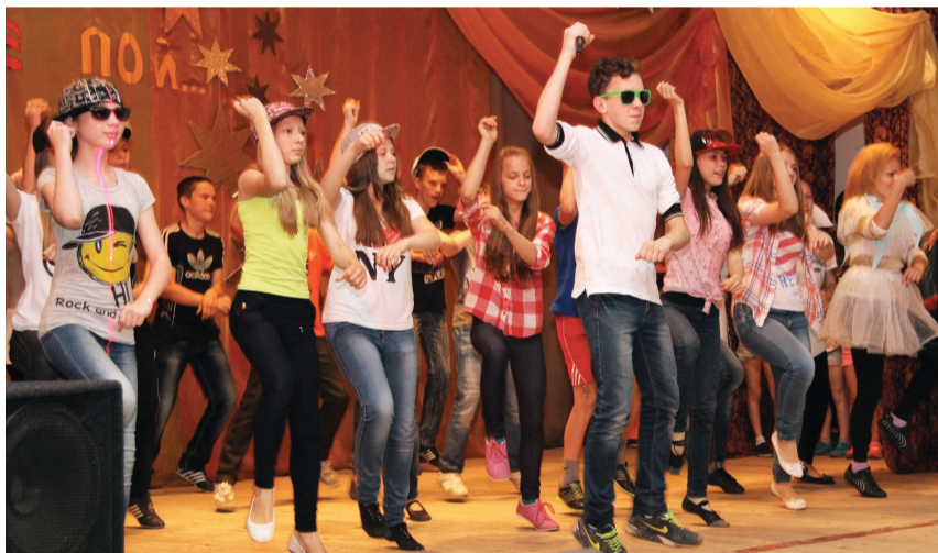
Модный танец «GangnamStyle» в ельничном стиле.