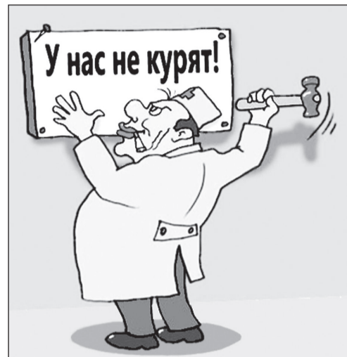
Курение опасно для вашего здоровья!