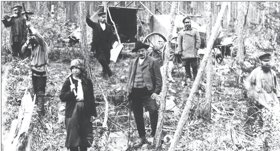
Осмотр нового месторождения. 1914 г.

Константин МОСИН.