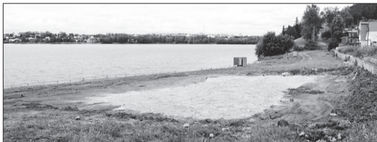
На городском пляже начато устройство волейбольной площадки.