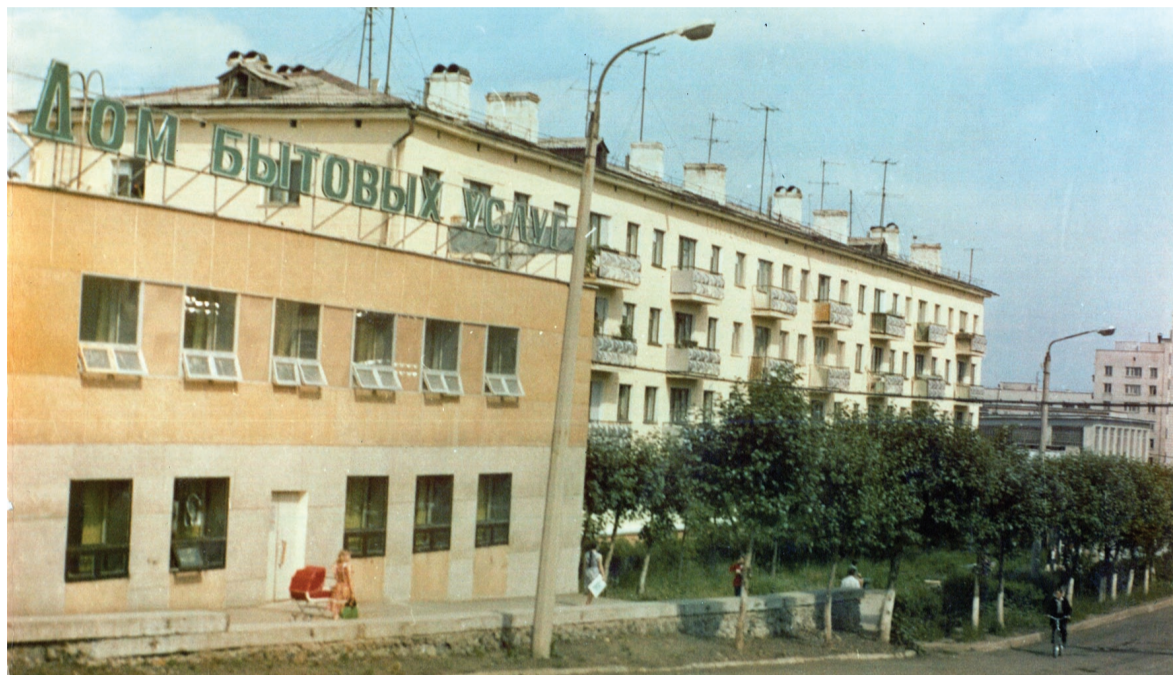
Так выглядел Дом бытовых услуг в начале восьмидесятых годов.

- Официально наше предприятие будет называться теперь