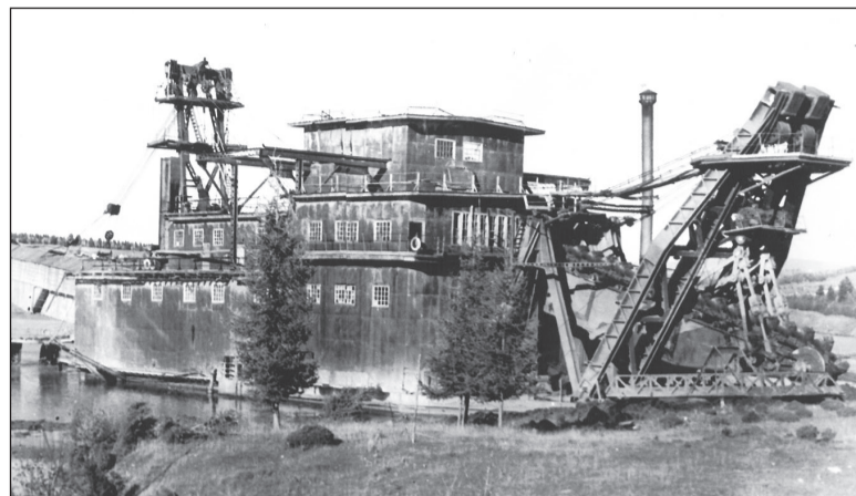
Драга № 27.

Мирный труд исовчан нарушила Великая Отечественная война. На фронт ушли лучшие специалисты прииска. Чтобы не допустить резкого падения добычи драгоценных металлов, трудящиеся перешли на двенадцатичасовой рабочий день. Трудились порой без выходных, с отменой отпусков. Дополнительно создается несколько старательских артелей, в том числе и состоящих исключительно из женщин и подростков. Рабочие берут обязательство – работать по 2-3 дня в месяц в фонд обороны. В фонд обороны несут скромные сбережения и домохозяйки. Многократно собираются деньги на производство самолетов и танков. На фронт отсылаются тысячи по-