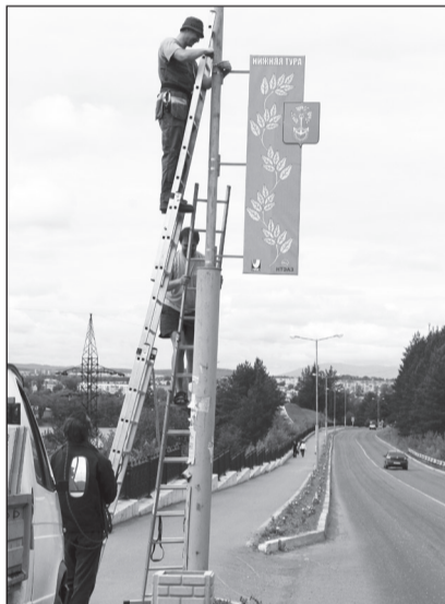
Улица Строителей украшена цветами и городской символикой.

Работниками ООО «Город-2000» проведена масштабная работа по благоустройству городских клумб. Как сообщил редакция директор ООО «Город 2000»