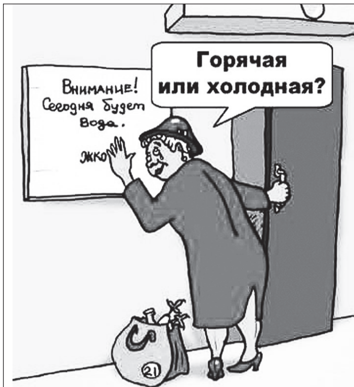
Карикатура с сайта cartoon.kulichki.ru .