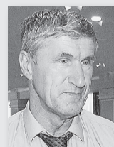
Михаил Копытов, министр АПК и продовольствия Свердловской области:

«Мы ежегодно улучшаем показатели и постоянно находимся в десятке лучших производителей молока в России. Это происходит благодаря стабильной, увеличивающейся с каждым годом областной и государственной поддержке животноводов, грамотной политике, которую ведут руководители сельхозпредприятий в области кормозаготовки и созданию генетического потенциала крупного рогатого скота на Урале».