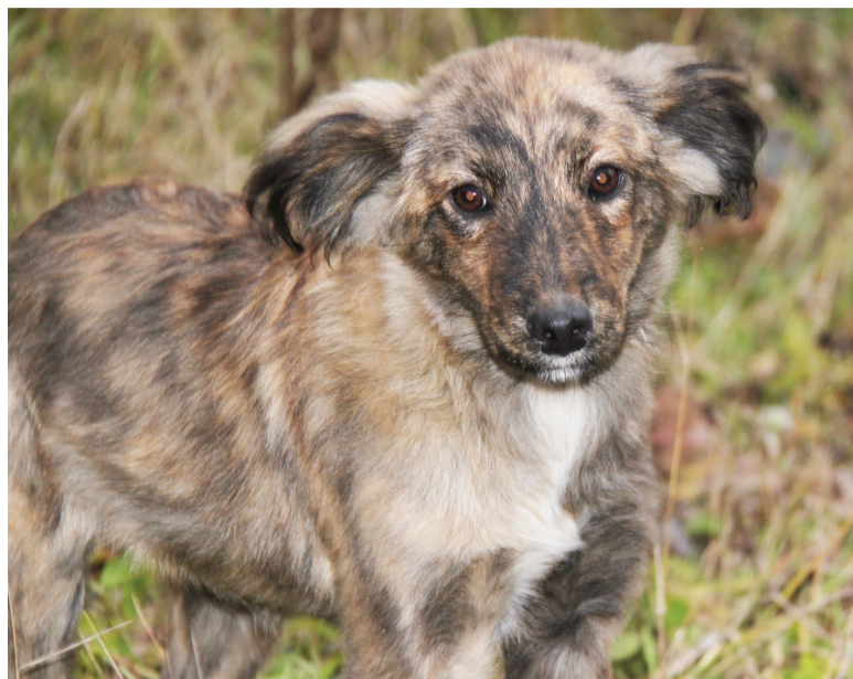
...А Пегой для брата ничего не жалко.

те (в районе железнодорожного переезда на минватном) объявились новые беспризорники: троица щенят-подростков. Вскоре один из щенков пропал, а вот над двумя снова взяли шефство садоводы-пешеходы. Благодаря их участию щенята — мальчик и девочка — наели пузики и теперь с удвоенной энергией резвятся на опасной для них обочине дороги. Октябрьская стужа закрывает садовый сезон, и уже нет необходимости любителям огородов с утра спешить на опустевшие участки. К дворнягам подбираются голод и холод, а еще им нужна человеческая ласка, они ведь не дикие звери, а домашние, и, скорее всего, не так давно с удовольствием резвились с хозяйскими детьми. Но лето кончилось, внуки уехали, а на следующий год народятся новые щенята... Впрочем, история может быть и другая, только вот исход один — бродячий. Почему владельцы собак, желающие избавиться от потомства, словно бытовой мусор, свозят беззащитных существ за город? Ведь решить проблемный вопрос можно цивили-