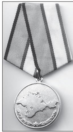
Медаль «За возвращение Крыма».

Ну а искреннюю радость крымчан и севастопольцев, вернувшихся в Россию, не мог