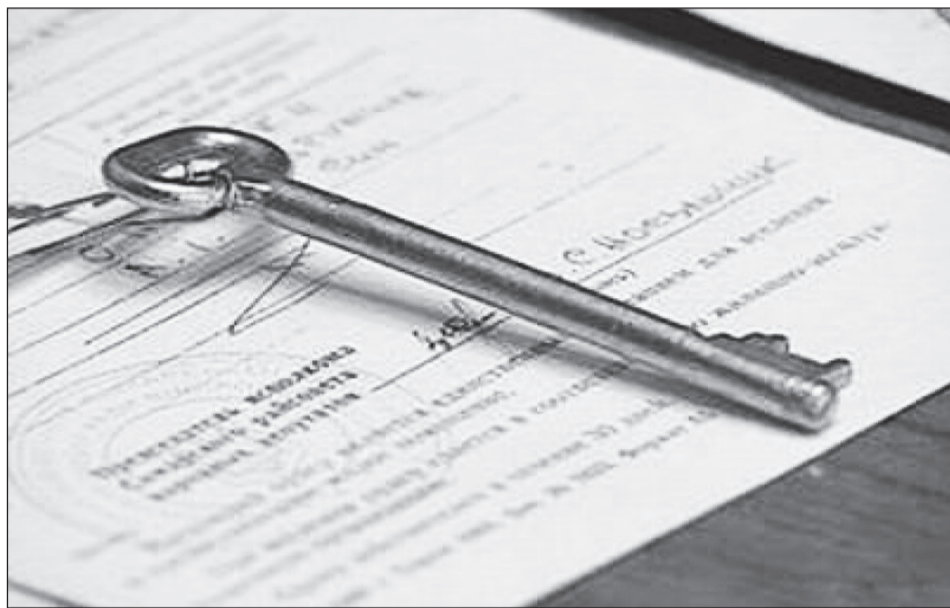
В защиту жилищных прав сирот прокуратурой предъявлено 24 иска.

3) общая площадь жилого помещения, приходящаяся на одно лицо, проживающее в данном жилом помещении, менее учетной нормы площади жилого помещения, в том числе если такое уменьшение произойдет в результате вселения в данное жилое помещение детей-сирот и детей, оставшихся без попечения родителей, лиц из числа