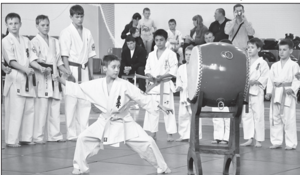
Открытие соревнований по карате.