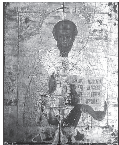
Иконы были семейными реликвиями.