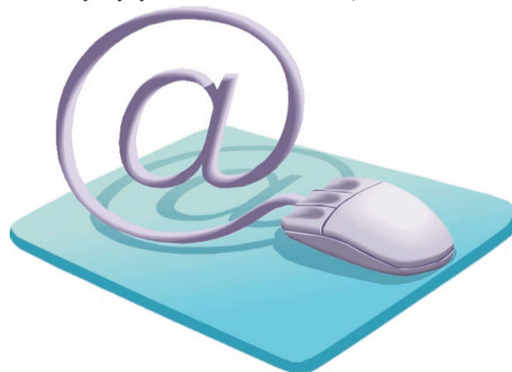
Электронная связь дает много возможностей.