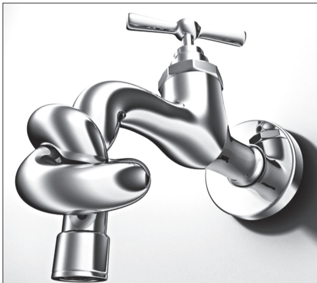
Краны с холодной в Нижней Туре периодически «высыхают».

- На 01.09.2014 г. кредиторская задолженность ООО «Акваком» перед ФГУП «Комбинат «Электрохимприбор» составляет 27 562,54 тыс. руб. Размер дебиторской задолженности ООО «Акваком» на 01.09.2014 г. — 4 869,40 тыс. руб., большую часть из которой составляет долг населения — 3 821,50 тыс. руб.