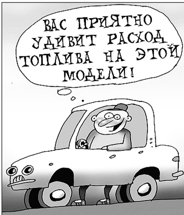
Иллюстрация с сайта http://caricatura.ru .