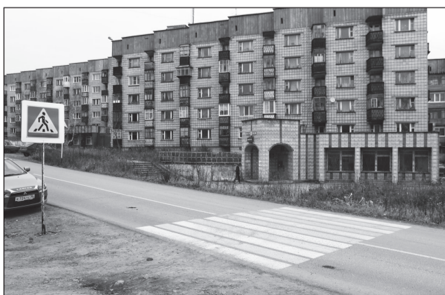
«Зебра» уткнулась в бурьян.