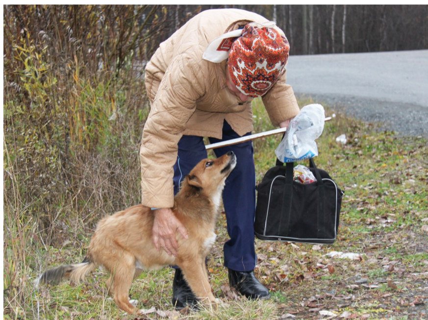
Рыжий норвит съест весь обед...