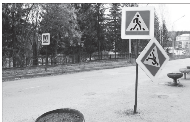
Пешеходный переход упирается в деревья, а знак держится на честном слове.