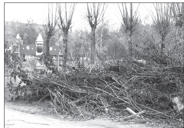
Итог акции чистоты.