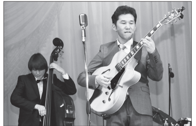
Джазменам ноты не нужны.