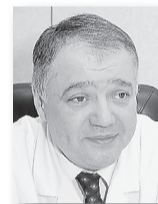
Ян Габинский, директор Уральского института кардиологии, академик:

сти. В этой связи предлагаю объявить 2015 год Национальным годом борьбы с сердечно-сосудистыми заболеваниями, которые являются основной причиной смертности сегодня.