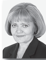
Людмила Бабушкина, председатель Законодательного Собрания Свердловской области:

«Надо максимально снять ограничения с бизнеса. На ближайшие четыре года «зафиксировать» действующие налоговые условия. Для малых предприятий, которые регистрируются впервые, будут предоставлены двухлетние «налоговые каникулы». Также льготы получат производства, начинающиеся с «нуля».