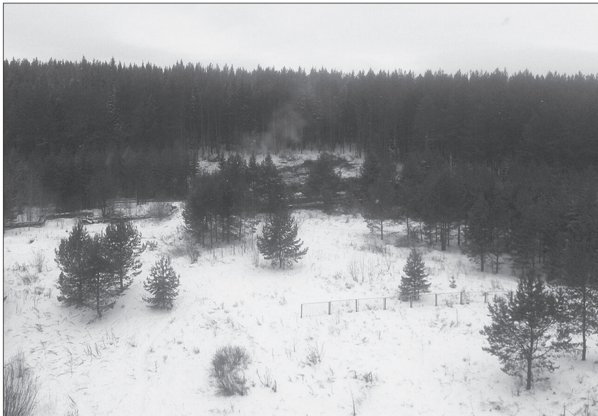
Так теперь выглядит восточный склон Шайтана. Скоро здесь появится 78-метровая телевышка.

На данном участке будет построена станция цифрового эфирного телерадиовещания. Высота металлической конструкции башни по проек-