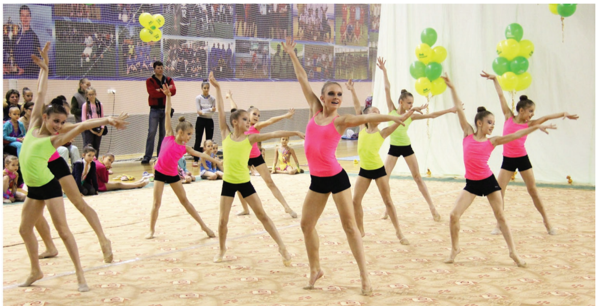
Показательные выступления нижнетуринских гимнасток.

Во второй и третий день турнира жюри оценивало выступления гимнасток в индивидуальной программе. Среди самых маленьких гимнаст-