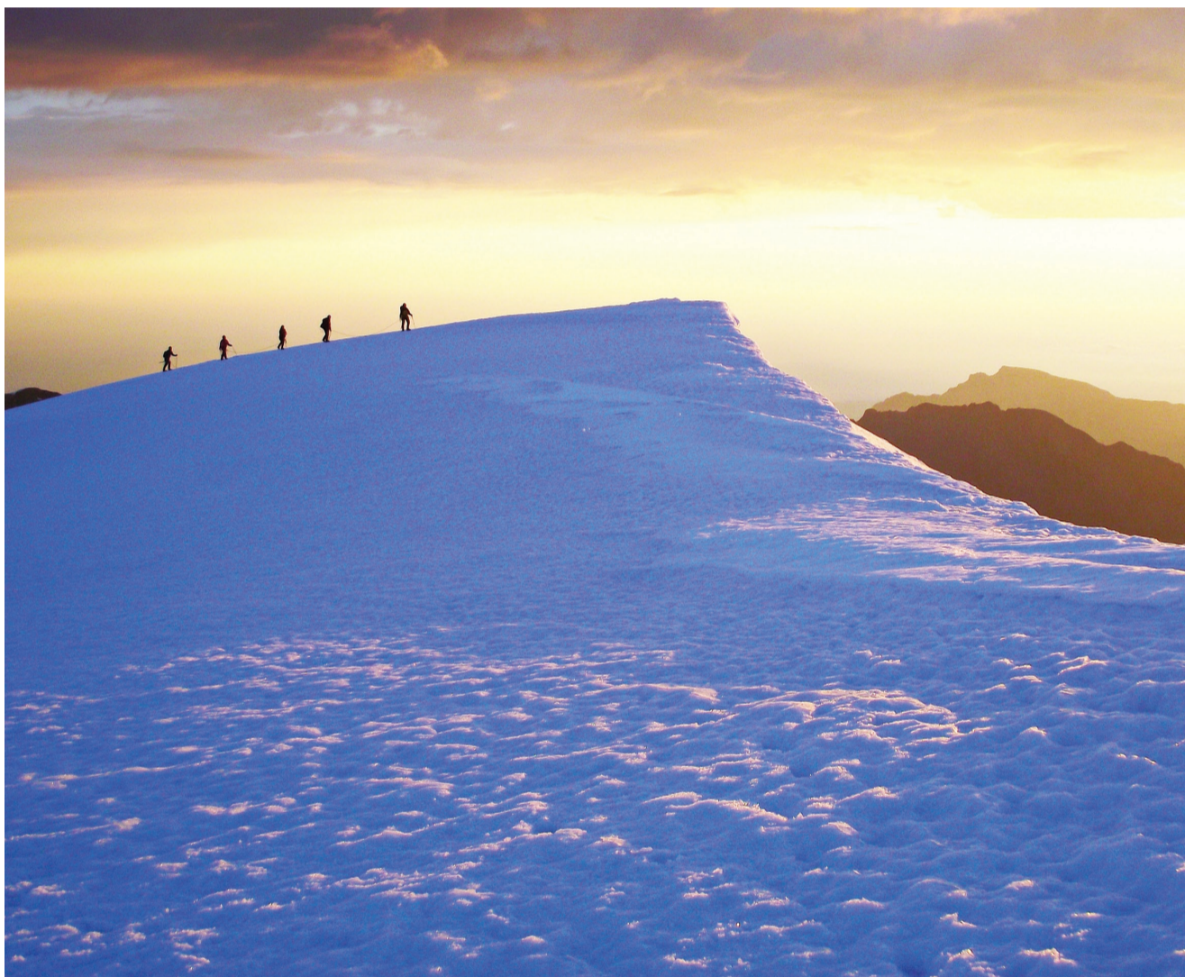
Рассвет и закат - впечатляющее зрелище.