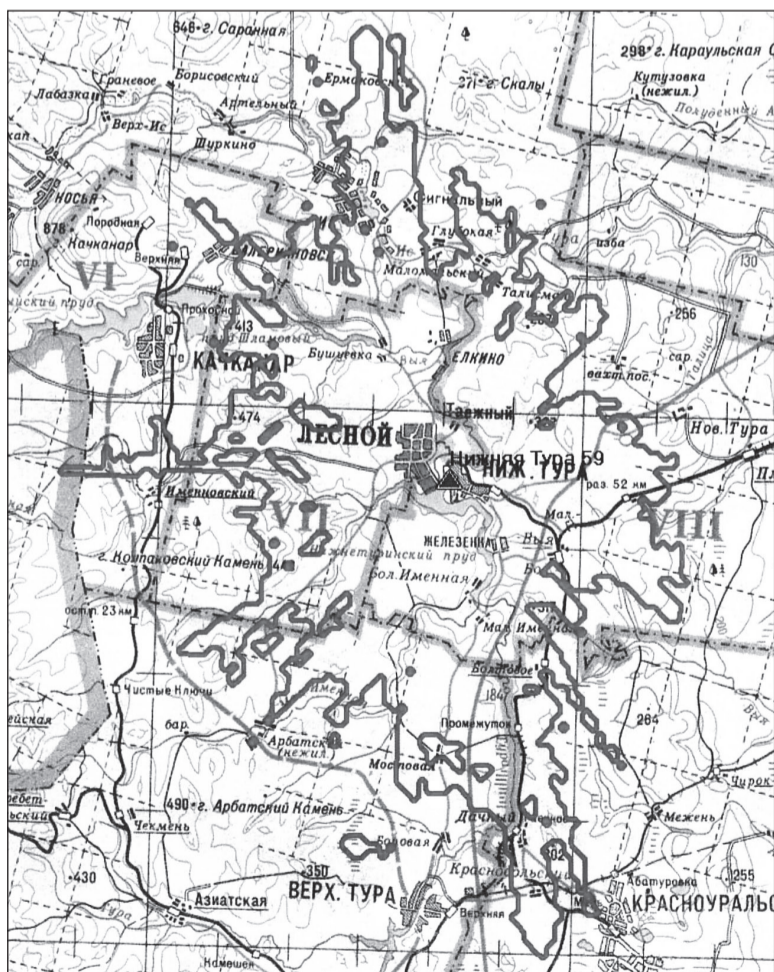
Расчетная зона обслуживания передатчика.

Будущая телевышка будет иметь довольно внушительную высоту — 78 метров. Для сравнения: высота типовой девятиэтажки всего лишь 30 метров.