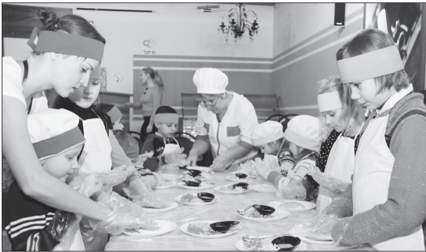
«Теперь готовить пиццу мы научим мам!»