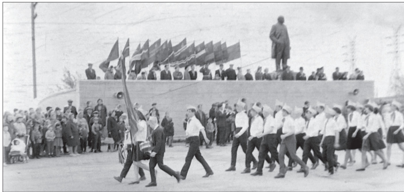
Парад юнармейцев 9 мая 1967 г. Здание администрации еще не построено, на этом месте стояли трибуна и памятник В.И. Ленину.