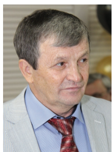
Гендиректор ОАО «Тизол» награжден за благотворительность.

Куйвашев 2 марта на заседании совета при губернаторе Свердловской области по реализации приоритетного национального проекта «Доступное и комфортное жилье – гражданам России».