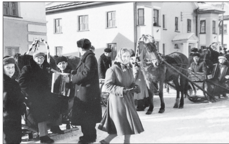
Нижнетурицы провожали зиму, катаясь на лошадях по ул. 40 лет Октября (1958 г.)