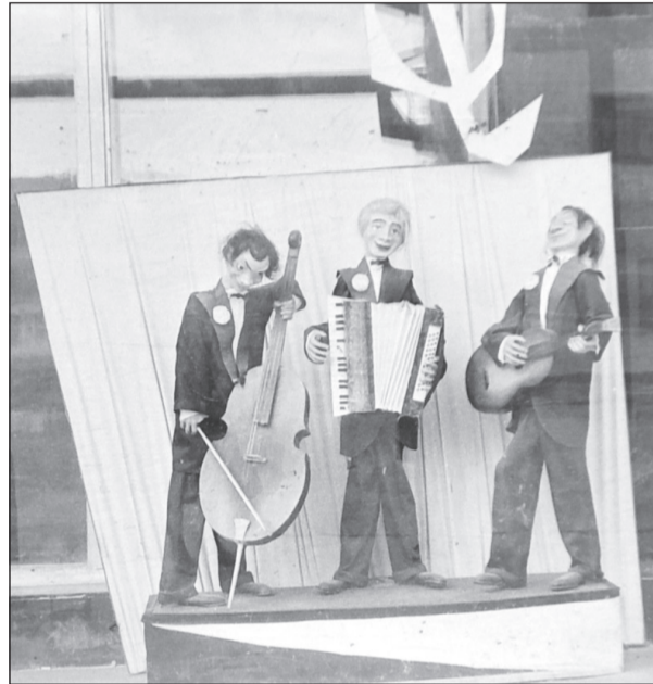
Три музыканта на витрине магазина «Урал» (1967 г.)