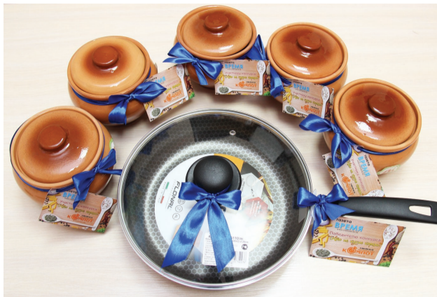
Наши призы не только приятные, но и полезные.