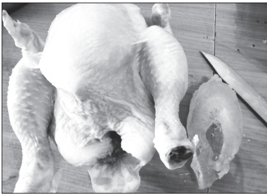
В курице на полтора кило нижнетуристка обнаружила ледышку весом в 300 грамм.