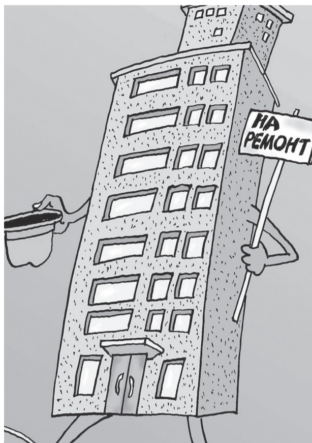
Иллюстрация с сайта http://caricatura.ru .

➢ Ремонт внутридомовых инженерных систем электро-, тепло-, газо-, водоснабжения, водоотведения;