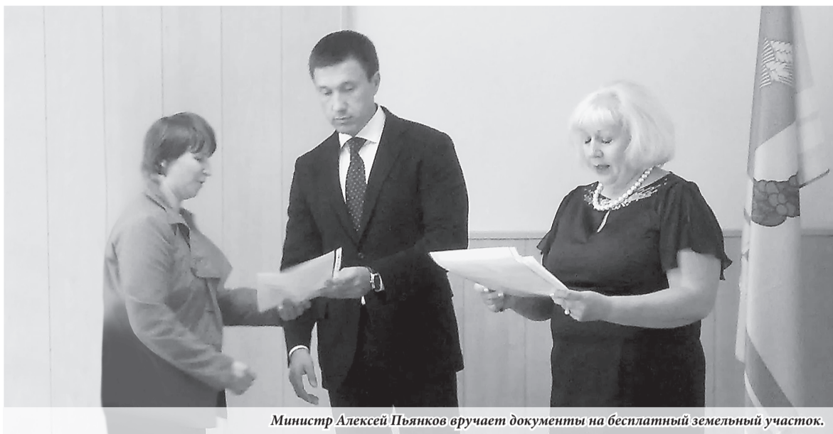
Министр Алексей Пьянков вручает документы на бесплатный земельный участок.

– МУГИСО максимально оперативно отреагировало на сложившуюся экономическую ситуацию, запустив ряд антикризисных мер. Так, в числе стабилизирующих мероприятий ведомством утвержден план по обеспечению устойчивого развития и повышения эффективности деятельности предприятий госсектора Свердловской области, а также предприятий агропромышленного комплекса области.