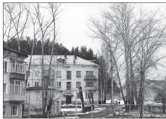
Граждан беспокоят разросшиеся тополя.

ВЕСЕННИЕ ветры принесли повод для беспокойства граждан, у домов которых растут высокие деревья. После нескольких подобных обращений в редакцию мы сделали запрос в администрацию НТГО и попросили разъяснить, как организован процесс подрезки крон деревьев.