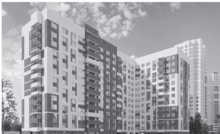
Сегодня в Свердловской области действует пилотный проект первого ЖСК «Альянс», для которого уже согласован эскизный проект дома.

Отмечу, что в Свердловской области за 2014 год и январь-март 2015 года специалистами ведомства возбуждено 88 дел об административных правонарушениях. В результате более 3,5 миллиона рублей административных штрафов было наложено по протоколам МУГИСО за нарушения в сфере охраны объектов культурного наследия.