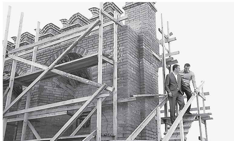
Специалисты МУГИСО контролируют процесс реставрации в Верхотурье.