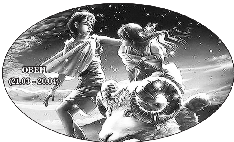
ОВЕН (21.03 - 20.04)