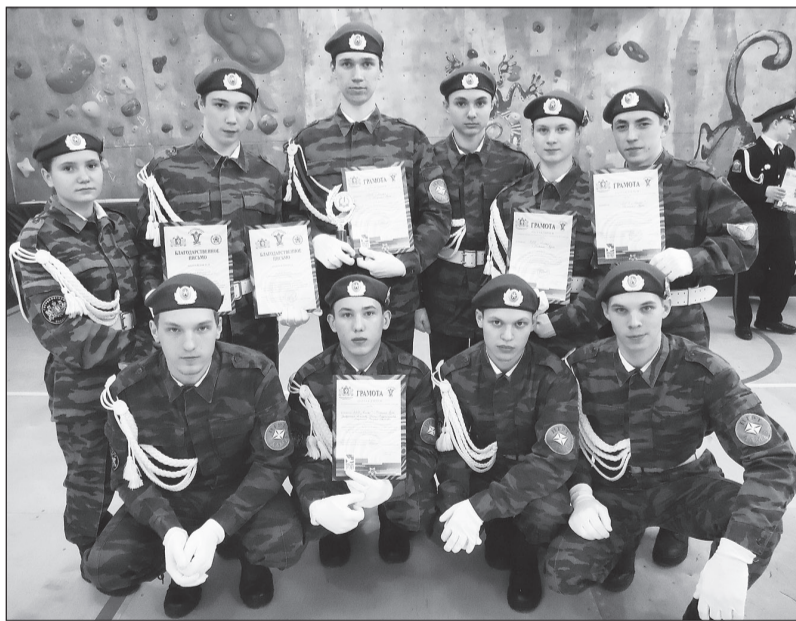
Команда клуба «Алмаз».