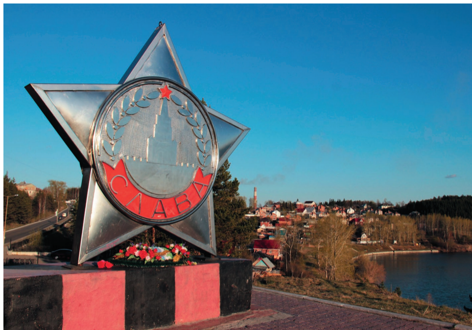
7 мая 1975 года состоялось открытие монумента «Солдатская слава».

- Пусть этот памятник напоминает молодому поколению о подвиге их дедов и отцов в Великой Отечественной войне. А мы, старые солдаты, горды тем, что сделали свое дело - отстояли честь и независимость нашей великой Родины.