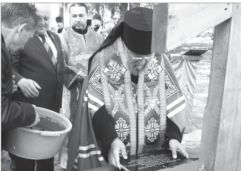
Епископ Нижнетагильский и Серовский Иннокентий заложил памятную табличку у подножия креста.