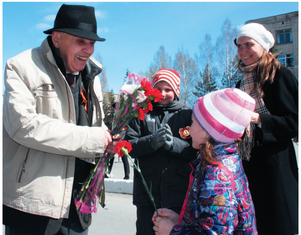
«Спасибо Вам за Победу!»

Окончание на стр. 2-3.