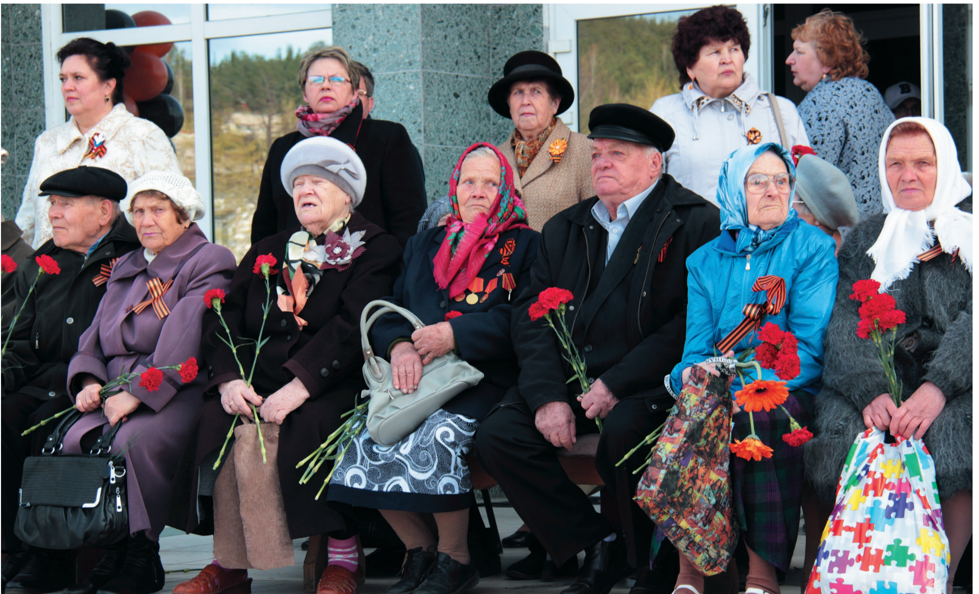
Почетные места на сцене для героев праздника – ветеранов Великой Отечественной войны и тружеников тыла.

Прошедшая неделя была насыщена событиями, посвященными 70-летию Победы в Великой Отечественной войне. Концерты, встречи с ветеранами, автопробег, спортивные состязания... Наивысшего накала праздничные страсти достигли 9 мая, когда по главным улицам округа в праздничных демонстрациях прошли тысячи людей, а небо озарилось вспышками салюта.