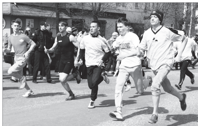
Участники юбилейной легкоатлетической эстафеты.

Ребята постарше бежали по 140 метров. Среди четвертых классов победила школа №7.