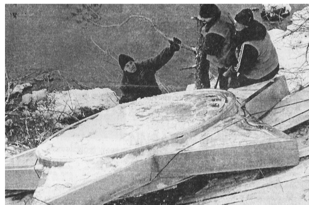
Чтобы достать «Звезду» из пруда, потребовалось несколько дней.