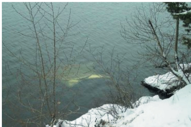
Не успев осуществить кражу, злоумышленники столкнули «Звезду» с обрыва.

В ночь с 9 на 10 декабря злоумышленниками была предпринята попытка хищения «Ордена Славы». Отключив освещение в «звездном квадрате», охотники за металлом не одну ночь работали ножовкой, спиливая стальные опоры. Продумав операцию до мелочей,