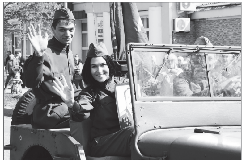
Артисты Дворца культуры облачились в форму военных лет.

бронированная разведывательно-дозорная машина и автомобили местного отделения ДОСААФ России.