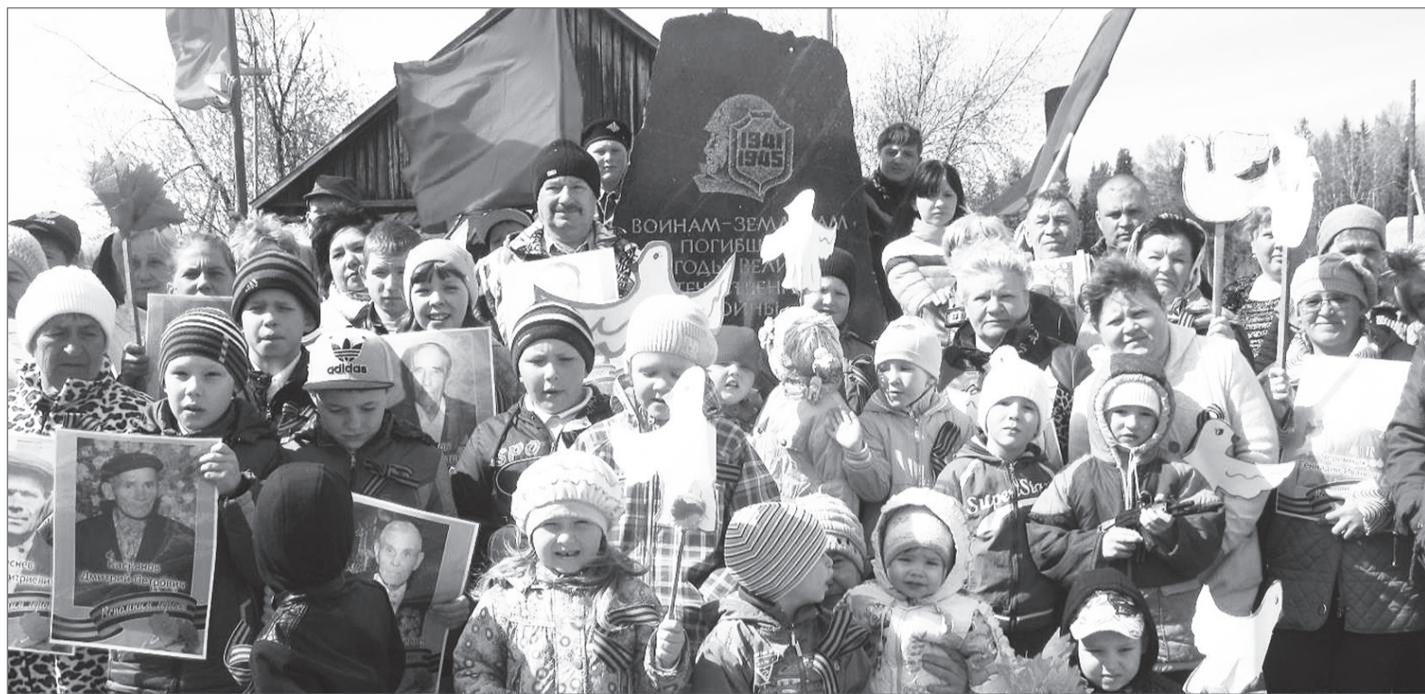
Жители посёлка Платина у мемориала воинам-землякам, погибшим в годы Великой Отечественной войны.

В каждом посёлке силами работников клубов и школ были организованы праздничные концерты. Традиционная солдатская каша в посёлках Платина, Косья, Сигнальный была встречена жителями на «Ура». Маленьких исовчан порадовала необычная для сель-