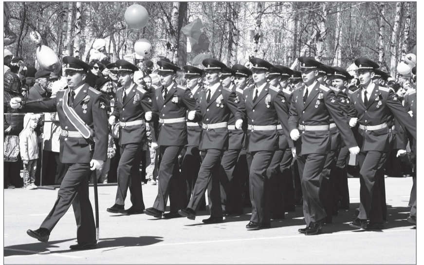
Праздничным маршем прошли военнослужащие г. Лесного.

Утро праздничного дня встретило людей пронизывающим северным ветром. К одиннадцати часам в центре города собрались сотни участников торжественного шествия: школьники, пенсионеры, работники городских предприятий и учреждений. В 11 часов колонна выдвинулась в направлении городской площади. Возглавляли шествие раритетный автомобиль Виллис,