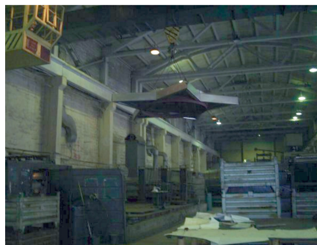
«Звезда» на реставрации в цехе ОАО «Вента».

они не предусмотрели одного - веса добычи. По проекту, вес ордена вкуче с гранитным основанием - полторы тонны. Осознав, что реализовать план кражи не удастся, воры столкнули со склона городскую реликвию.