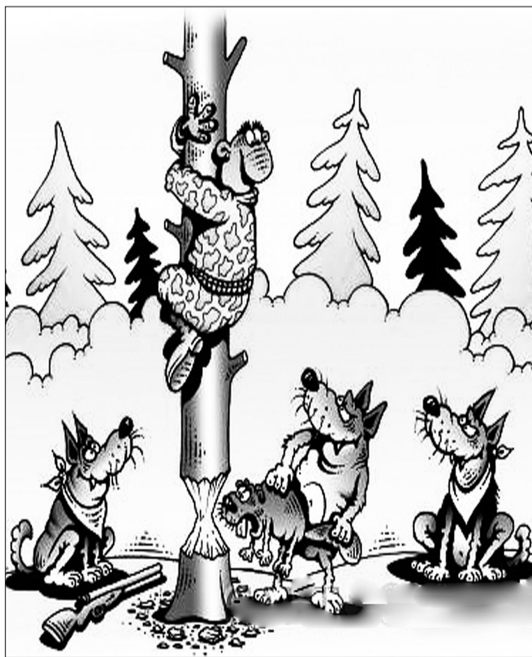
Иллюстрация с сайта http://caricatura.ru .