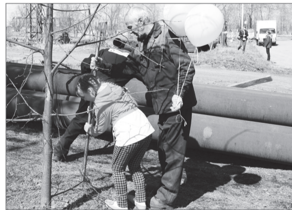
Замена табличек на липовой аллее.

А в День Победы весь завод присоединился к всероссийской акции «Бессмертный полк». 125 уже ушедших из жизни ветеранов Великой Отечественной войны в разное время работали на нашем предприятии. Память о них хранится на мемориальной доске заводского музея. При помощи редакции газеты «Время» были изготовлены портреты этих работников. 9 мая на Параде учас-