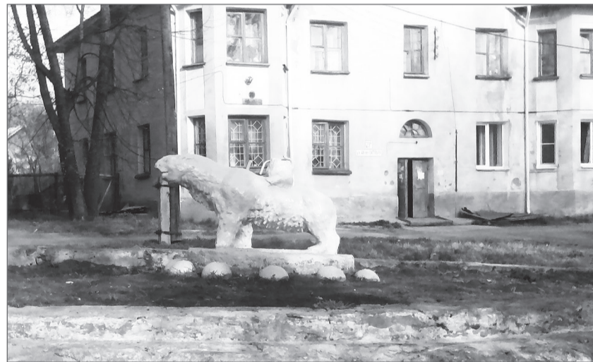
Не стали ждать дворника, а прибрались сами.

Дети близлежащих домов любят это место. Одиноким, без «всадни-