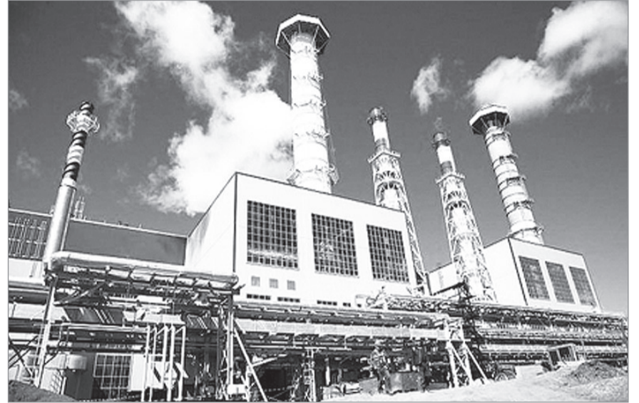
Наладка оборудования станции сопровождалась сильным гулом. Это обеспокоило нижнетуринцев.

Изменение относится только к статье 12.16 КоАП. Однако есть нарушения, за которые автомобили