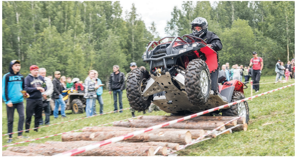
«Стиральная доска» для опытного байкера не препятствие.