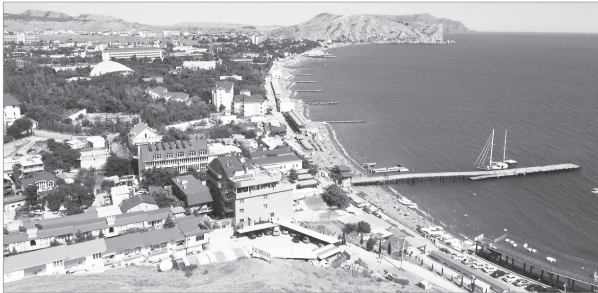
Вид на город Судак с Генуэзской крепости.

В Судак огромный пляж с шикарной гранитной набережной. В Интернете пишут, что это единственный пляж в Крыму с крупным кварцевым песком. Большая его часть бесплатна, но есть и закрытые санаторные участки. Имеется полный на-