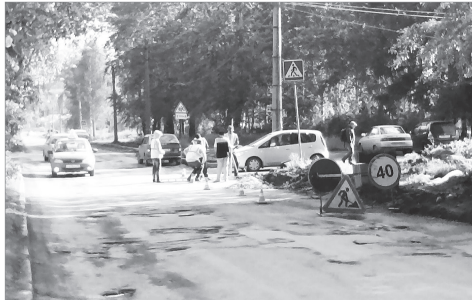
Нынешней осенью на улице Скорынина появятся новые тротуары.

- На всех объектах, где производятся дорожно-строитель-