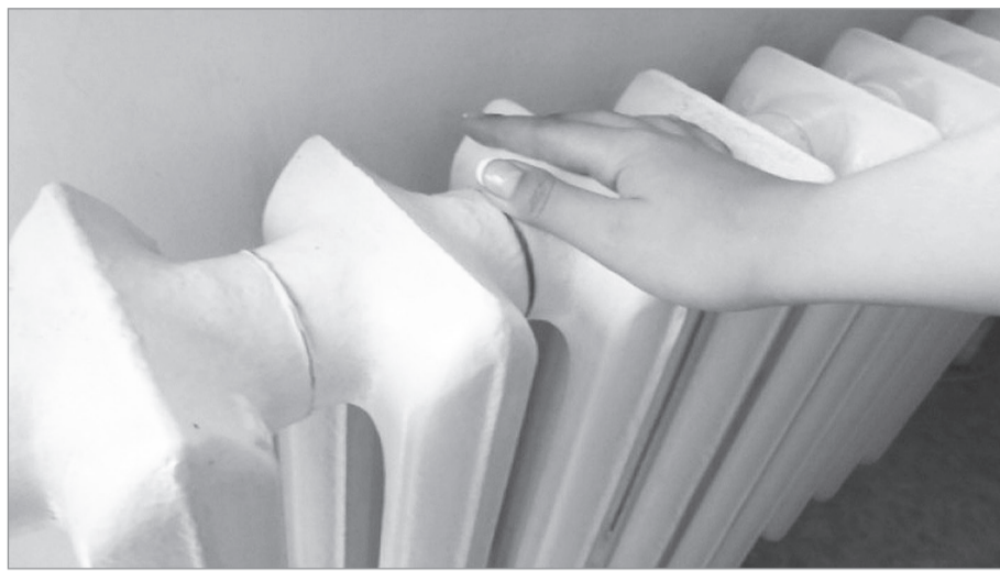
Зима в очередной раз станет проверкой качества подготовки к ней.

Основные силы бросили на локализацию порывов вышедших из строя квартальных тепловых сетей. С 10 августа проделан приличный объем работ, в том числе: произведена подсыпка отсева под новую пластиковую трубу, укладка 15 плит перекрытия, установка 18 метров бордюрного камня у дома по улице Ильича, 20а; устранены порывы теплосетей по улицам: Скорынина, 2, Пирогова, 8, Декабристов, 6, Нагорной, 6, Нагорной, 11; по