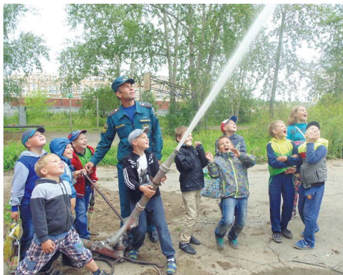
Учимся тушить огонь при условных возгораниях.

ПОД ЧУТКИМ наблюдением пожарных ребят, посещающие летний лагерь при школе № 3, попробовали потушить на территории 166-ПЧ «возгорание». Надо отметить, что возгорание было условным. А вот разговор о правилах пожарной безопасности - серьезным и поучительным.