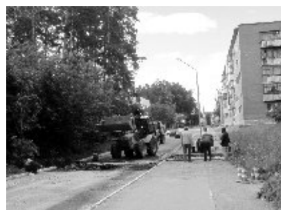
спрашивает жительница дома №19.

приподнимается край жёлоба. Из-за этого автомобили не могут проехать по дороге, разворачиваются и уезжают. В итоге постоянные пробки в этом месте, аварийная ситуация. Как городские власти собираются урегулировать эту ситуацию?» -