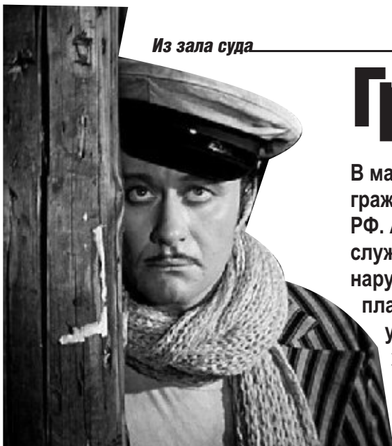
Из зала суда