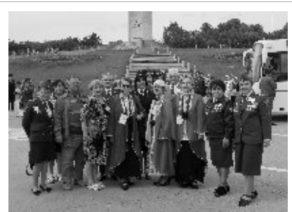
В каждом городе ветеранов МВД встречали их коллеги

Из этой поездки Областной совет ветеранов МВД вернулся с подписанными Соглашениями о дружбе и сотрудничестве с регионами, в которых побывала делегация. Такого проекта нет ни в одной области России. Свердловским проектом ветеранов заинтересовались руководители местных администраций. О пребывании бывших сотрудников МВД в различных городах оперативно выходили репорта-