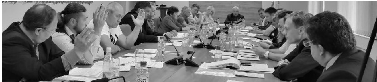
Депутаты одобрили очередную муниципальную гарантию в 5 млн

Чем сегодня живут МУПы и сколько им надо бюджетных денег для полного счастья? Ответы на эти и другие вопросы прозвучали на прошлой неделе на заседаниях депутатских комиссий, куда были приглашены руководители всех муниципальных предприятий Заречного.