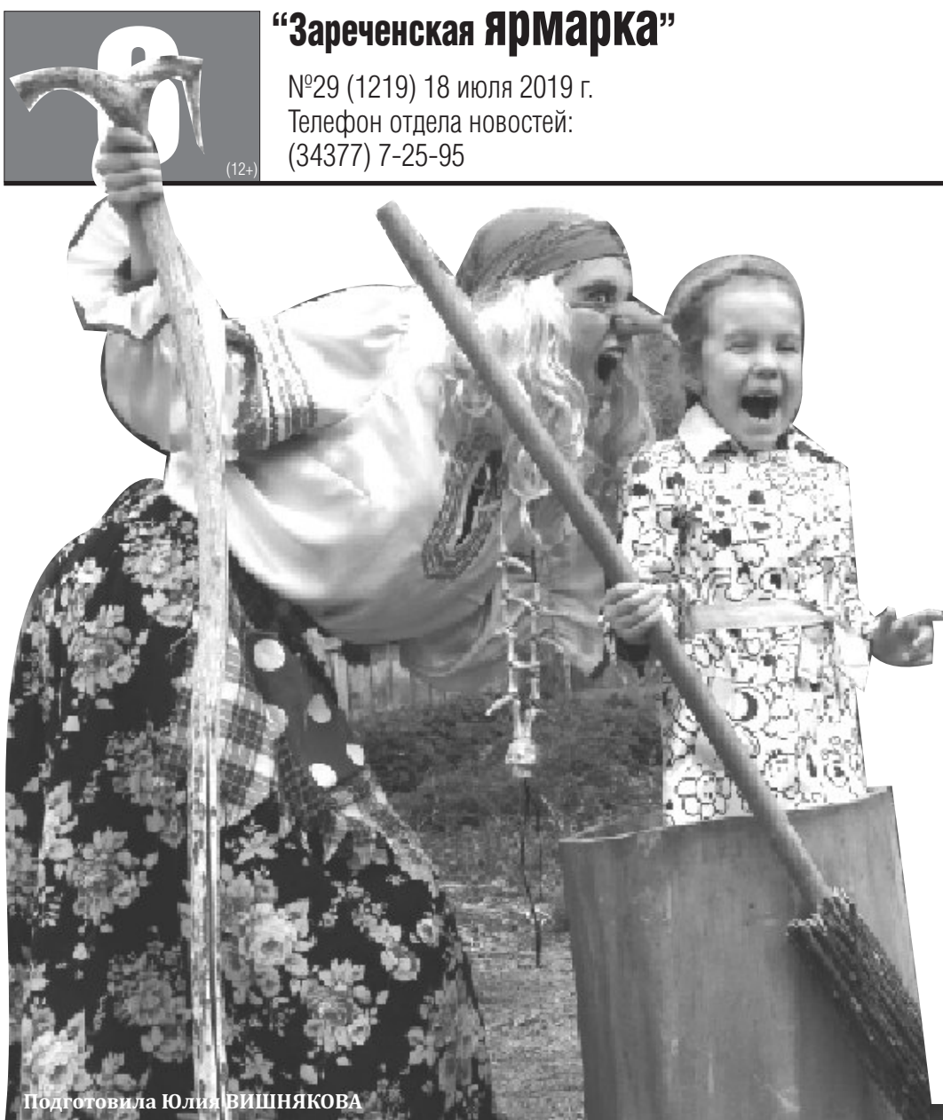
Подготовила Юлия ВИШНЯКОВА

Так уж повелось, что летом сидеть в городе становится неловко. Душа рвётся на поиски приключений. Чтобы сменить обстановку и оказаться в необычном и интересном месте, вовсе не обязательно брать отпуск и покупать билет на самолёт, так как удивительных, красивых и уникальных