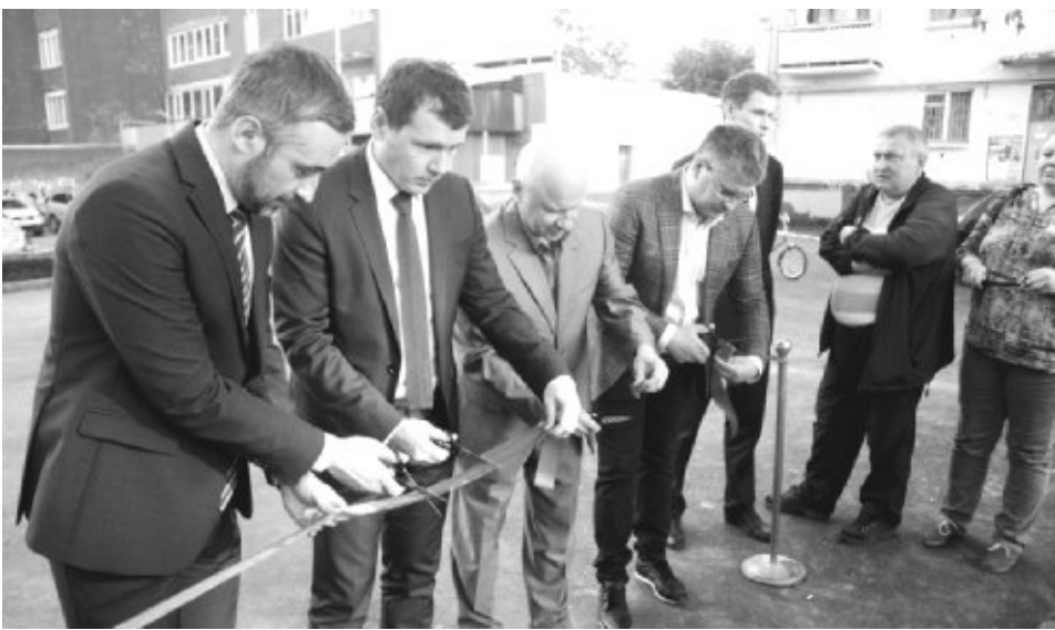
фото с указанных источников