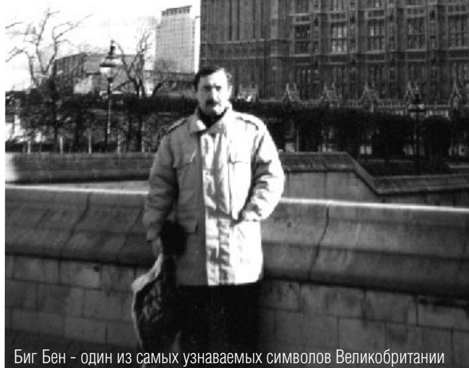
Биг Бен - один из самых узнаваемых символов Великобритании

но не все работодатели могут сформулировать: а чему учить-то? Мы, не имея нормального профессионального стандарта, начинаем лепить образовательный. И это наша главная ошибка. Силы идут не на содержательную часть, а на бумажную составляющую. От этого страдают преподаватели. Ещё одна наша большая беда в том, что в управление может по-