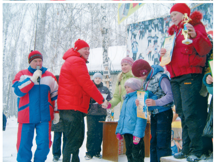
Протокол результатов лыжной эстафеты на призы газеты «Знаменка» на стр. 10.