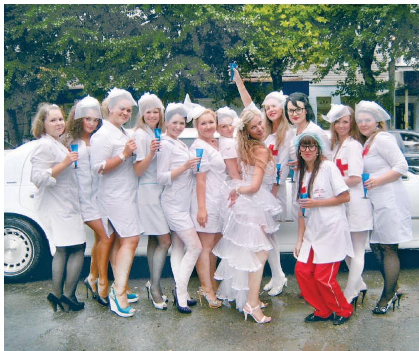
ФОТО НЕДЕЛИ «Девичник»