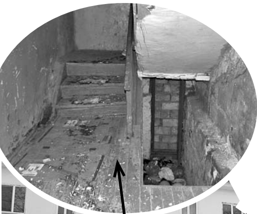
На снимках: грязный и чистый подъезды одного и того же дома; объявление в чистом подъезде