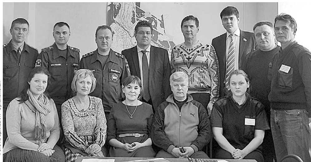
На снимке: участники оперативного штаба по ликвидации аварии на водоводе.

В августе сотрудники компании приняли активное участие в размещении вынужденных переселенцев с Украины, организовали сбор вещей и средств первой необходимости.