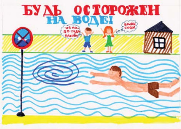
Даша Эрдле, 10 лет