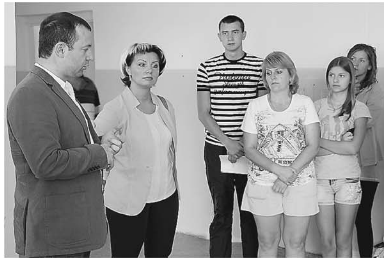
Встреча с переселенцами с Украины

– В их глазах я увидел отчаяние и в то же время надежду на новую жизнь, вдали от бомбёжек, выстрелов и кровопролития. Всех граждан, приезжающих к нам с территории Украины, в первую очередь интересуют вопросы по оформлению документов и приращению статуса беженца, бла-