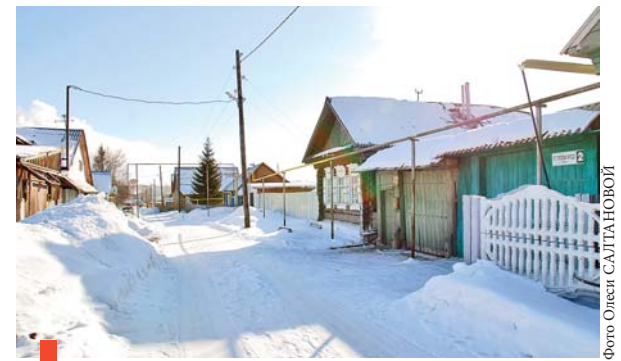
Улица 93 Стрелковой Бригады в гортоне