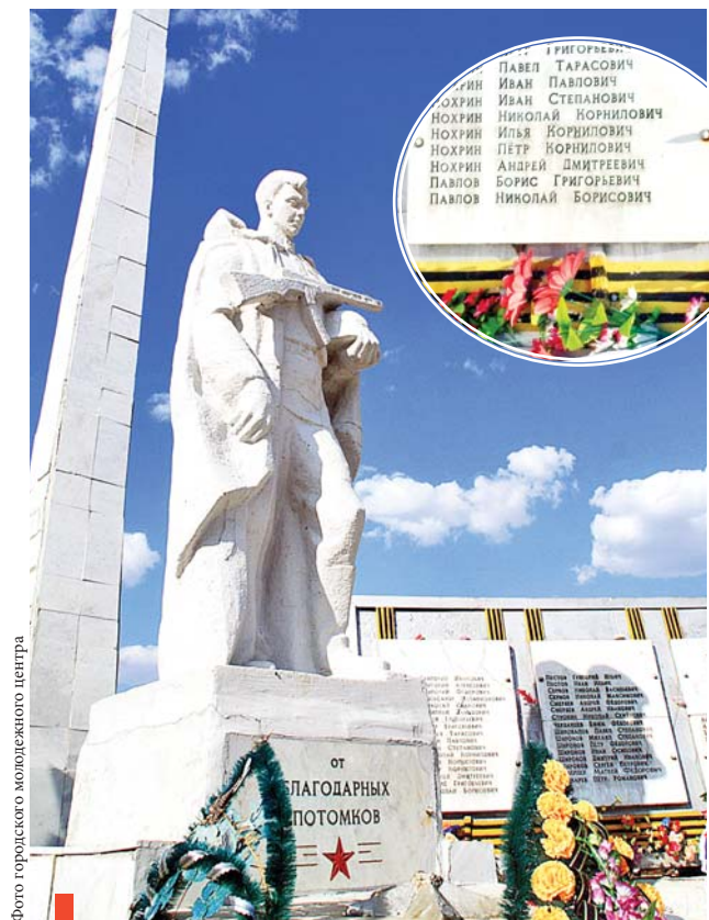
Мемориальный комплекс в селе Филатовском