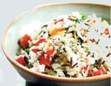
Рис отварить в подсоленной воде. Овощи нашинковать, смешать с охлажденным рисом, посолить, посыпать перцем, добавить по вкусу сахар и столовый или яблочный уксус.

100 г риса, 2 сладких перца, 1 помидор, 1 морковь, 1 маринованный огурец, 1 луковица.