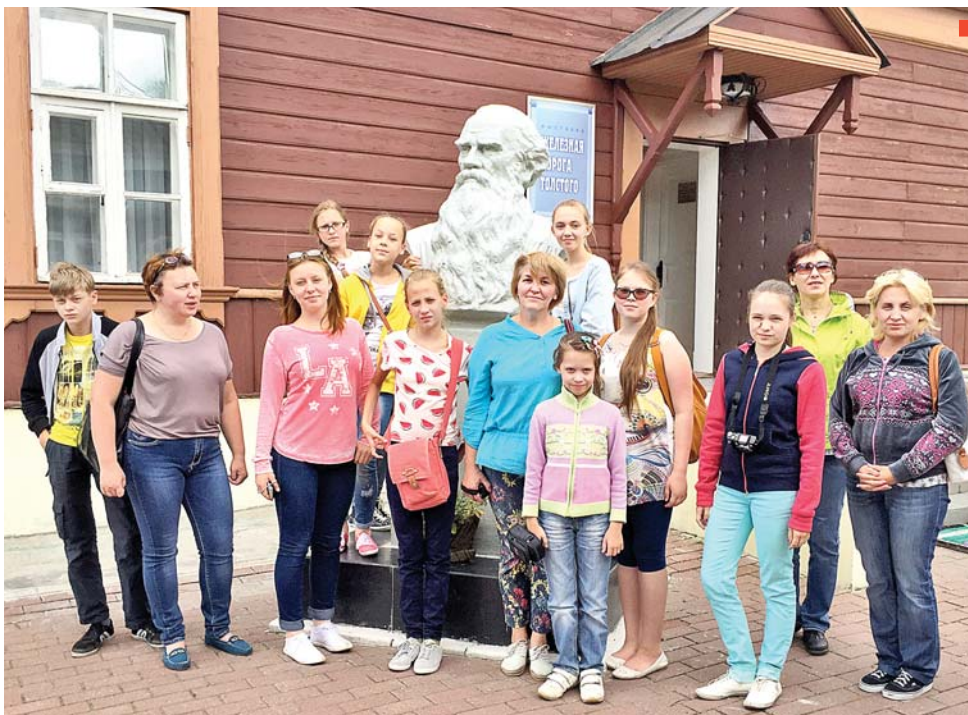
Музей Льва Николаевича Толстого на железнодорожной станции Козлова Засека

Казалось бы, город уже удивил всем. Но впереди нас ждал ещё и музей оружия. Необычна сама форма здания – в виде шлема русского воина.