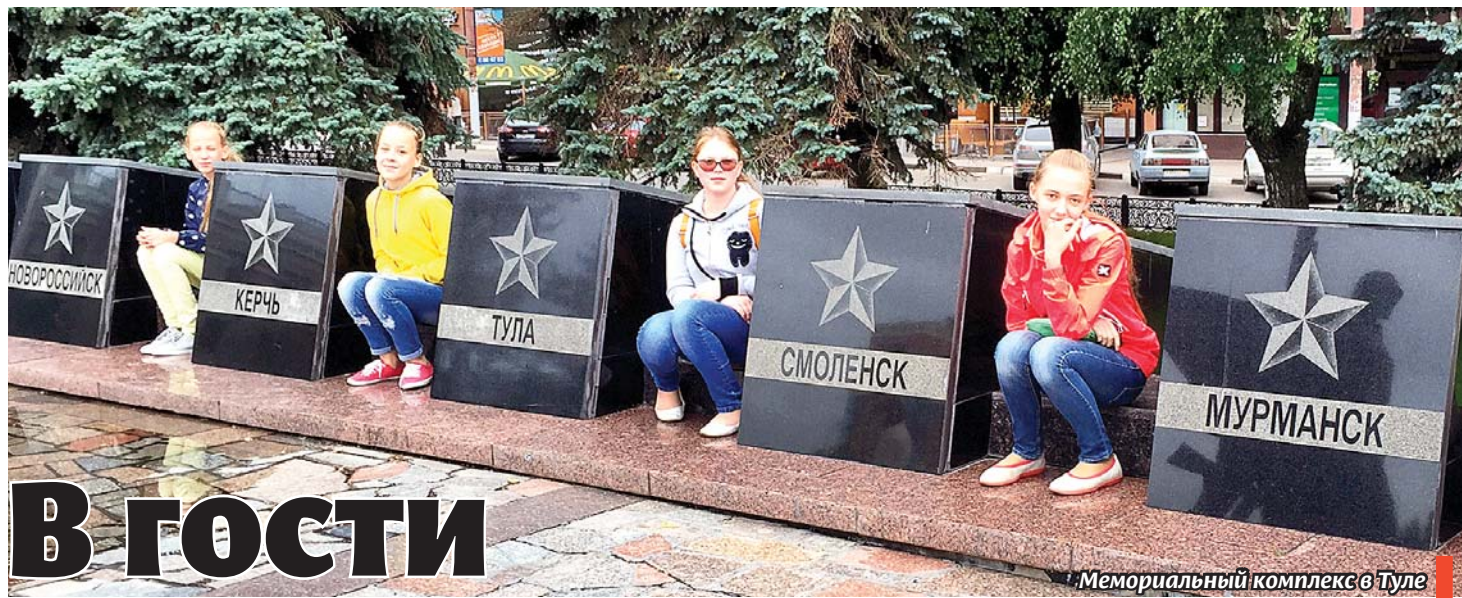
Мемориальный комплекс в Туле