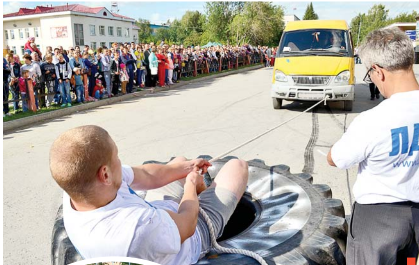
Тянем-потянем, вытянуть можем!

Впервые в городском округе прошло соревновательное шоу силово-