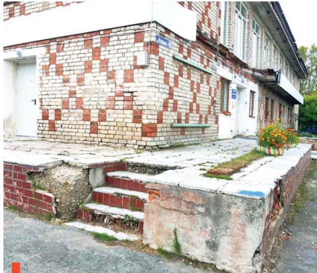
Фасад Дома культуры по-прежнему ждет ремонта

Опасаются филатовцы только одного: что инициатива будет воспринята как должное, и ремонт Дома культуры отложится на неопределенное время. Между тем в удручающем состоя-