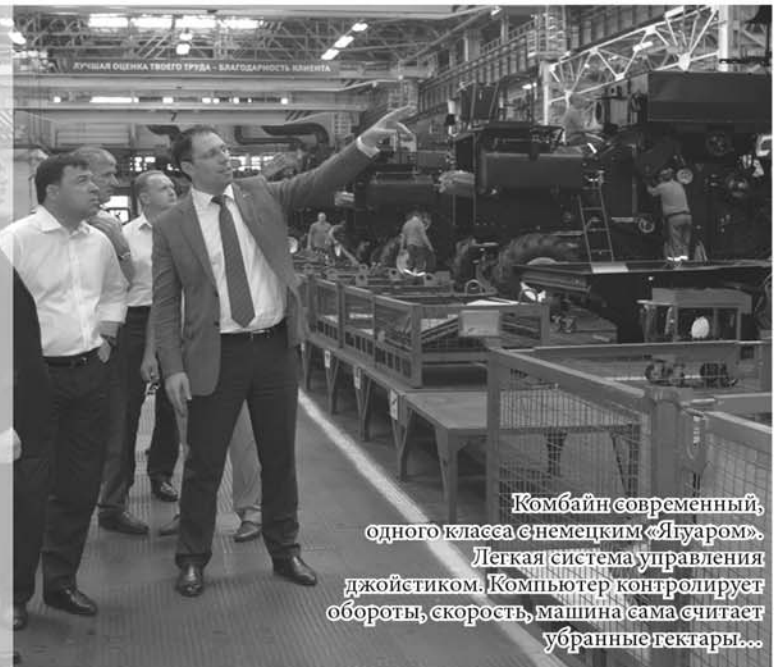
Комбайн современный, одного класса с немецким «Ягуаром». Легкая система управления джойстиком. Компьютер контролирует обороты, скорость, машина сама считает убранные гектары...