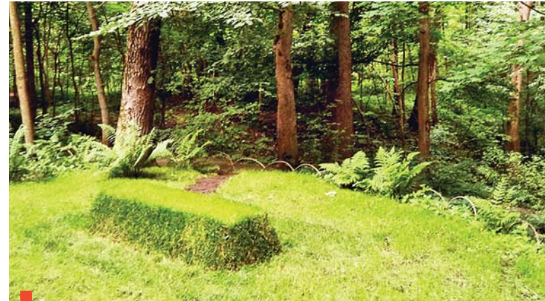
Могила Льва Толстого в родовом имении Ясная Поляна