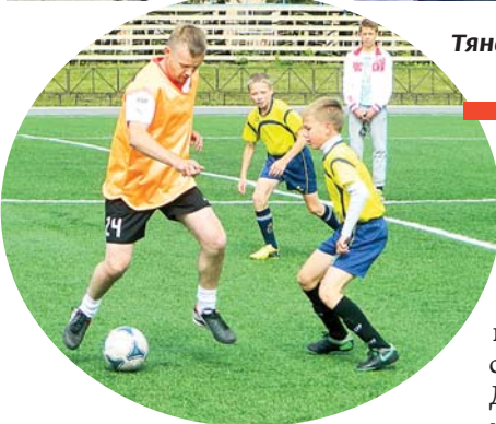
Дети против родителей