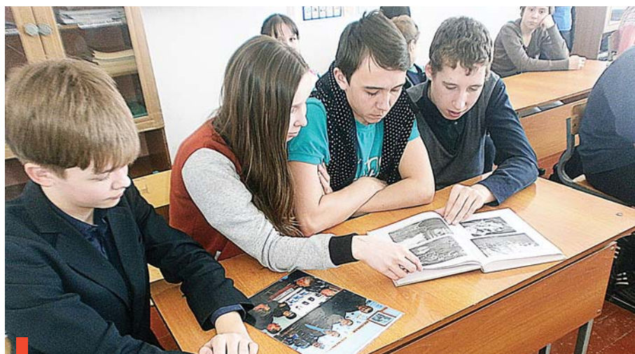
Урок мужества в школе №11