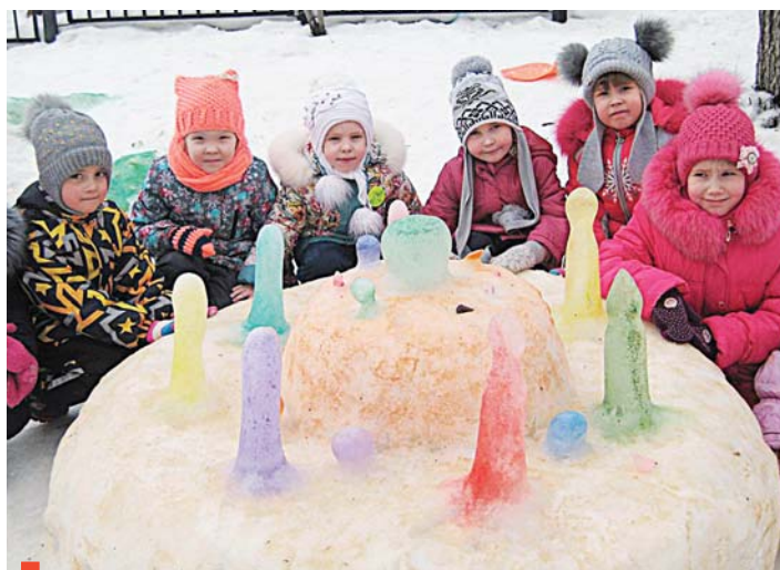
С тортом на прогулке веселее