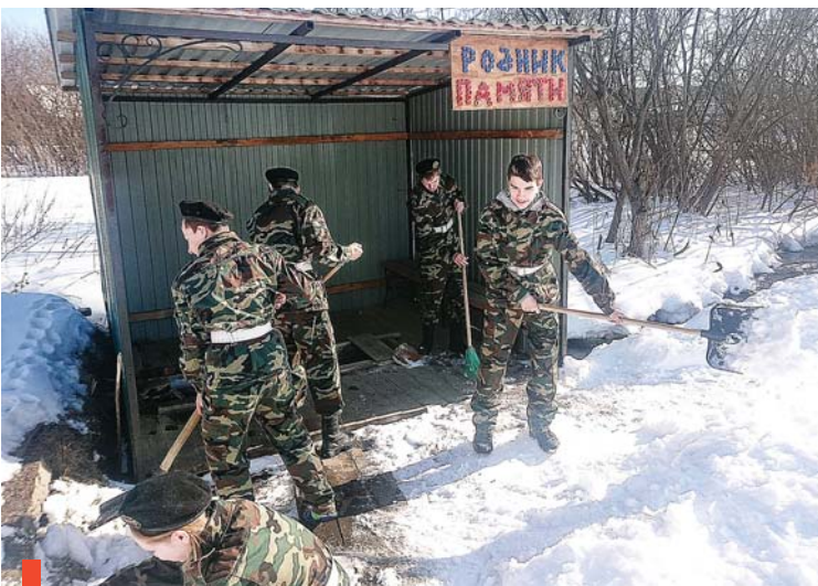
Субботник на роднике

Курьинские школьники приняли участие в едином уроке «Я помню! Я горжусь!», который прошел 11 марта, в День народного подвига.