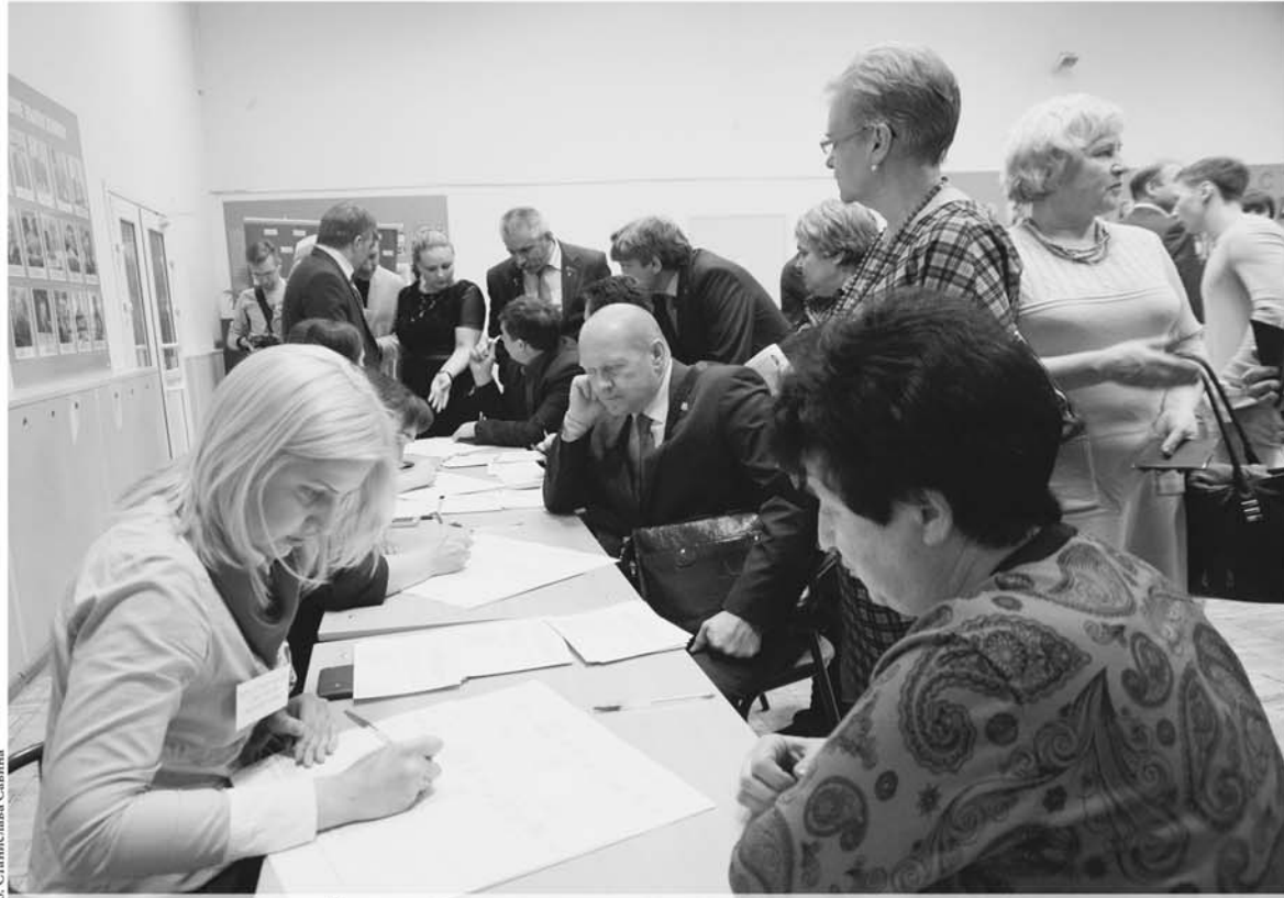
Есть мнение, что в перспективе такое предварительное голосование станет традиционным.