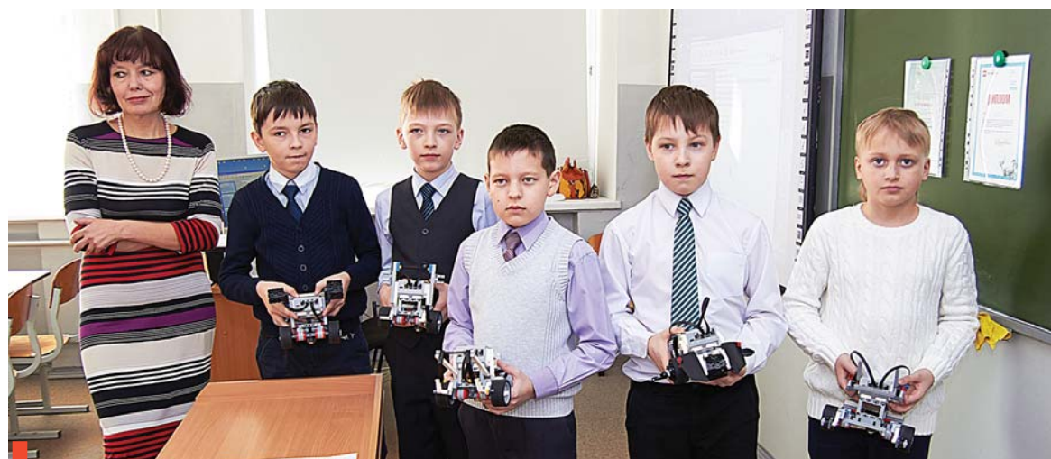
Ученики четвертого класса самостоятельно собирают действующие модели роботов

ков гимназии за 2015 год по 11 предметам из 12 соответствуют уровню статусных учреждений области, а по восьми – превышают среднее значение!