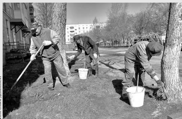
Дворники наводят порядок в юго-западном микрорайоне