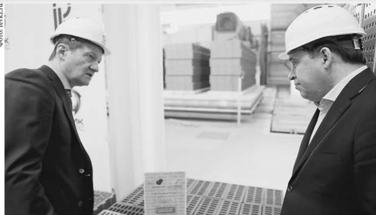
На ОАО «Ревдинский кирпичный завод» (предприятие УГМК) в апреле пущен в эксплуатацию цех по производству крупноформатного поризованного блока.

Губернатор Евгений Куйвашев 17 мая участвовал в заседании Государственного совета, посвященного развитию строительного комплекса и совершенствованию градостроительства, которое в Москве провёл Президент России Владимир Путин.