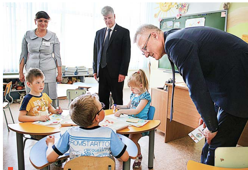
Высокие гости – у воспитанников детского сада №39

Побывал областной чиновник и в паллиативном отделении, открытом год назад. Отметил, что площадь отделения позволяет увеличить количество койко-мест. Поговорили и о других планах, а их у главного врача РБ на пятилет-