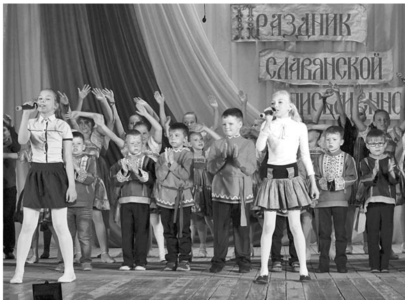
На сцене участники праздника – юные курьинцы