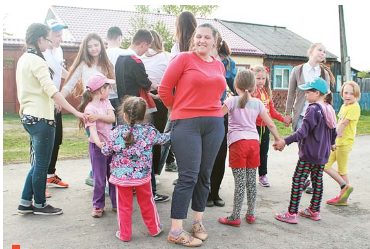
Играем в «Путаницу»

Следующей площадкой для игр станет двор по ул. Степ-