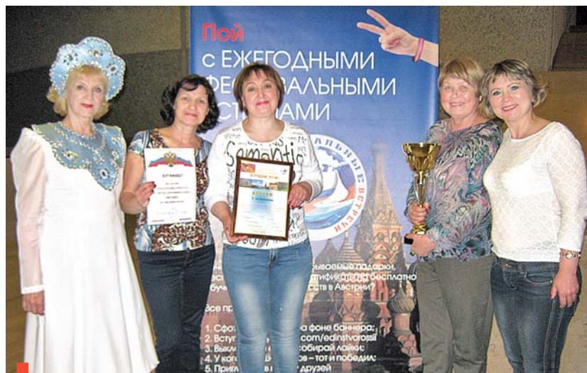
Коллектив «Мозаики» с наградами