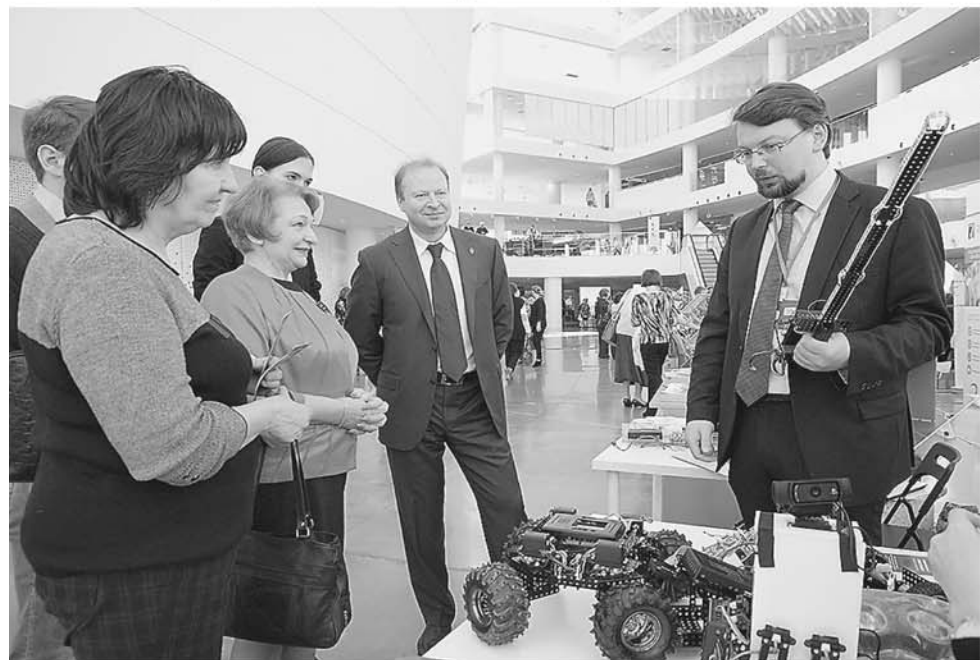
На площадке УрГПУ размещен комплекс стенового оборудования для изучения основ электромеханики, электроэнергетики и электроники общей стоимостью более 1 млн рублей, 3D принтер и робототехнические наборы стоимостью более 1,5 млн рублей.