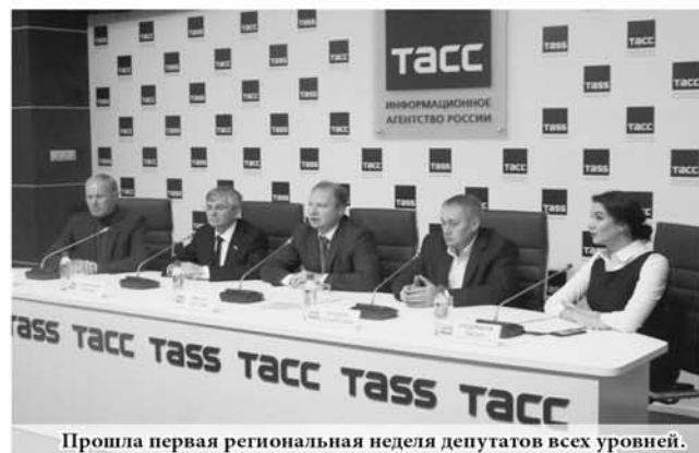
Прошла первая региональная неделя депутатов всех уровней.

Кульминацией региональной депутатской недели стало первое собрание депутатской вертикали – депутатов Государственной Думы, Заксобрания Свердловской области и Екатеринбургской городской думы.