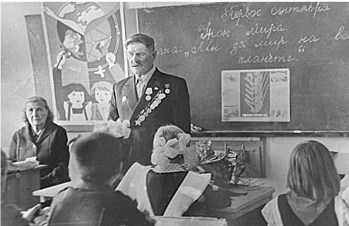
На уроке мира в школе села Филатовского, 1980-е годы

В деревне Камень нас окружили выжившие женщины. Они опознали в нашем пассажире фашиста, который в свое время сильно лютовал и издевался над жителями. Женщины набросились на него, стащили с бронетранспортера и начали колотить и таскать за волосы. Не знаю, чем бы закончилась