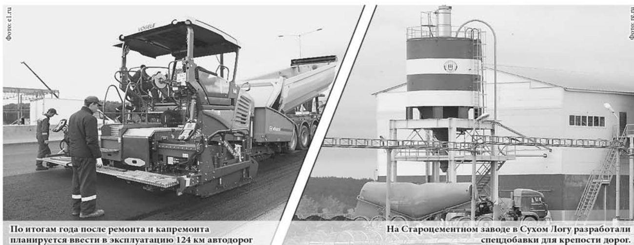
По итогам года после ремонта и капремонта планируется ввести в эксплуатацию 124 км автодорог

2016 год стал рекордным в сфере дорожного строительства. Удалось увеличить объём бюджетных ассигнований Дорожного фонда Свердловской области более чем на 4,5 млрд. рублей. Муниципалитетам на строительство, реконструкцию и ремонт дорог выделено более 5 млрд. рублей, что почти в 2,5 раза больше, чем в 2015 году. Такие данные привёл губернатор области Евгений Куйвашев в бюджетном послании Заксобранию региона. По его мнению, в современных условиях это беспрецедентные средства, результатом вложений которых должны стать современные, качественные дороги, повышение транспортной мобильности и безопасности уральцев.