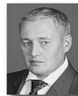
Андрей Альшевских, депутат Госдумы РФ:

«Если финансирование дорожной деятельности сохранится на уровне 2016 года, то в ближайшие три года все наболевшие задачи по региональной сети автодорог будут решены. Проектные работы ведутся со значительным задёлом, мы работаем на предупреждение – поэтому при увеличении финансирования с новыми объёмами ремонтно-строительных работ мы успешно справимся».