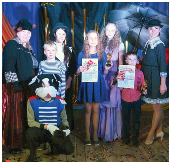
Фото на память с Мэри Поппинс