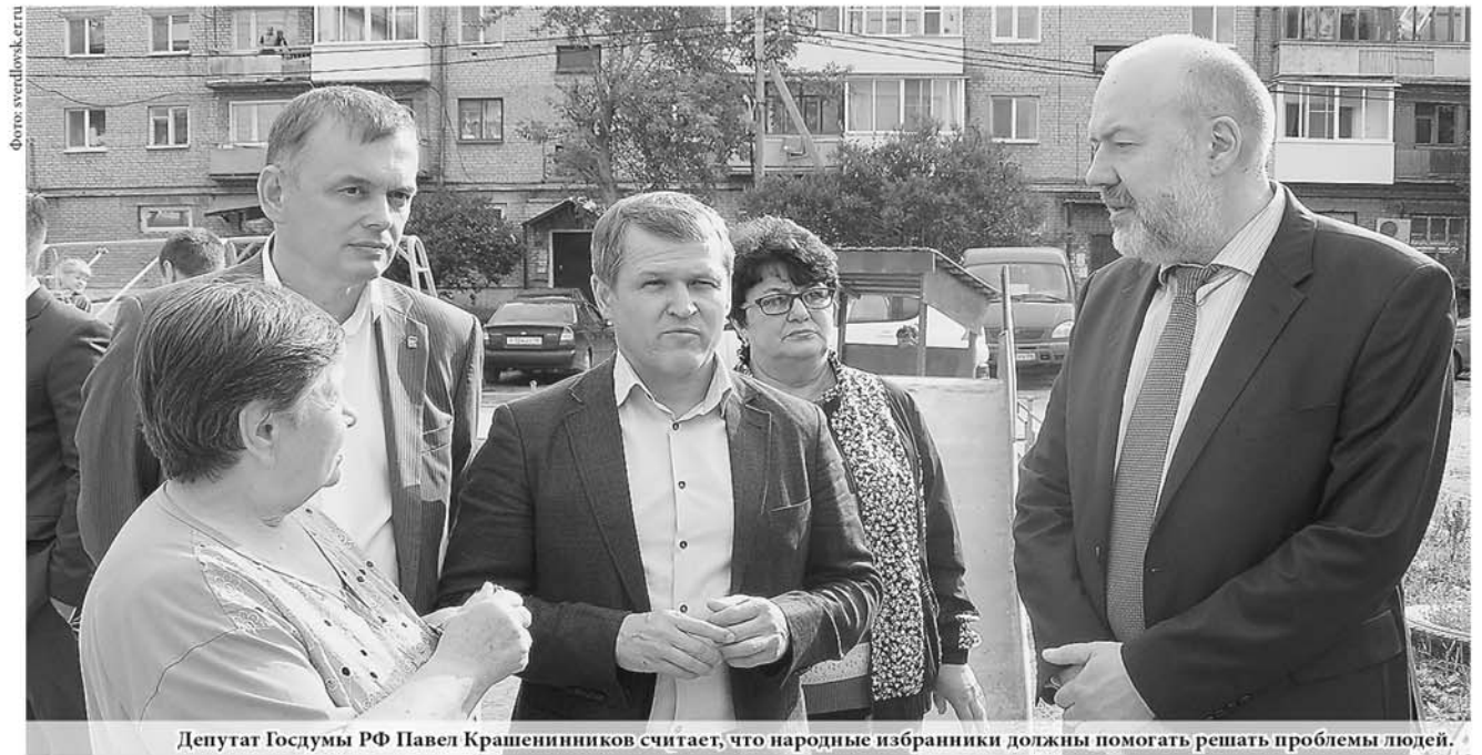
Депутат Госдумы РФ Павел Крашенинников считает, что народные избранники должны помогать решать проблемы людей.

Более 20 личных приёмов провели депутаты Государственной Думы РФ VII созыва от Свердловской области в течение прошедшей первой региональной недели. Кроме того, парламентарии встретились с коллегами из областного Заксобрания и местных дум, общественниками, экспертными сообществами, журналистами, провели серию рейдов и сформировали «депутатскую вертикаль». Главная цель региональных недель – сохранить сложившуюся во время избирательной кампании «драгоценную коммуникацию» между гражданами и кандидатами, а ныне – депутатами Государственной Думы. Отметим, следующая депутатская неделя состоится через три недели.