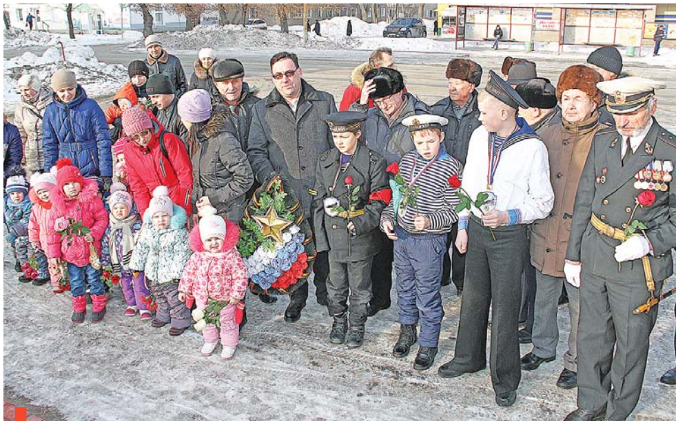
У обелиска Славы – четыре поколения Лихая казачья конница

Для представителей воинских организаций почтене памяти сослуживцев 23 февраля – это традиция. А вот для самых маленьких воспитанников детсада №44 участие в серьезном взрослом мероприятии в новинку. К обелиску ранним утром дети пришли вместе с родителями. Каждый принес по два цветка, чтобы поблагодарить тех, кто ради счастливой жизни и мирного неба не пожалел жизни.