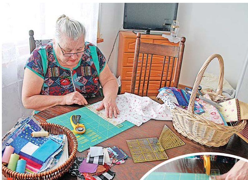
Ювелирный раскрой ткани

Бывалые рукодельницы знают, что существует целая пэчворк-индустрия. Продаются специальные ткани и текстильные наборы, инструменты, нитки. Самыми качественными