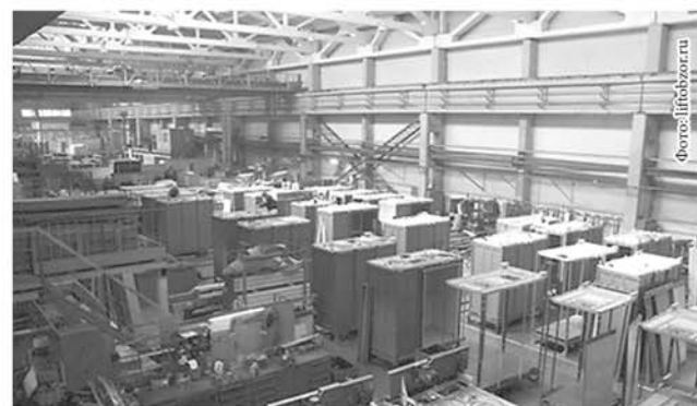
Уральский лифтостроительный завод – один из первых заводов производства лифтов в стране, работает с 1903 года. Лифты производства УЛЗ активно используются по всему миру и в нашей стране: на предприятиях, электростанциях, в жилых домах и даже на Байконуре.

«Наша задача – создать людям не только безопасные, но и комфортные условия проживания. И сделать это можно только при единовременном ремонте всего дома, избавив жильцов от тех неудобств, которые доставляют ежегодные локальные «стройки».