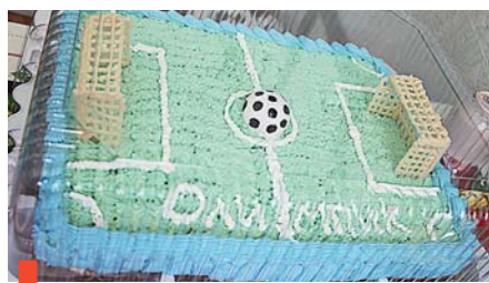
Сладкий приз за победу И девчонки любят играть в хоккей