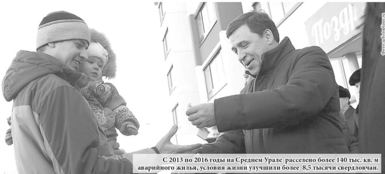
С 2013 по 2016 годы на Среднем Урале расселено более 140 тыс. кв. м аварийного жилья, условия жизни улучшили более 8,5 тысячи свердловчан.