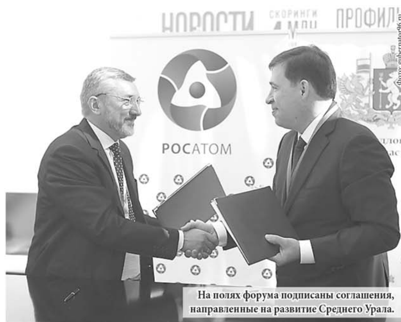
На полях форума подписаны соглашения, направленные на развитие Среднего Урала.