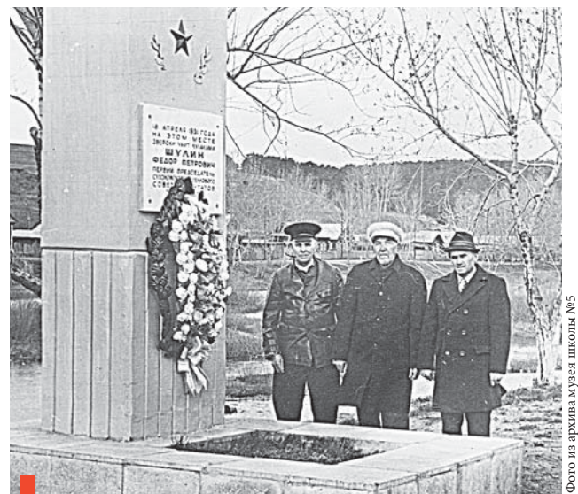
Памятник Федору Шулину, 1972 год

Тело покойного было отправлено на родину для захоронения, а факт убийства использован для усиления борьбы с кулачеством и ускорения темпов коллективизации.