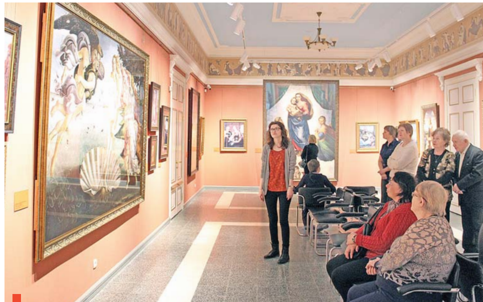
Ирбитский музей изобразительных искусств. В зале копий живописных шедевров

Как город музеев и энтузиастов-музейщиков открылся сухоложцам Ирбит. Экскурсионный день пролетел со скоростью реактивного самолета, но укрепил в желании вернуться на ирбитскую землю и посмотреть музейные сокровища.