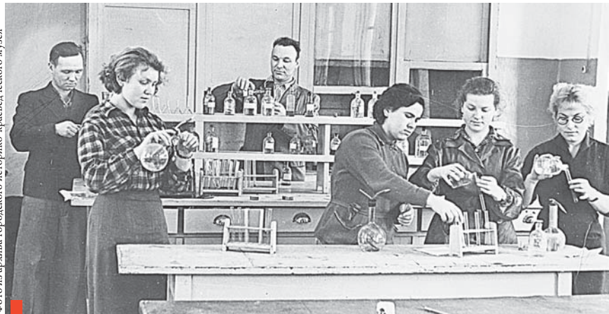
Занятие в лаборатории техникума, 60-е годы

Великое дело подготовки профессиональных кадров для промышленности не прошло испытания перестройкой: 15 января 1991 года техникум был закрыт.