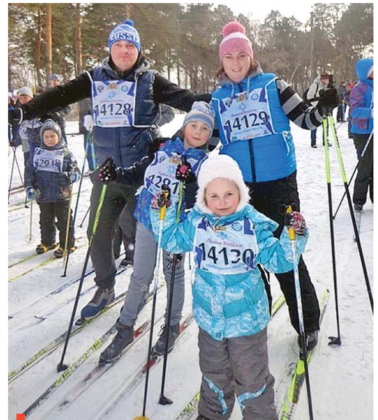
Одна из семейных традиций – лыжные походы