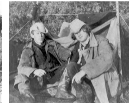
Хронику сплава зафиксировал фотоаппарат «Смена»

реке вокруг нас, но ни одна к нам в котелок не попала.