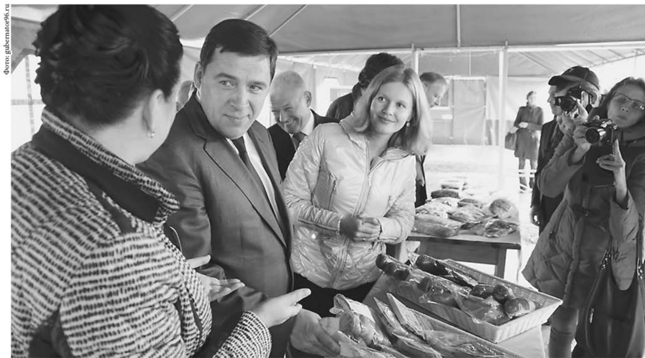
В Серове проект строительства свиноводческого комплекса на 250 тысяч голов предполагает полностью замкнутый производственный цикл: от производства кормов до готовой продукции, по принципу «от поля до прилавка». Ежегодно комплекс будет выпускать 40-45 тысяч тонн мяса.

Планируется создать территории опережающего развития в Лесном и Новоуральске , заявки которых начнут рассматриваться в этом году.