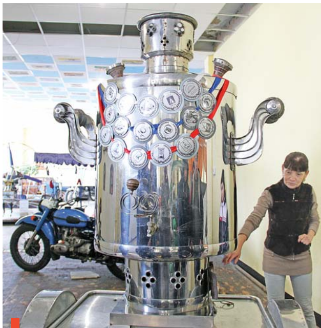
Самый большой в России мотосамовар

ные репродукции предельно точно повторяли и размер оригиналов, и тончайшие оттенки цвета, и нюансы света и тени. В одном выставочном пространстве оказались картины, подлинники которых находятся в коллекциях разных музеев и галерей земного шара: Флоренции, Рима, Парижа, Кракова, Мадрида, Санкт-Петербурга, Дрездена, Вашингтона и других городов. Возле шедевров Рафаэля Санти, Сандро Боттичелли, Леонардо да Винчи, Караваджо думалось о высоком и вечном. Магическую энергетику великих картин усиливала и обстановка ирбитского музея – современная и в то же время утонченная. По задумке инициато-