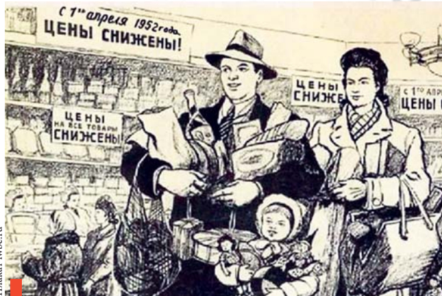
Плакат советских времен

В 1952-м покупателей порадовали 10-процентным снижением цен на молоко, сахар и витамины, 12-процентным – на хлеб, 15-процентным – на мясо, масло и кофе, 20-процентным – на чай, мясные консервы, фрукты и соки. На 18% стало дешевле покупать книги.