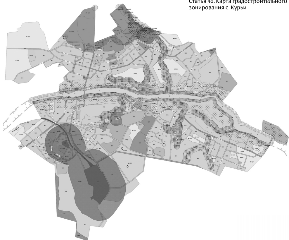
Статья 46. Карта градостроительного зонирования с. Курьи