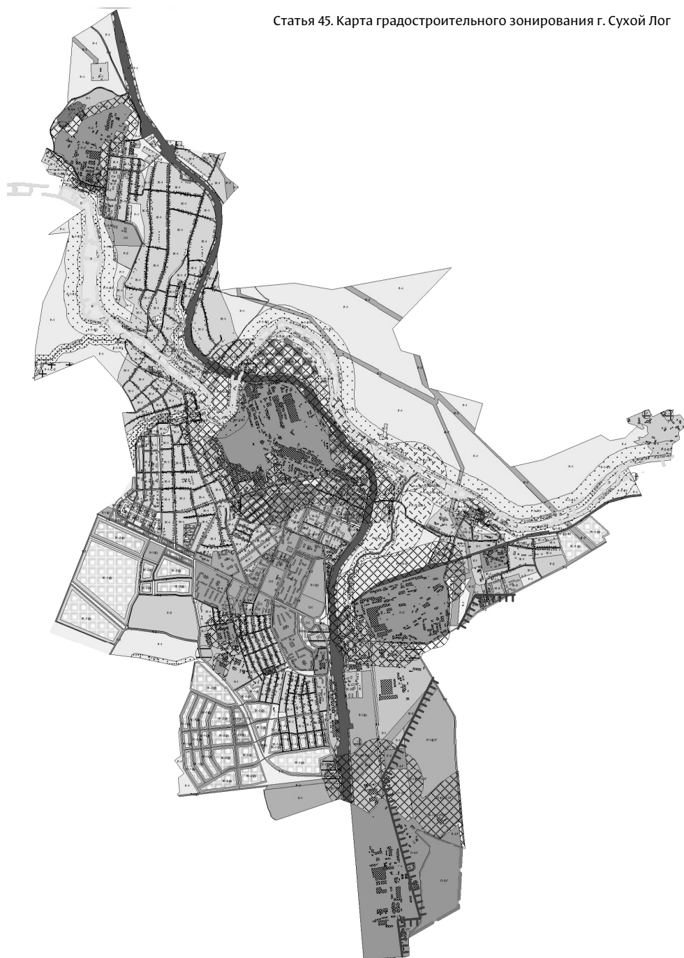
Статья 45. Карта градостроительного зонирования г. Сухой Лог