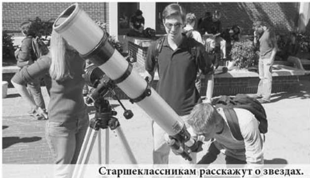
Старшеклассникам расскажут о звездах.

Одним из нововведений в 2017-2018 учебном году станет появление в школьном расписании астрономии. Как отмечают в региональном мин-образовании, пока не внесены изменения в базисный учебный план, но рекомендации министерства образования и науки России уже доведены до школ. Планируется, что новая дисциплина по решению школ появится в расписании учеников 10-11 классов. Предполагается, что повышение квалификации педагогов будет проводиться в Институте развития образования Свердловской области.