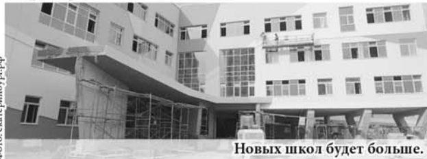
Новых школ будет больше.

В настоящее время в Екатеринбурге идёт строительство второй очереди школьного комплекса в Академическом районе, в посёлке Мичуринский возводится образовательный центр, а в Полевском – пристрой к школе №14.