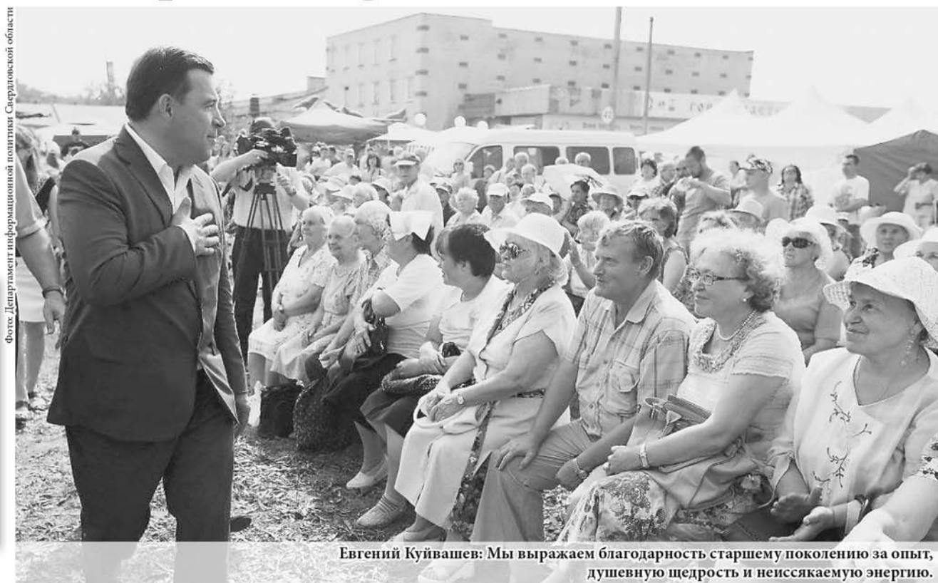
Евгений Куйвашев: Мы выражаем благодарность старшему поколению за опыт, душевную щедрость и неиссякаемую энергию.

«Быть нужным и полезным обществу возможно в любом возрасте – вот главный посыл Дня пенсионера, перекликающийся с нашей программой «Пятилетка развития». Центральное место в ней занимает человеческий потенциал, качество жизни уральцев, которое мы должны повышать, выводя Свердловскую область в тройку регионов-лидеров».