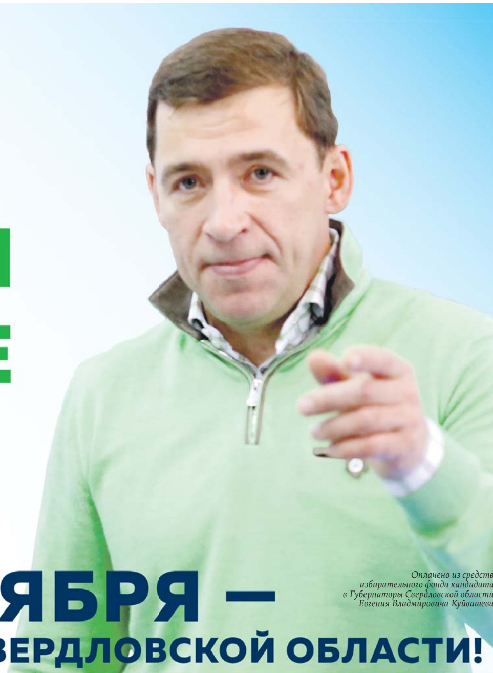
Оплачено из средств избирательного фонда кандидата в Губернаторы Свердловской области Евгения Владимировича Куйвашева

10 СЕНТЯБРЯ – ВЫБОРЫ ГУБЕРНАТОРА СВЕРДЛОВСКОЙ ОБЛАСТИ!