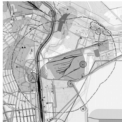
Схема расположения санитарно-защитной зоны АО «Сухоложское литье» 300 м (фрагмент г. Сухой Лог)