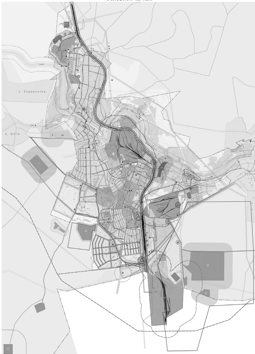
Схема расположения санитарно-защитной зоны АО «Сухоложское литье» 1000 м (фрагмент г. Сухой Лог)