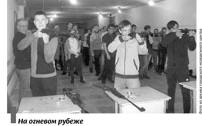
На огневом рубеже