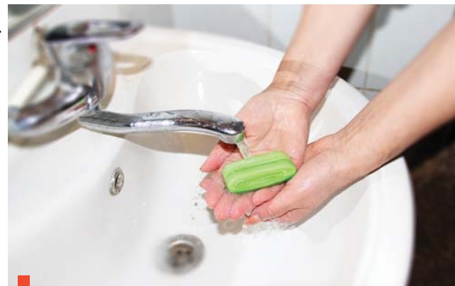
Коль не хочешь быть больной, руки мой перед едой!

Инфекция распространяется контактно-бытовым путем. Поэтому необходимо в кратчайшие сроки провести генеральную уборку с дезинфицирующими средствами в детских садах, школах и... домах и квартирах, где живут дети. На утреннем приеме малышей в детских садах сотрудники вправе