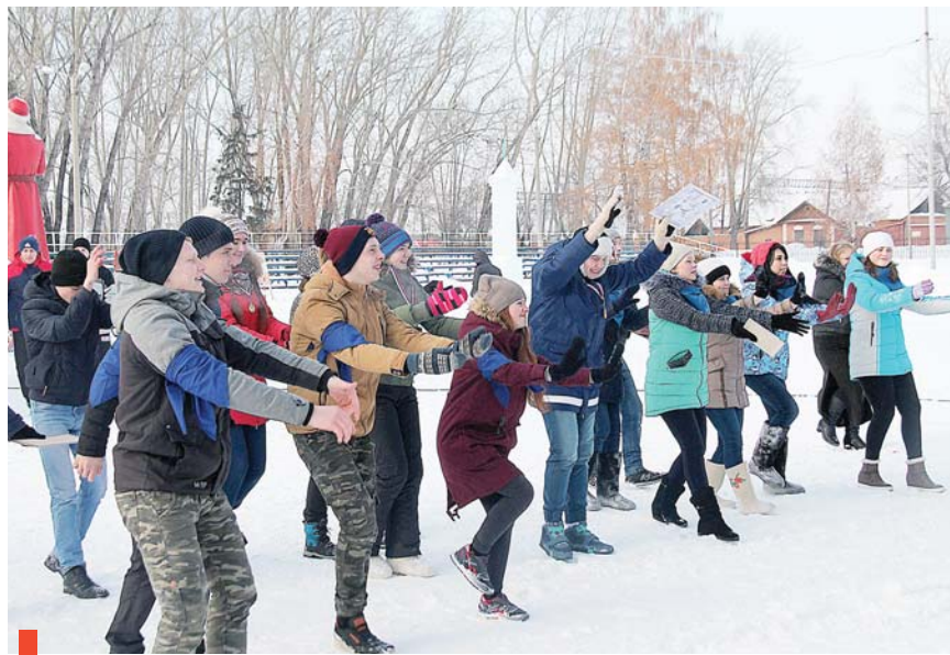
Заряд позитива перед стартом

Прожить студенческую жизнь – заветная мечта каждого старшеклассника, и она светит перед ним маяком. Студенческие годы ассоциируются с первой любовью, весельем и молодостью. Студенческая жизнь – это время открытых перспектив и возможностей, мечтаний о прекрасном будущем, веры в исполнение желаний.