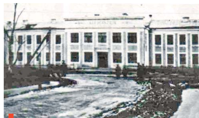
Школа № 7 в 1937 году и 2016-м (слева)

Для школы №7 наступивший 2017 год – особенный: ей исполняется 80 лет. Восемьдесят лет – это судьбы нескольких поколений, проживших вместе со страной невзгоды и радости. Для каждого поколения школа была своей, неповторимой, но всегда родной и любимой.