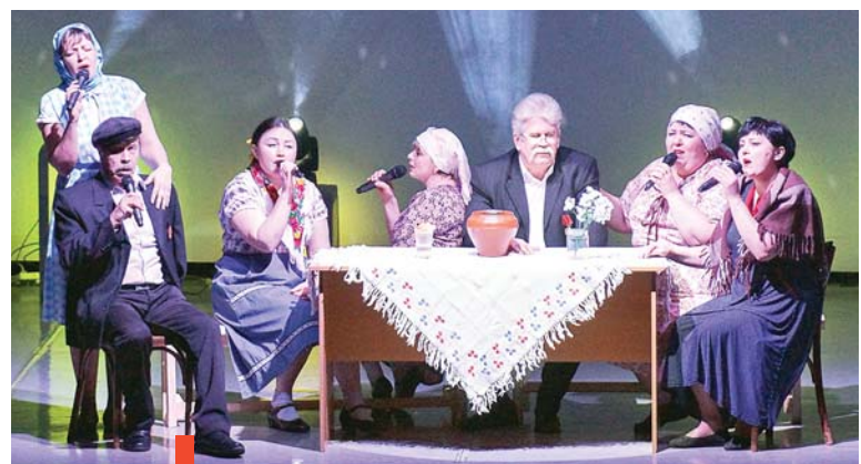
Выступление ансамбля «Любава»

поют, а инсценируют свои песни. Думаю, зрителям запомнилось выступление ансамбля «Любава» из Богдановича. Песню «То не веточка черешни...» из кинофильма «Вчера закончилась война» они превратили в настоящий мини-спектакль. Ансамбль девушек из Первоуральска своими образами перенес зрителей в суровые годы войны.