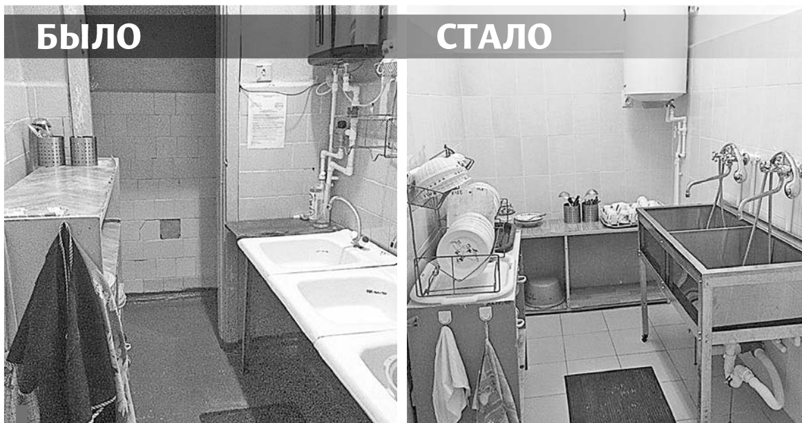
Ремонт буфетных в детском саду №36 (село Курьи)

В детских садах в рамках образовательной деятельности рабочие тетради не предусмотрены. Родители могут сами купить их и заниматься с ребенком дома.