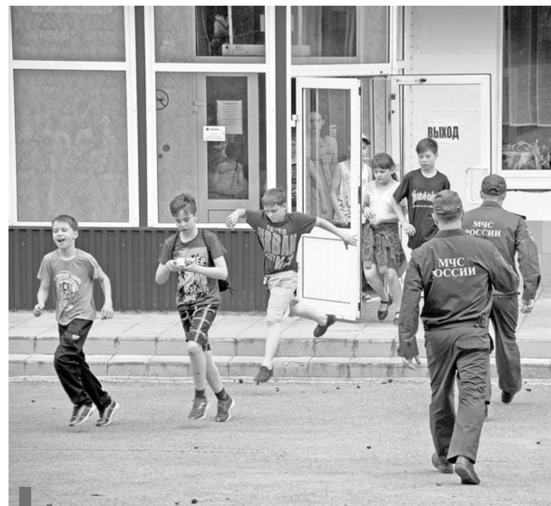
Идет эвакуация из корпуса

Если во внутренние лестничные пролеты проникает пламя, или они уже охвачены огнем, сильно задымлены, нужно спасать детей через окна и балконы с помощью стационарных и приставных лестниц. При этом следует плотно закрыть все не используемые для эвакуации балконные двери и окна, чтобы исключить