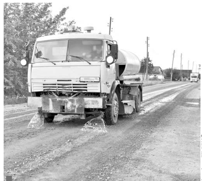
Поливка улицы Пионерской

Водители выбирают для движения в сторону СМЗ не установленный официально маршрут через улицу Дзержинского (возле городского кладбища), а более короткий – через частный сектор. При этом существенно увеличился транспортный поток по улицам Артиллеристов, Пионерская, Войкова, переулку Косогорский. Чтобы снизить пыление на грунтощебеночных дорогах в этом районе, было принято решение об их регулярном поливе, но эти меры недостаточны – улицы остаются опасными для пешеходов и мест-