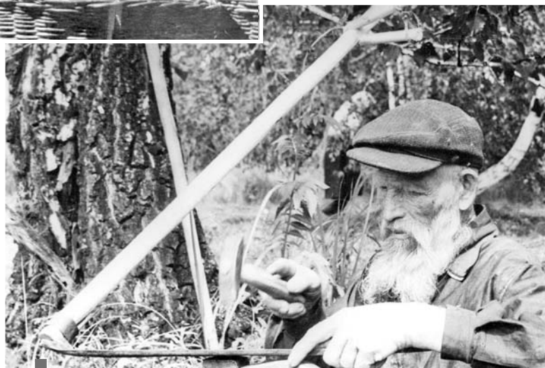
Трудовые будни колхозников. 1950-е.

Управляющий банком в кредит не отказал и вместе с инспектором посоветовал, как разумнее поступить с деньгами. Кроме того, все хозяйства внесли вступительные взносы. В кратчайшие сроки «Меж-