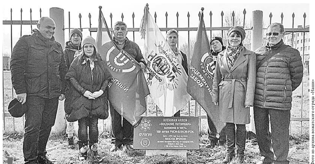
Участники акции «Послание потомкам»

На Юбилейной площади торжественно была открыта кленовая аллея, посаженная весной в честь 100-летия ВЛКСМ-РСМ, и заложена капсула времени. Представители детских и молодежных объединений, отряда «серебряных волонтеров» из клуба «Оптимист» написали письма и подготовили памятные предметы будущему поколению. Фотограф Валерий Малютин оставил для потомков фотографии городских пейзажей и кленовой аллеи. В 2043 году, когда Сухой Лог отпразднует 100-летие, капсула времени будет вскрыта.