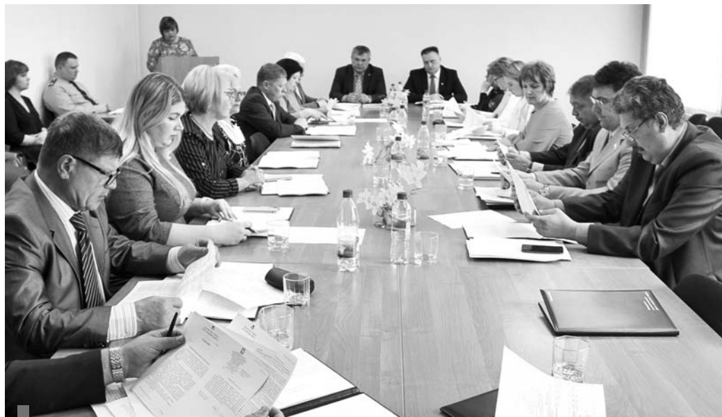
Заседание Думы городского округа, май 2018 г.

Фракция «ЕР» – сплоченная команда единомышленников, способная выполнять сложные задачи, с большим потенциалом на будущее.