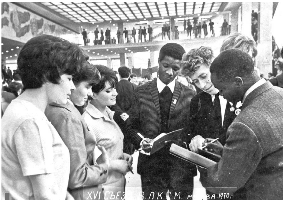
XVI съезд ВЛКСМ, г. Москва, 1970 г.

Произвело на меня впечатление и выступление молодой трактористки из Ростовской области. С трибуны съезда она обратилась к министерству легкой промышленности: «Свадебное платье достать нынче никакого труда не стоит, как говорится, был бы жених. А вот со спецодеждой будет потруднее. Ростовский дом моделей взялся было нам помочь. Сшили комбинезоны, учли даже, что мы женщины, и вручили нам этот подарок к 8 Марта. Но, товарищи, я не знаю, что творилось бы сейчас в зале, если на трибуну я вышла бы в своем комбинезоне. Ведь в него таких, как я, можно четверых поместить». Специально каждый день его стираю – только линяет».