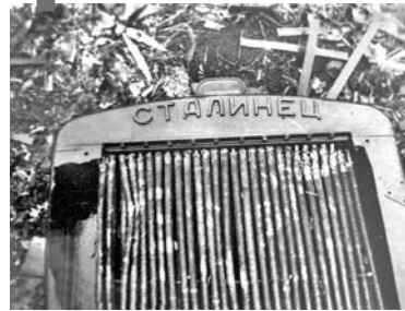
Передняя часть трактора-тягача образца 1950-х гг.

Я впервые ощутил, что такое история, я трогал ее руками! В то время о репрессиях и ГУЛАГе ничего не говорилось ни в СМИ, ни тем более в школе.