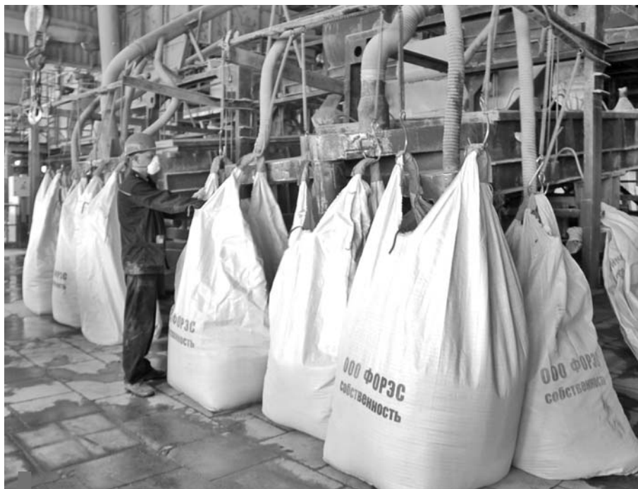
Основная профессия на «ФОРЭСе» – шихтовщик