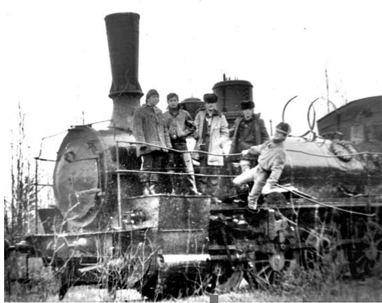
Паровоз «ОВ» весом около 50 тонн, так называемая «овечка»

Перед нами железная дорога и несколько паровозов с ва-