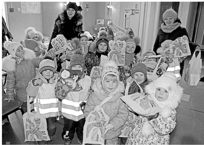
Воспитанники детсада №29 с подарками для животных

Спешите: акция продлится до конца ноября. Напоминаем, что «Зеленая подписка» распространяется на все виды доставки, на полугодие или на год. Макулатура принимается по 5 рублей за килограмм.