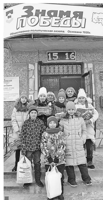
Ученики 4А класса школы №7 – участники акции «Зеленая подписка»

В случае победы международная выставка будет проходить в Екатеринбурге со 2 мая по 2 ноября 2025 года. За эти полгода город посетят около 14 миллионов гостей из ближнего и дальнего зарубежья. И, как заверяют власти Екатеринбурга, уральскую столицу ждут глобальные перемены, в частности, строительство второй ветки метро.