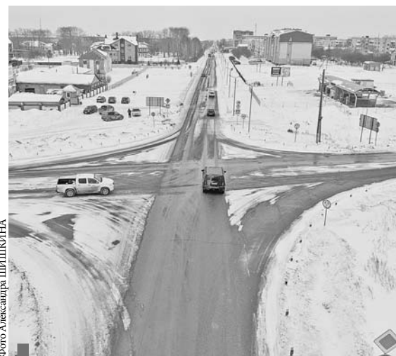
На Шатском перекрестке

Все заявители получают ответы в письменном виде.