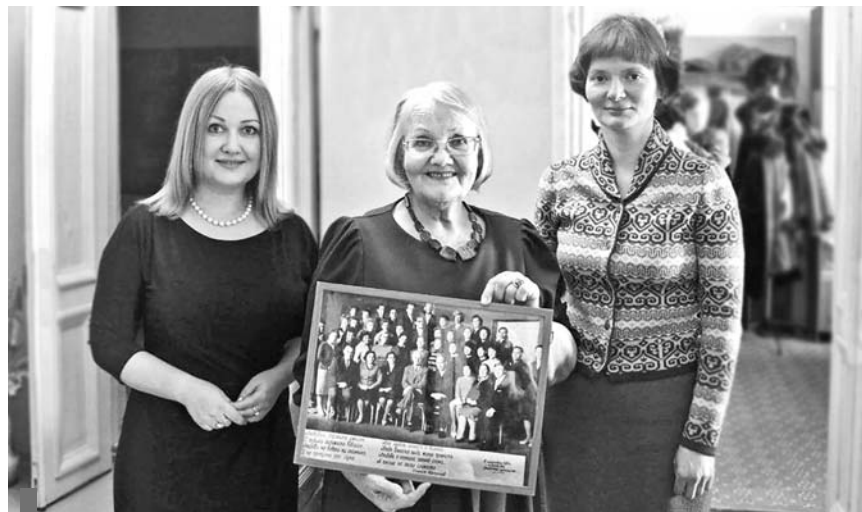
В дар музею – раритетное фото от сухоложцев

Степан Щипачёв вошел в антологию 100-томной серии «Великие поэты», выпущенной в 2011-2013 годах издательством «НексМедиа», наряду с Блоком, Буниным, Хайямом и Шекспиром.