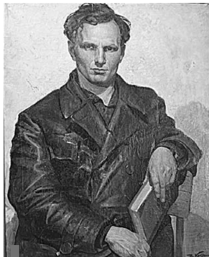
Первый портрет поэта, 1933 г.

Такое решение приняли руководители Богдановича, объявив 2019-й Годом поэта Степана Щипачёва в городском округе.