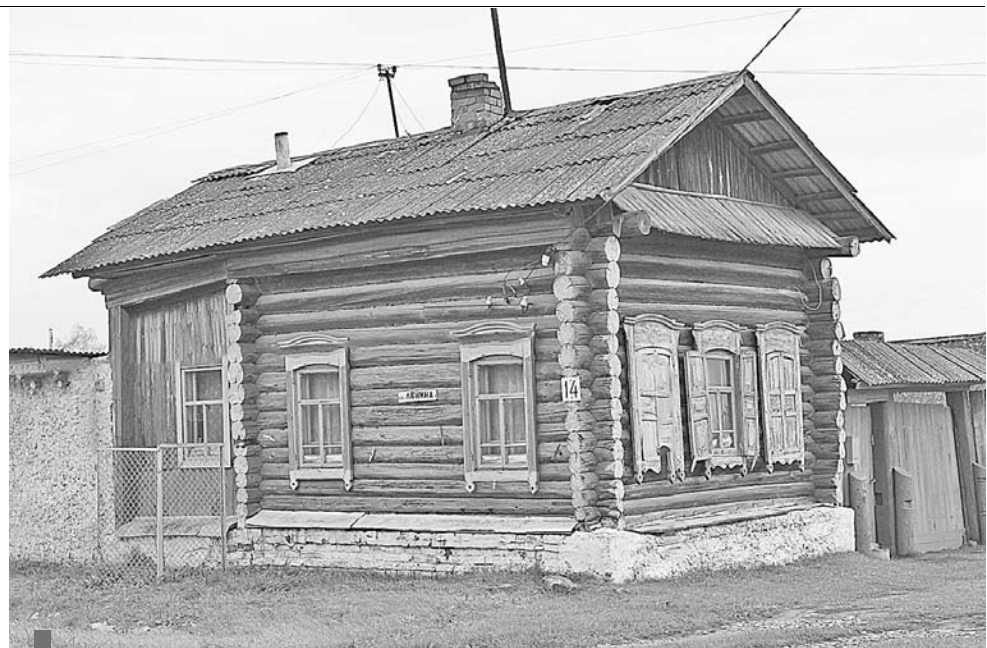
Дом в селе Филатовском, где жил Степан Щипачев, 2018 г.

Перед вами – глава из повести о поездке в Филатовское на заработки. Приводим ее в сокращении.