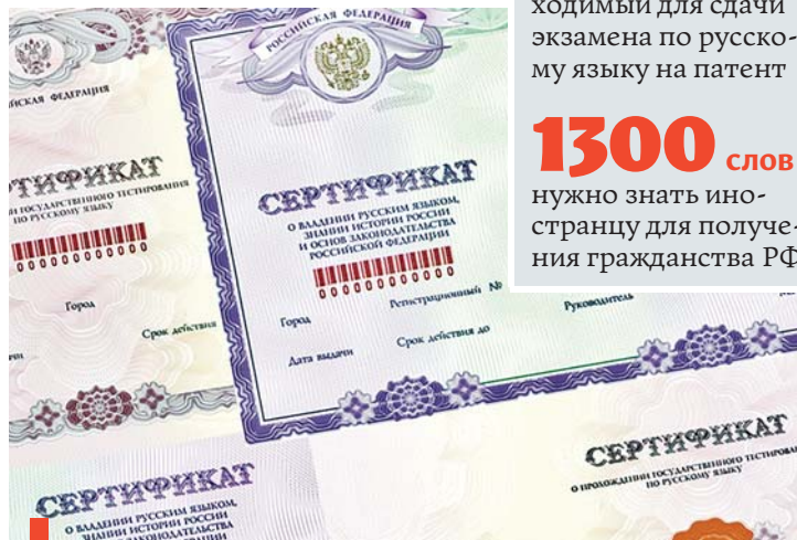
Документ, который вручают иностранцам, сдавшим экзамен

Чисто технически процедура экзамена такая: распечатываем весь пакет документов для экзаменуемого, заполняем бланки и переходим непосредственно к тестированию. Процесс сдачи экзамена записываем на видеокамеру. В ее объектив должны попасть экзаменатор и экзаменуемый. По окончании экзамена все проверенные нами бланки и листы с ответами сканируются и вместе с видео отправляются в Москву. Там документы, включая ответы на тестовые задания, еще раз проверяют и, если всё в