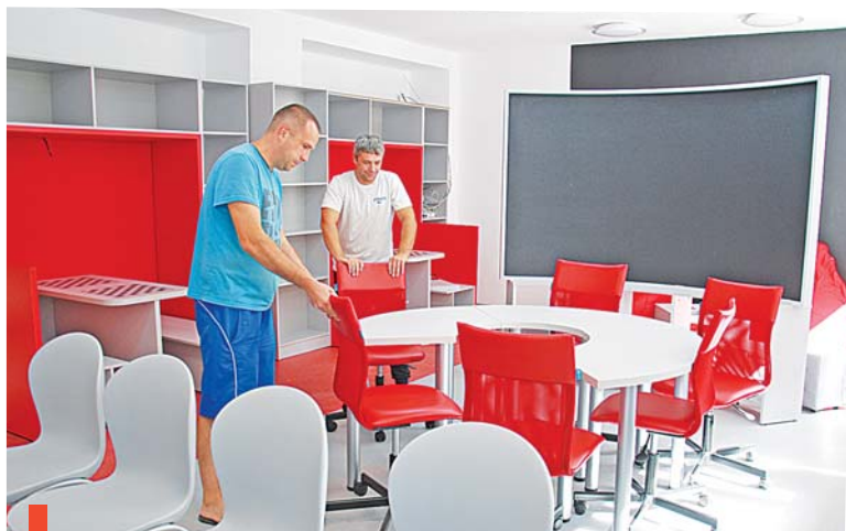
...и школе села Новопышминского

роста» на базе школы №17. 20 сентября в Свердловской области – единый день открытия центров. В школу села Новопышминского приедут представители Правительства Свердловской области.