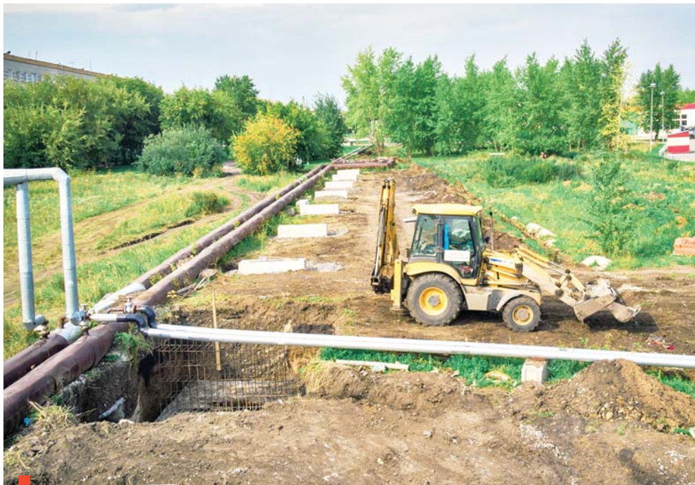
Ремонт на теплотрассе