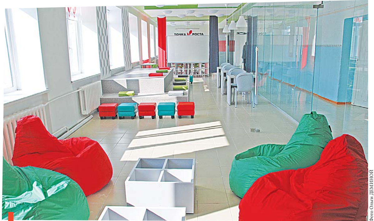
Зона коворкинга в школе села Знаменского...

Приобретены современные компьютеры, интерактивные панели, квадрокоптер, принтер, копировальная техника, сканер, шлем виртуальной реальности, фотоаппарат, 3D-принтер и много другой современной техники. До 2024 года в центры будет поступать дополнительное оборудование. На следующий год планируется открыть «Точку