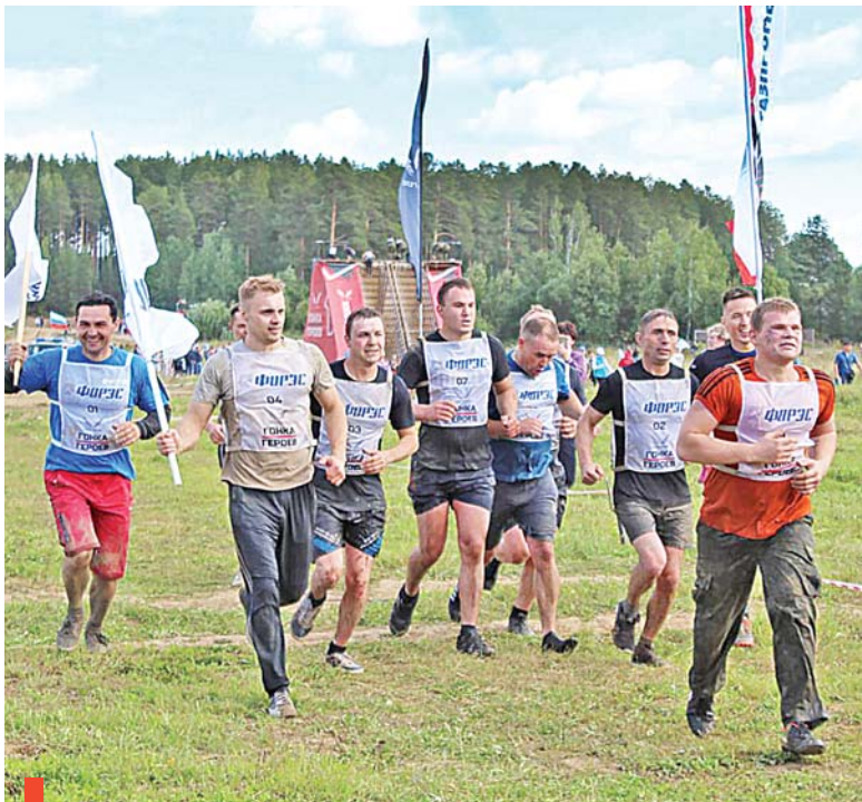
Финиширует команда Курьинского подразделения

В следующем сезоне работники вновь готовы испытать силы в «Гонке героев».