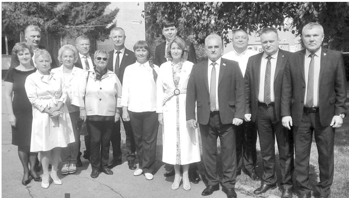
Суходожская Дума с депутатами Законодательного собрания

– В состав объединения вошли практически все суходожские депутаты, – поясняет председатель Думы