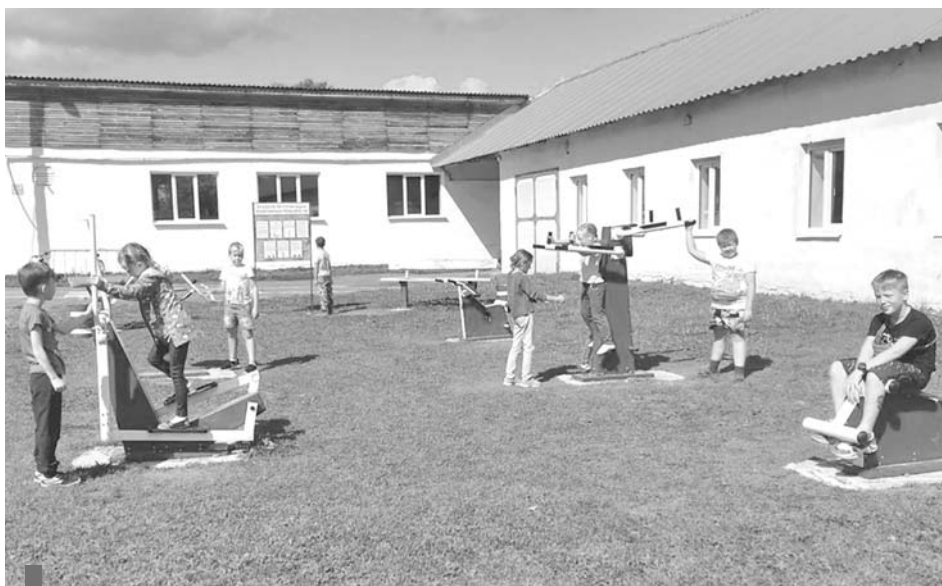
На тренажерах в школьном дворе занимаются юные новопышминцы