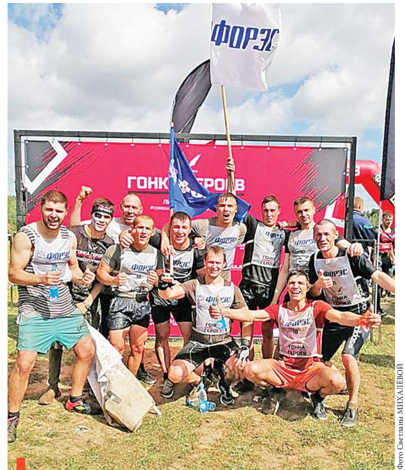
Победу празднует команда Сухоложского подразделения

Пока команды напрягались на трассе, болельщики проводили время на природе в комфортной фан-зоне с развлечениями и шоу-программой. На