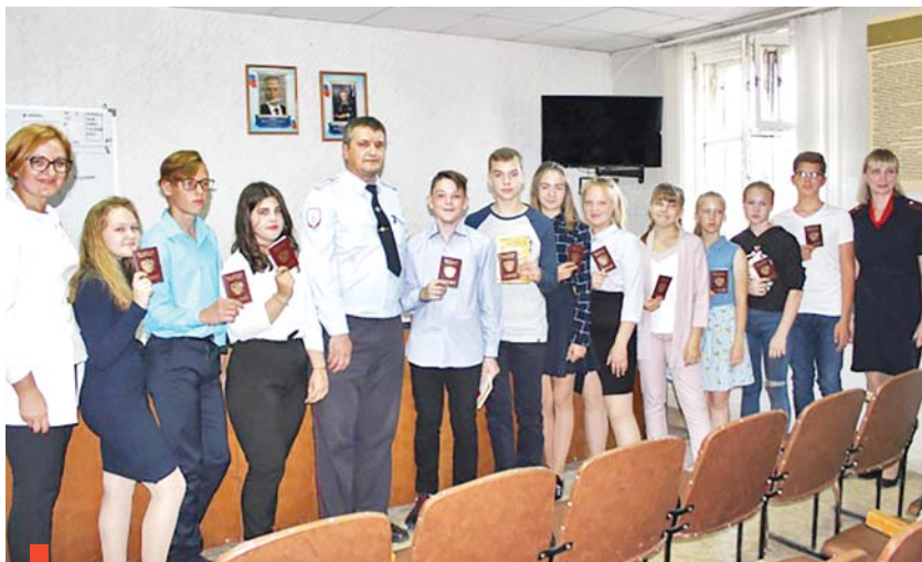
Новые граждане страны