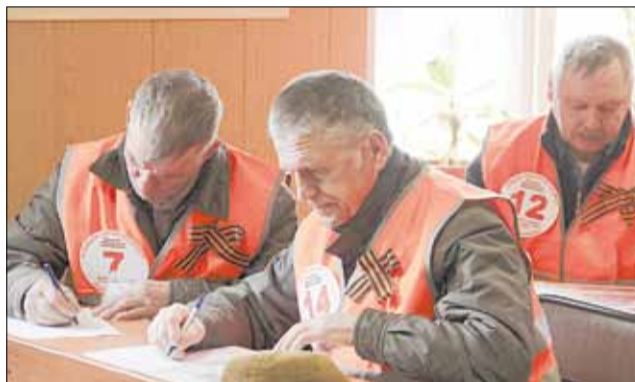
Автолюбители-стажисты решают задачи теоретического экзамена.