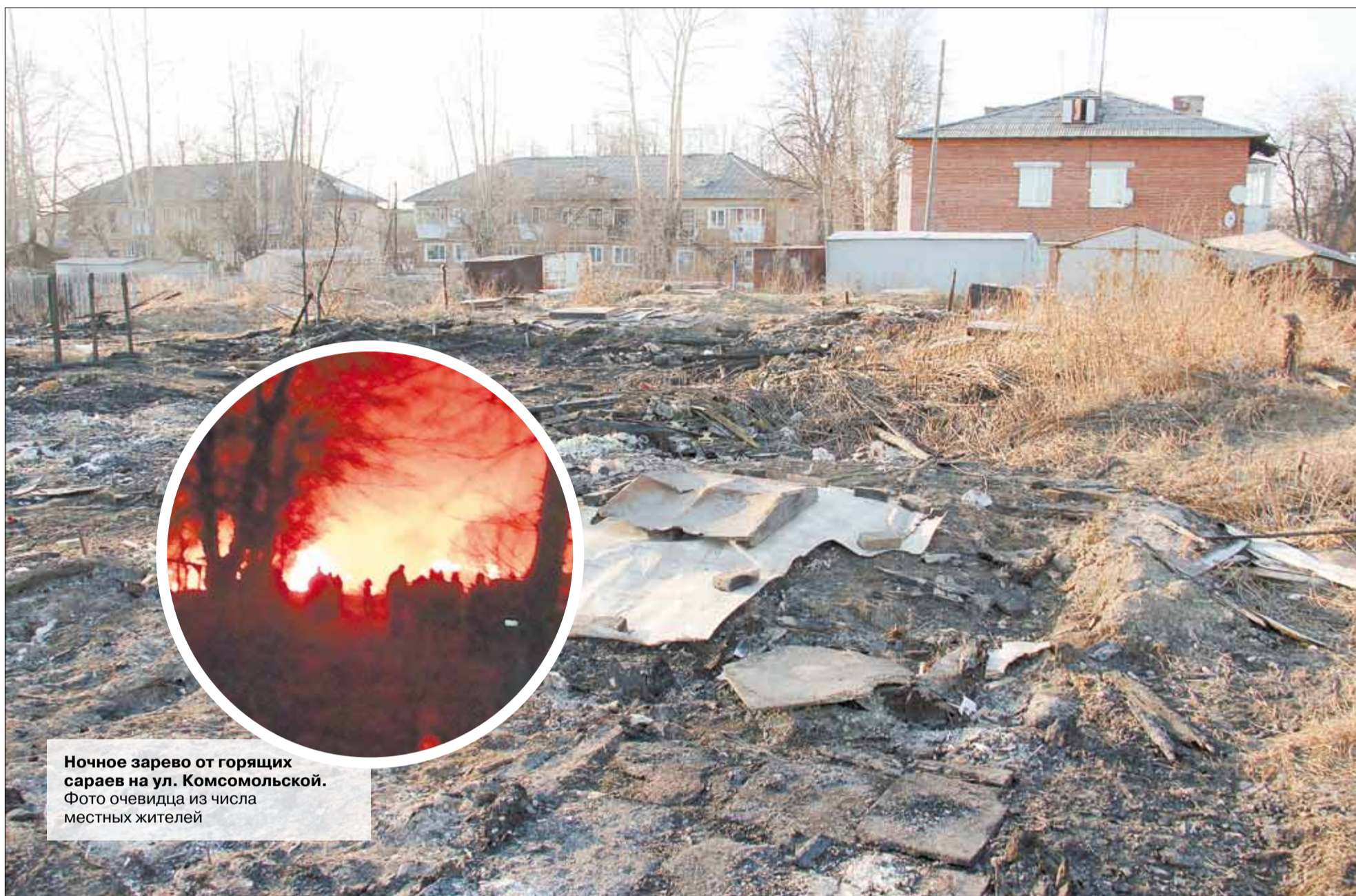
Ночное зарево от горящих сараев на ул. Комсомольской.

На том месте, где раньше были построены сараи, выкопаны ямы для овощей и одним из местных жителей возводился жилой сруб, теперь лишь выжженное пепелище. Когда сараи закончились, пироман решил взяться за жилые дома