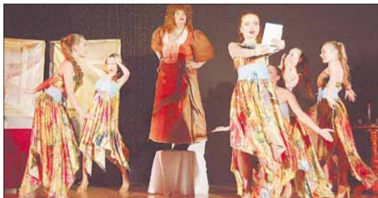
Артисты оригинального мюзикла «Ах, водевиль...» доставили яркие впечатления всем участникам торжественного собрания.