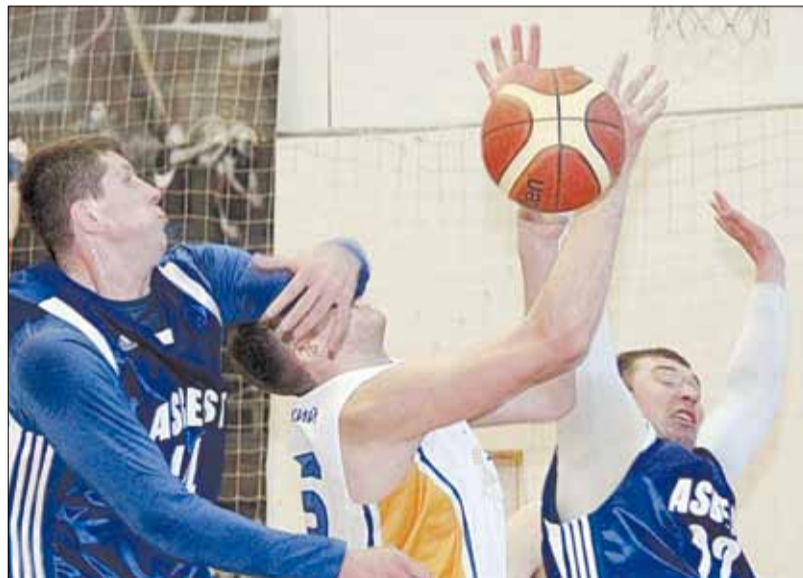
Борьба на подборе.