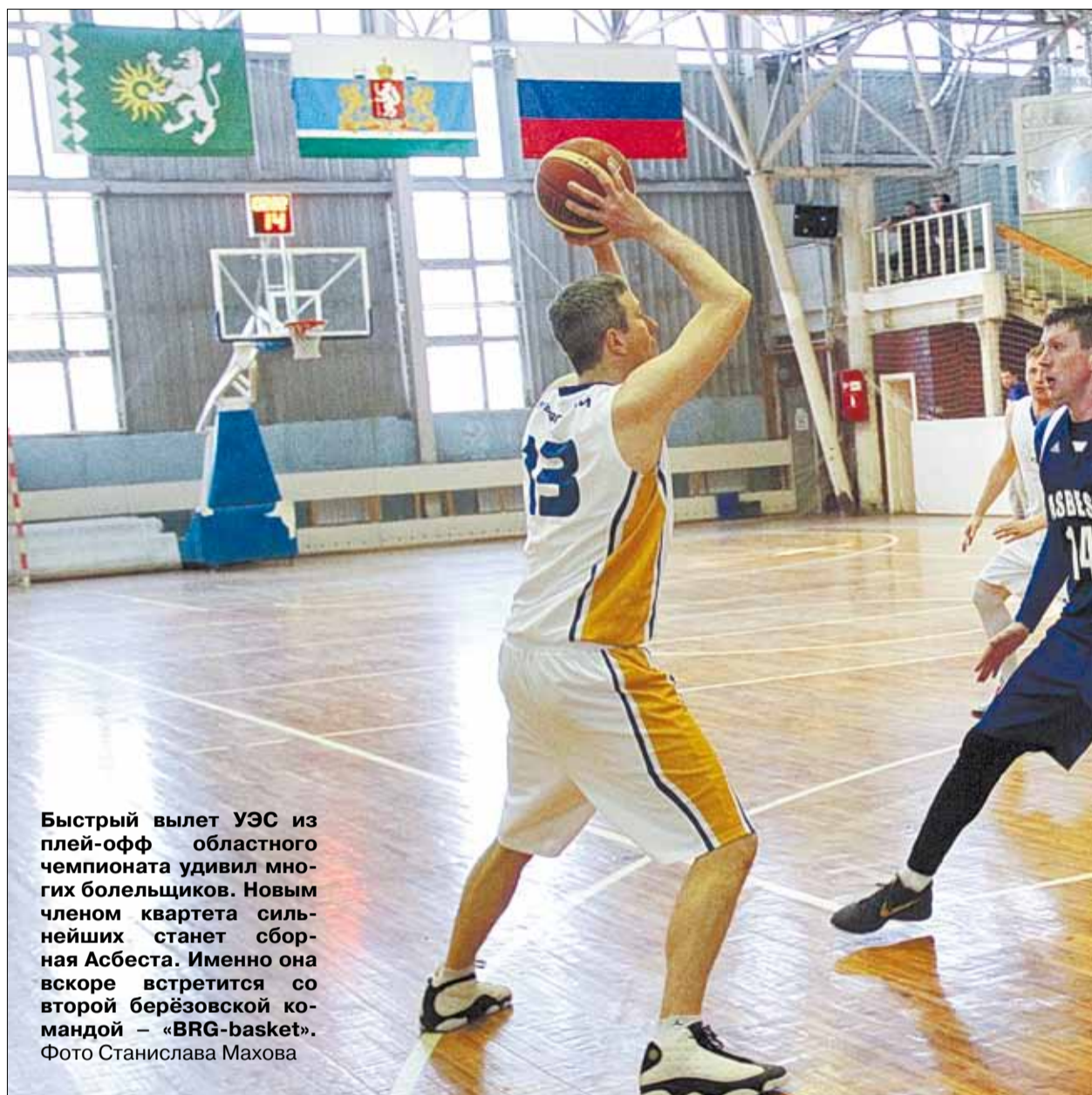
Быстрый вылет УЭС из плей-офф областного чемпионата удивил многих болельщиков. Новым членом квартета сильнейших станет сборная Асбеста. Именно она вскоре встретится со второй берёзовской командой — «BRG-basket».