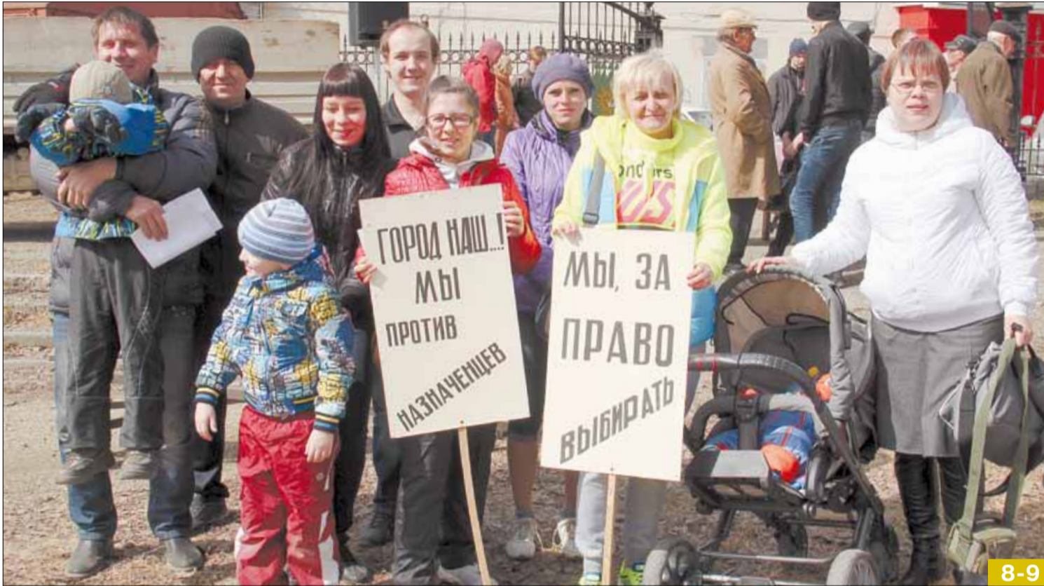
Транспарантов с лозунгами на митинге было всего два. Пришедшие на акцию березовчане посчитали почетным делом сфотографироваться на их фоне.