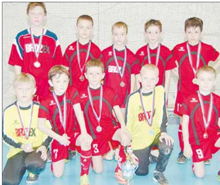
Серебро областного первенства для футболистов «Арсенала» стало четвёртой наградой в нынешнем сезоне.

Тел. журналистов: (34369) 4-53-95, 8-904-982-33-11