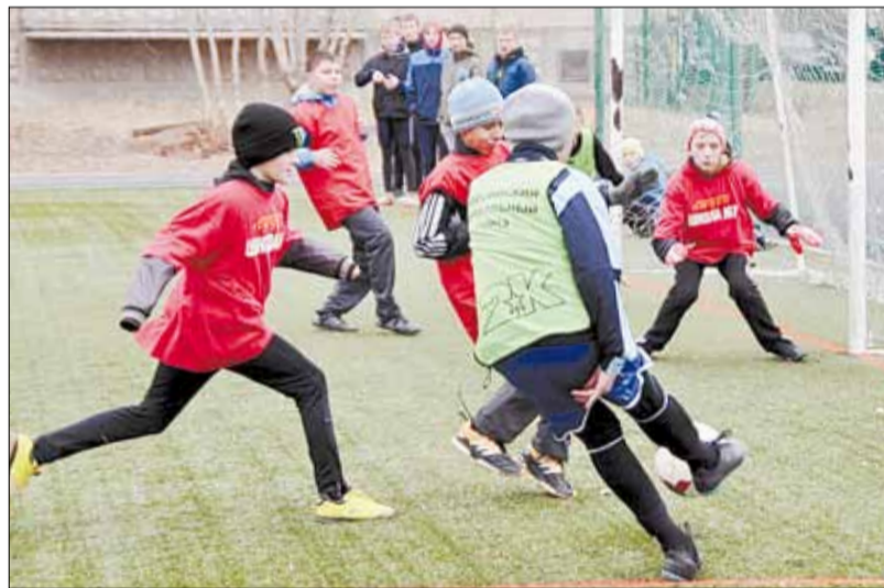
Играют сборные гимназии № 5 и лицея № 7. Гимназисты забили в ворота соперника пять безответных мячей.