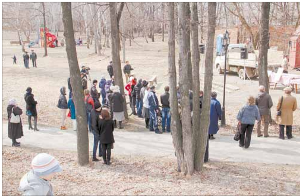
Митингующие расположились в Историческом сквере неподалеку от автобусной остановки «Урал».