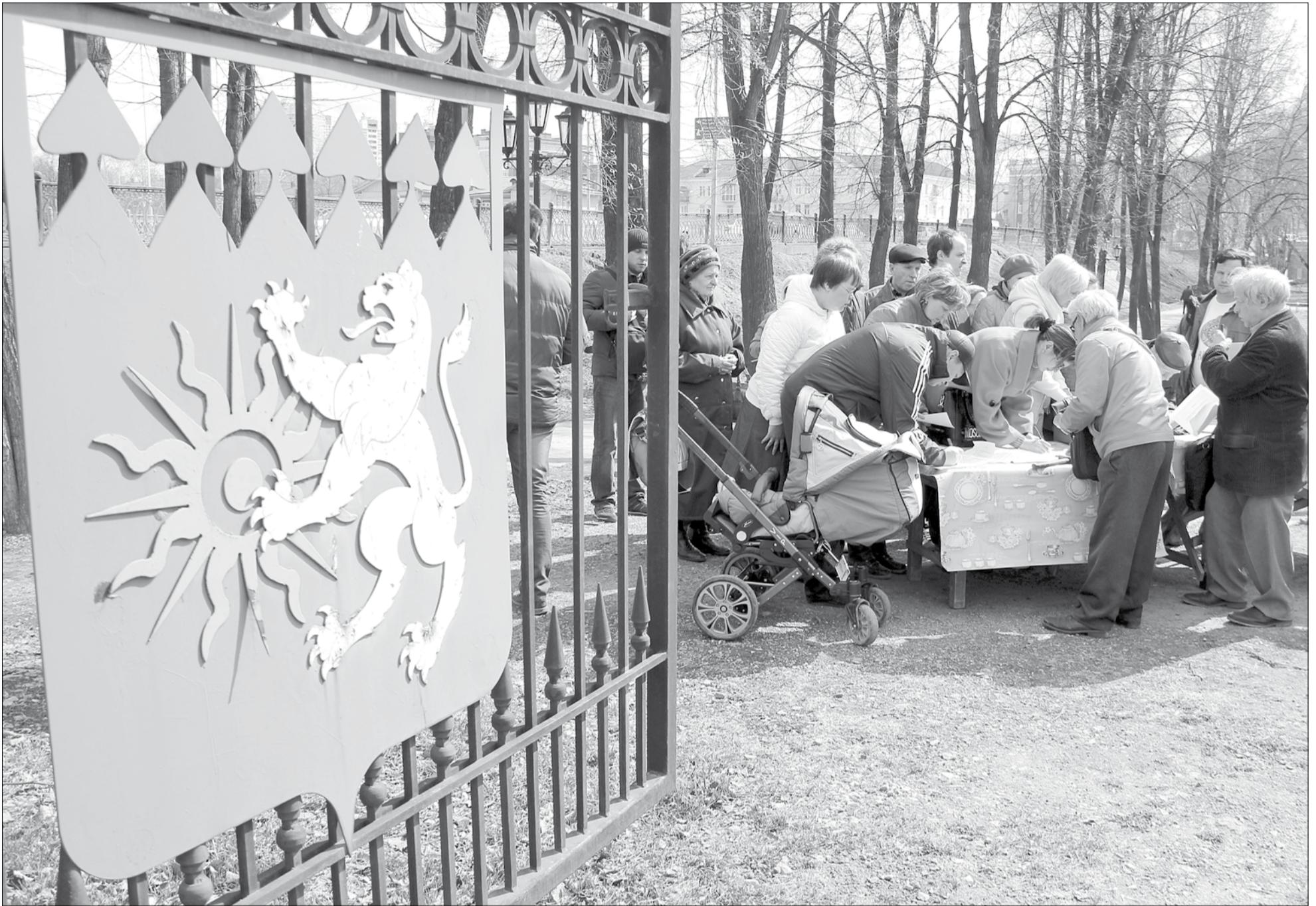
Участники протестной акции ставят подписи под резолюцией против «Большого Екатеринбурга».