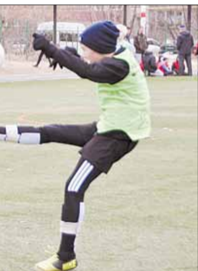
Юношескими второй и девятой школ. «Двойка» уступила со счётом 2:0.