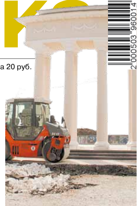
Дорожники ведут замену асфальта в парке Победы.

Защищать от «Большого Екатеринбурга» родной город нашлось немного желающих