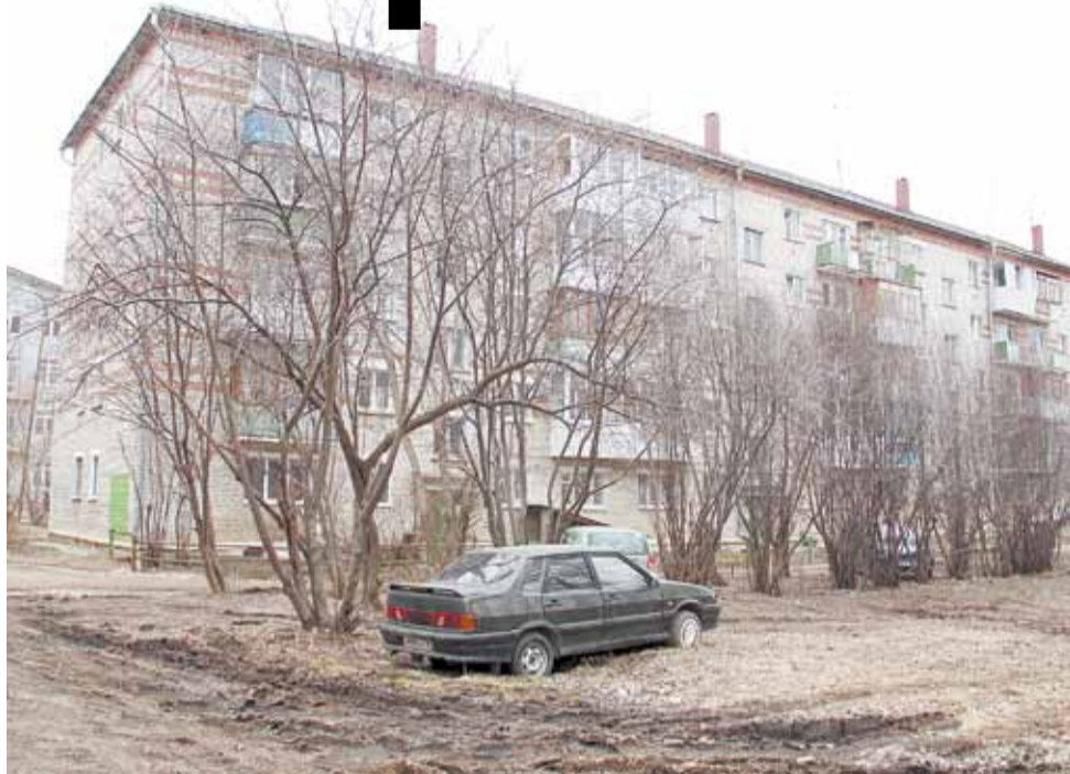
Изъезженный автомобилями двор на ул. Шиловская, 14