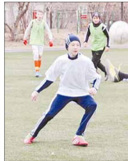
Матч между сборными гимназии № 3 и лицея № 3 «Альянс». Фото Станислава Махова