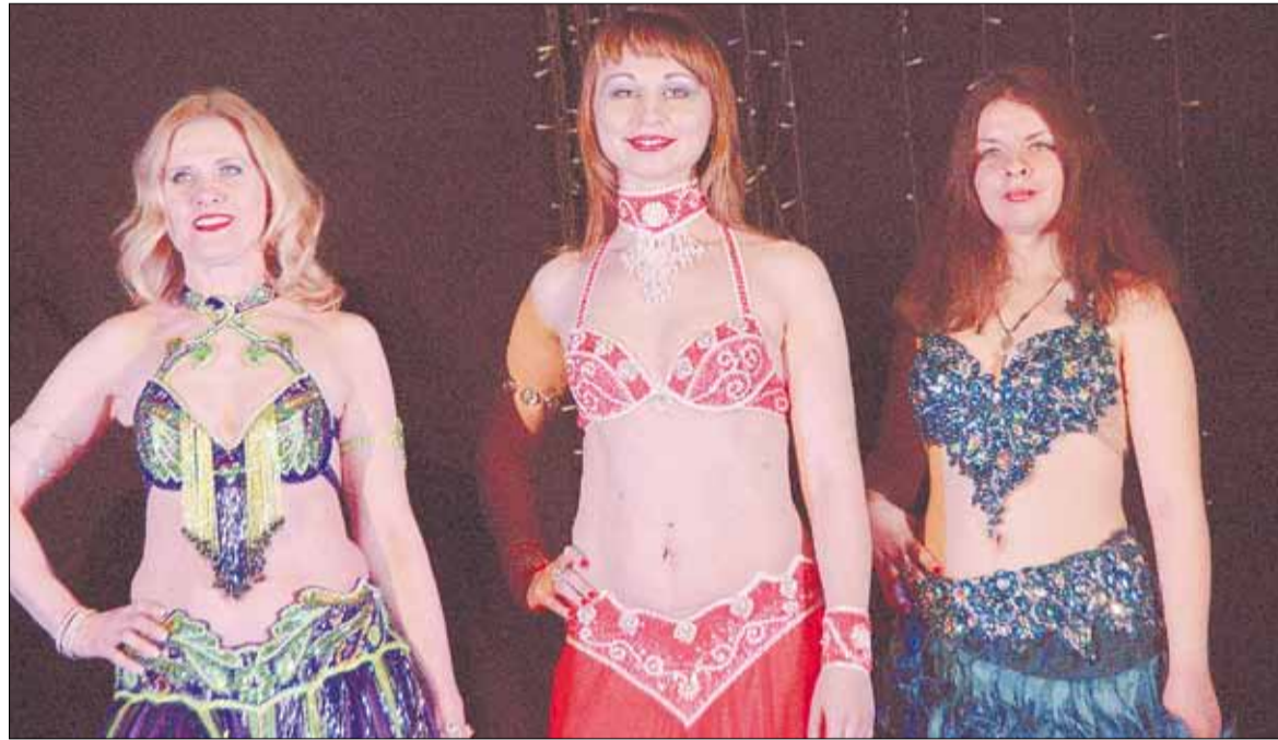
Изюминкой фестиваля стало дефиле – танцовщицы из берёзовской «Амриты» с особой грациозностью продемонстрировали восточные костюмы.