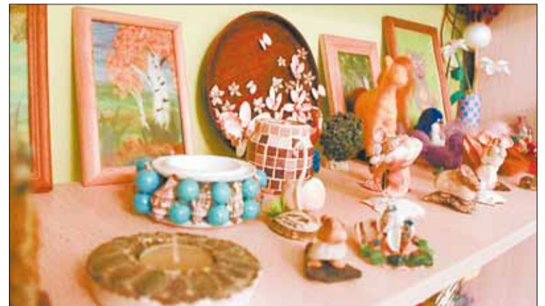
Выставка работ, сделанных детскими руками, в кабинете прикладного творчества.