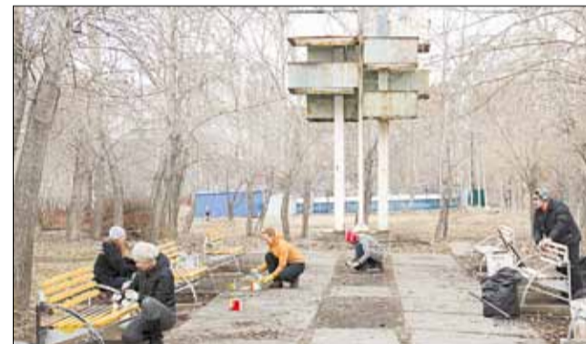
Первоначально на субботнике планировали высадку цветов, но из-за погоды эти планы перенесли на май. Общественники собрали в сквере около десяти мешков мусора и починили места для отдыха