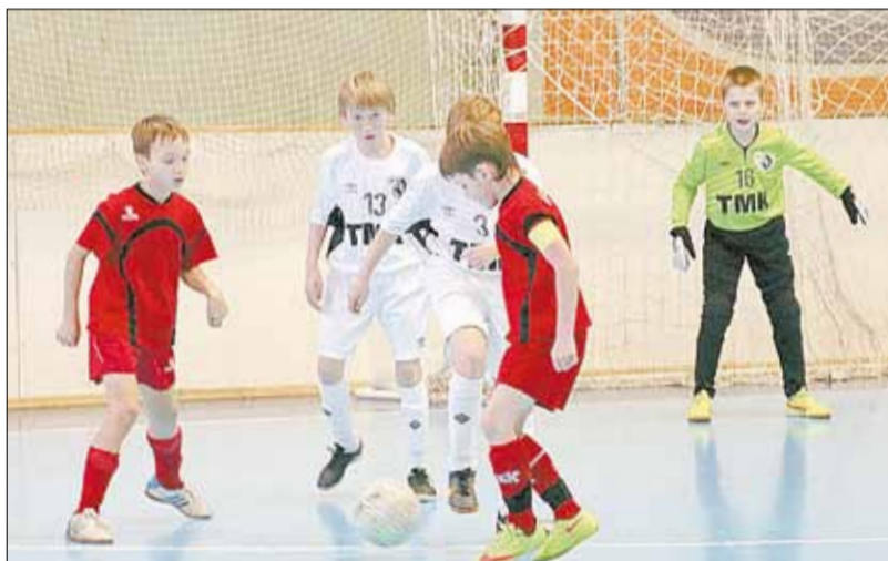
Матч «Арсенал» — ВИЗ-2004. Вплоть до середины второго тайма березовчане держали екатеринбуржцев в напряжении.