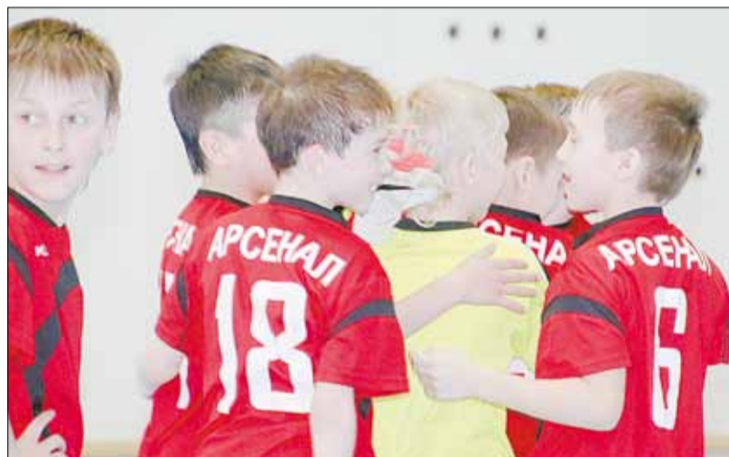
Берёзовские футболисты поздравляют друг друга с победой после матча со сборной Каменска-Уральского.