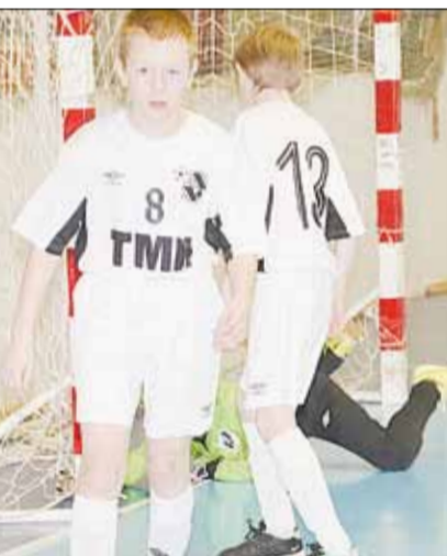
...только забил гол в ворота ...иста уже заметили два ...авитися на просмотр в столицу