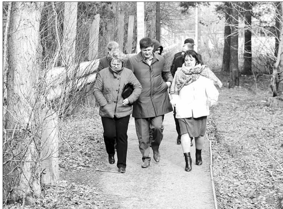
Делегация во главе с мэром шагает по дорожке, которая ведёт от поселка БЗСК в Новоберёзовский микрорайон мимо стадиона «Энергетик»