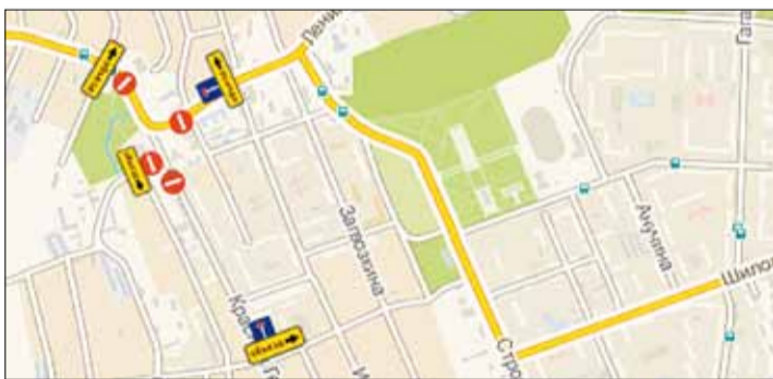
Схема организации дорожного движения в городе Берёзовском на период проведения Дня весны и труда