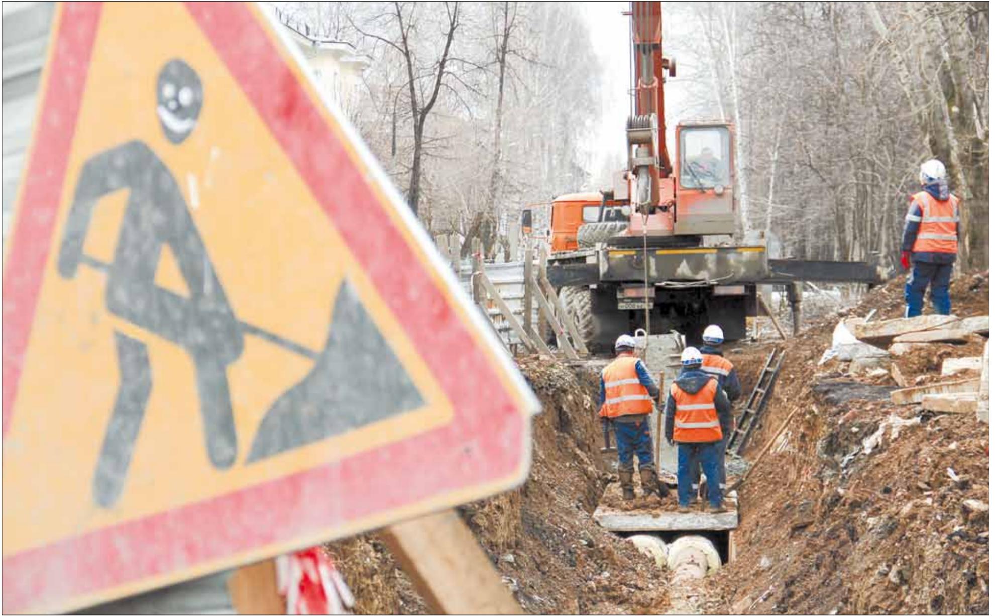
Рабочие СТК завершают ремонтные работы возле дома № 12 по ул. Шиловской. Многократные продолжительные раскопки в этом квартале давно вызывают раздражение у местных жителей.

Коммунальных аварий в холода стало в пять раз меньше