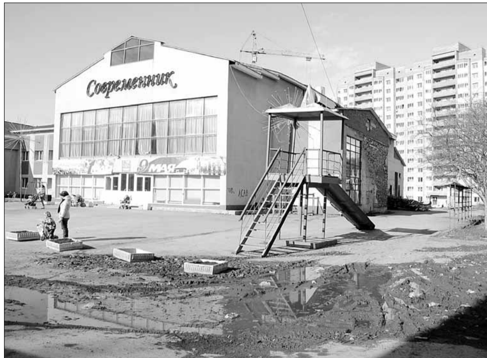
Дорога рядом с дворцом культуры «Современник» превратилась в грязевое месиво, по которому не решаются проехать даже автомобили