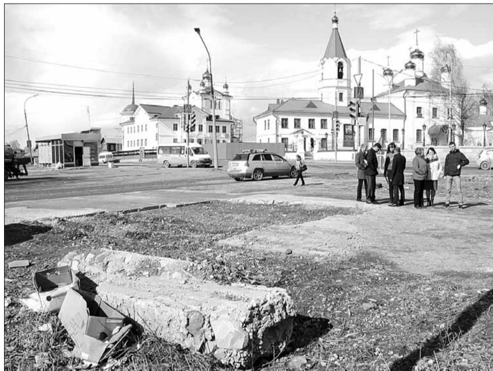
Пустырь напротив Успенского храма до праздничных мероприятий обещала прибрать строительная компания, возводящая высотные дома по ул. Восточной