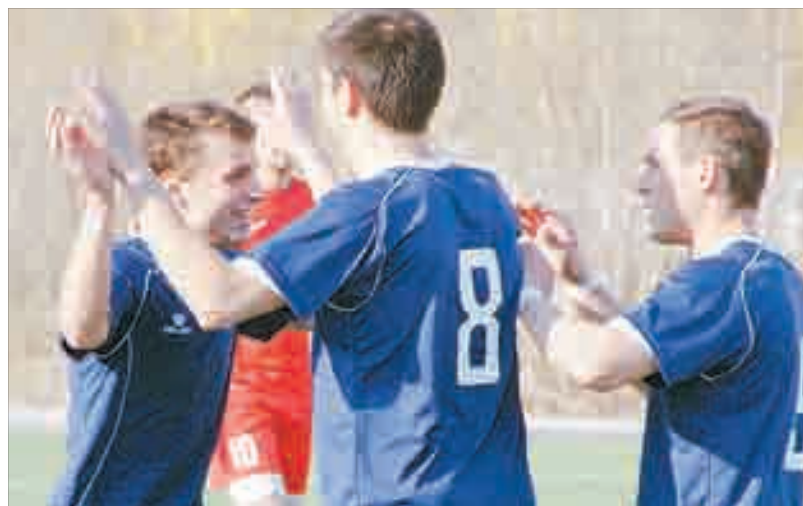
Ликование берёзовских футболистов после очередного забитого гола