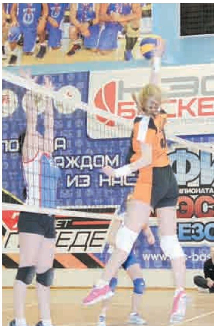
В последний раз турнир по волейболу среди девушек проводился в Берёзовском 9 марта.

Тел. журналистов: (34369) 4-53-95, 8-904-982-33-11