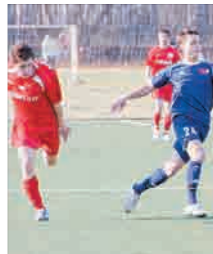
В штрафной зоне ирбитчан.