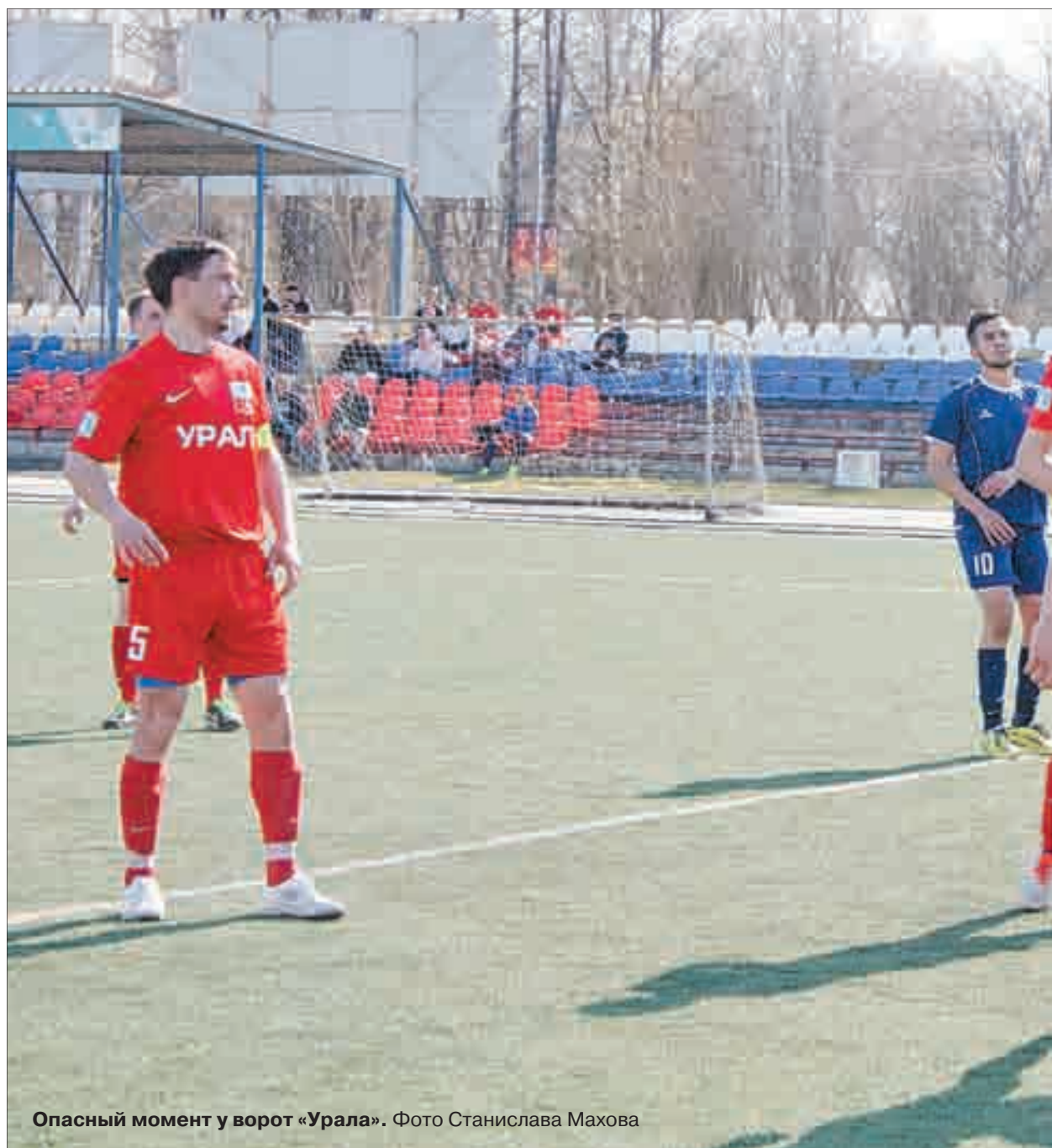
Опасный момент у ворот «Урала».

Соревнования проходят по взрослому — в каждой игре предусмотрено три периода по 20 минут. Выступают березовчане под руководством опытного тренера Заура Везиева. В составе команды играют как опытные хоккеисты, успевшие поучаствовать уже в престижных турнирах, так и новички.