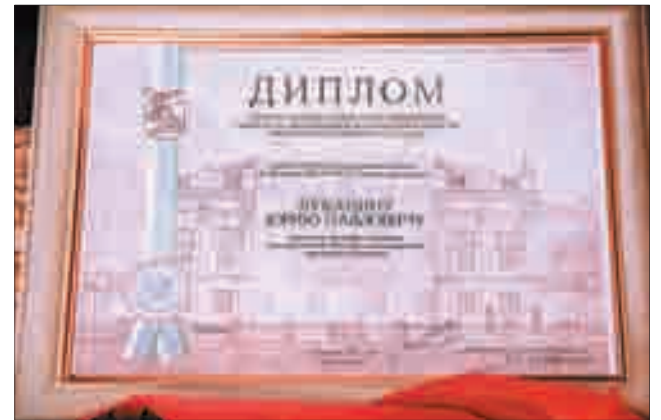
Участники берёзовского ансамбля народных инструментов удостоились награды за концертную программу «Родники»