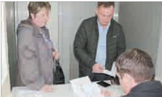
Одни из первых клиентов, пришедшие поменять водительские права