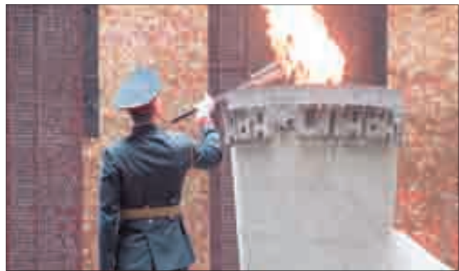
Солдат почётного караула зажигает факел, чтобы передать частичку Вечного огня берёзовчанам