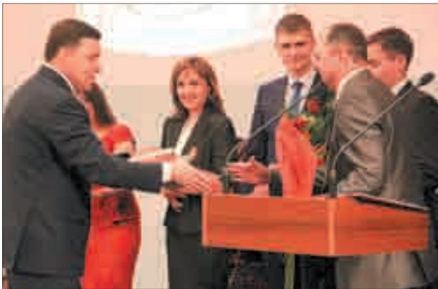
Глава региона вручает березовчанам дипломы лауреатов губернаторской премии.