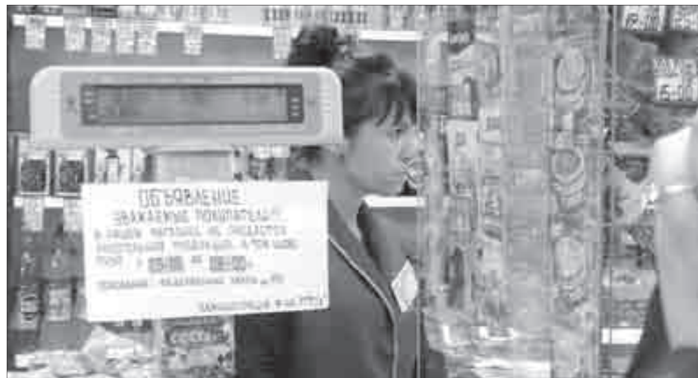
Провинившийся продавец магазина «777/2» на ул. Бруницына.

Спасатели напоминают, что под запретом находится разжигание костров и пал сухой травы, а также проведение пожароопасных работ в населённых пунктах, на торфяниках и в лесных массивах. Кроме того, чтобы не допустить огнетушителем и канистры городского округа повторения трагедии, случившейся в республике Хакасия, жителям частных домов рекомендуется обзавестись огнетушителем и канистрой с водой, а также избавиться от прилегающей к участку сухой растительности. Также руководитель городского надзорного органа отмечает, что захламление помещений, пожарных выходов и придомовых территорий может заметно затруднить спасателям тушение пожара.