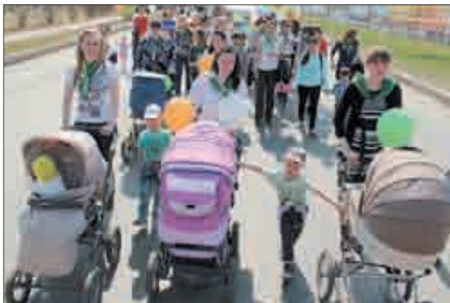
Молодые мамы в колонне берёзовского отделения «Сбербанка России»