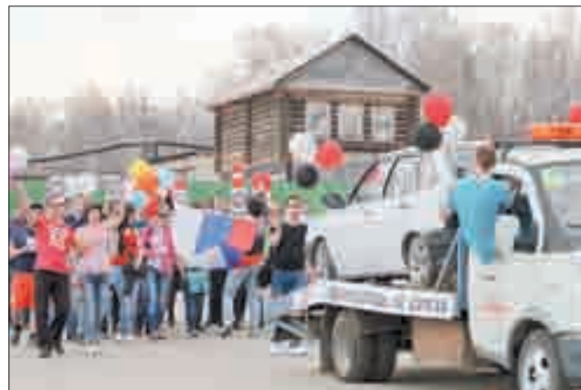
Сообщество автолюбителей «Взаимопомощь на дорогах» подходит к праздничной трибуне.