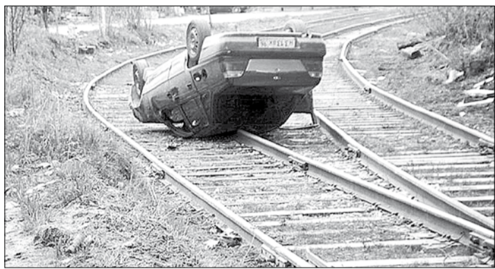
Пилоту «Дэу Нексия» повезло, что в момент аварии по путям не передвигался поезд.

Тел. журналистов: (34369) 4-53-95, 8-904-982-33-11