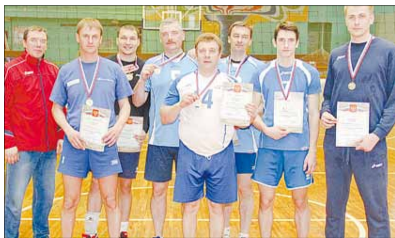
Команда «Наши Окна» – чемпион Берёзовского по волейболу.