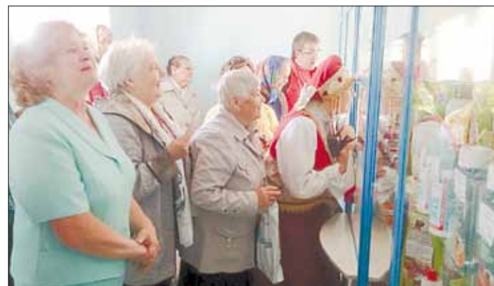
Жители поселка Старопышминска на открытии новой аптеки, разместившейся на арендованных площадях рядом с продуктовым магазином по ул. Ленина, 36

Пишите: gorka-info@rambler.ru Звоните по тел. (34369) 4-53-95, сот. 8-904-982-33-11 Наш сайт: zg66.ru