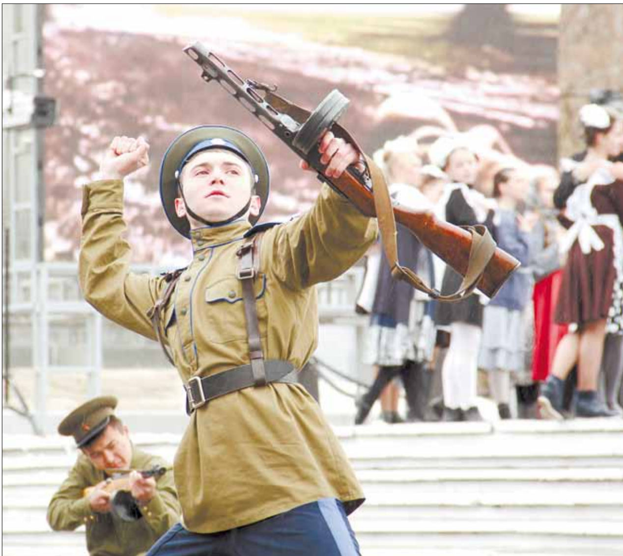
Театрализованное представление на Мемориале боевой доблести и трудовой славы березовчан в день празднования 70-летия Победы произвело сильное эмоциональное впечатление на зрителей.