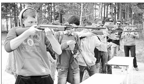
Старшеклассники городских школ пробуют свои навыки в стрельбе из пневматической винтовки.

Военнослужащие-контрактники и офицеры российской армии рассказали юношам и девушкам о том, что представля-