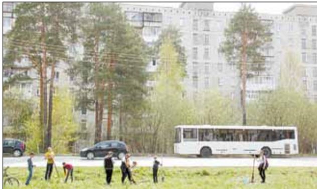
Деревца, посаженные шестиклассниками, заняли участок ул. Спортивной от детской площадки до пер. Пышминского – рядом с могучими соснами