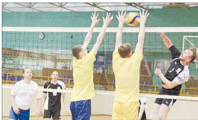
Матч за третье место между БЗСК и «Группой здоровья № 2». Победу со счётом 3:1 одержали «заводчане»