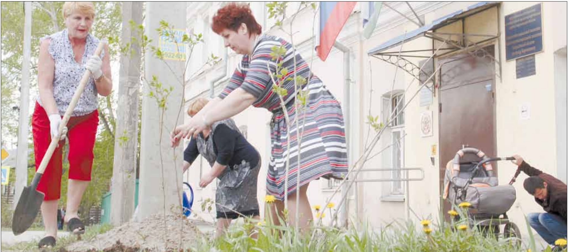
Узкий участок земли у здания управления социальной политики в будущем станет сиреновой аллеей. Социальные работники и сотрудники архивного отдела продолжают начатое здесь год назад озеленение.