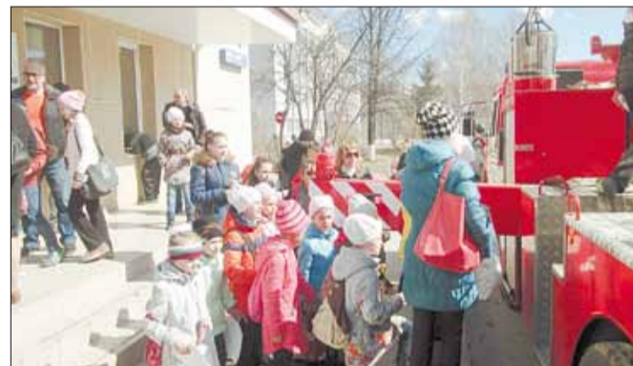
Дети окружили автолестницу и наблюдают, как спасатели приводят ее в боевую готовность.