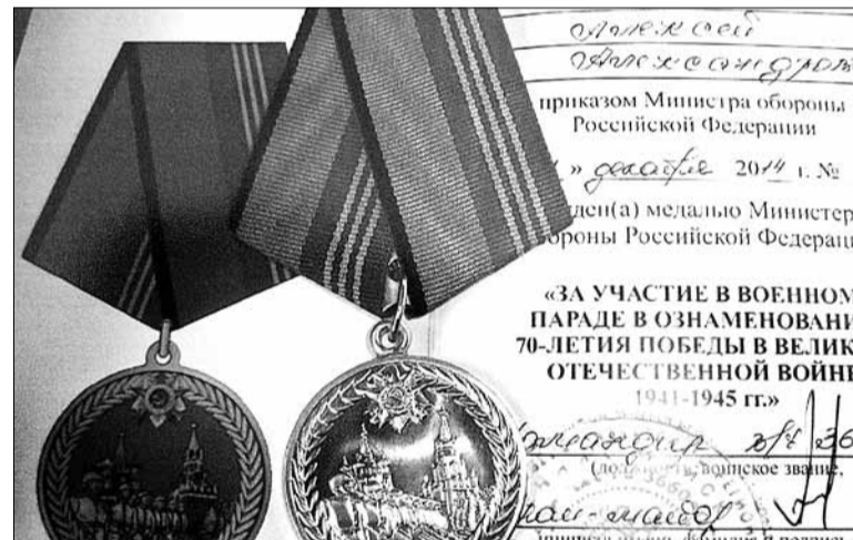
Медаль и наградное удостоверение участника юбилейного парада Победы

жет. Маму он успокаивал словами, что «всё будет хорошо».