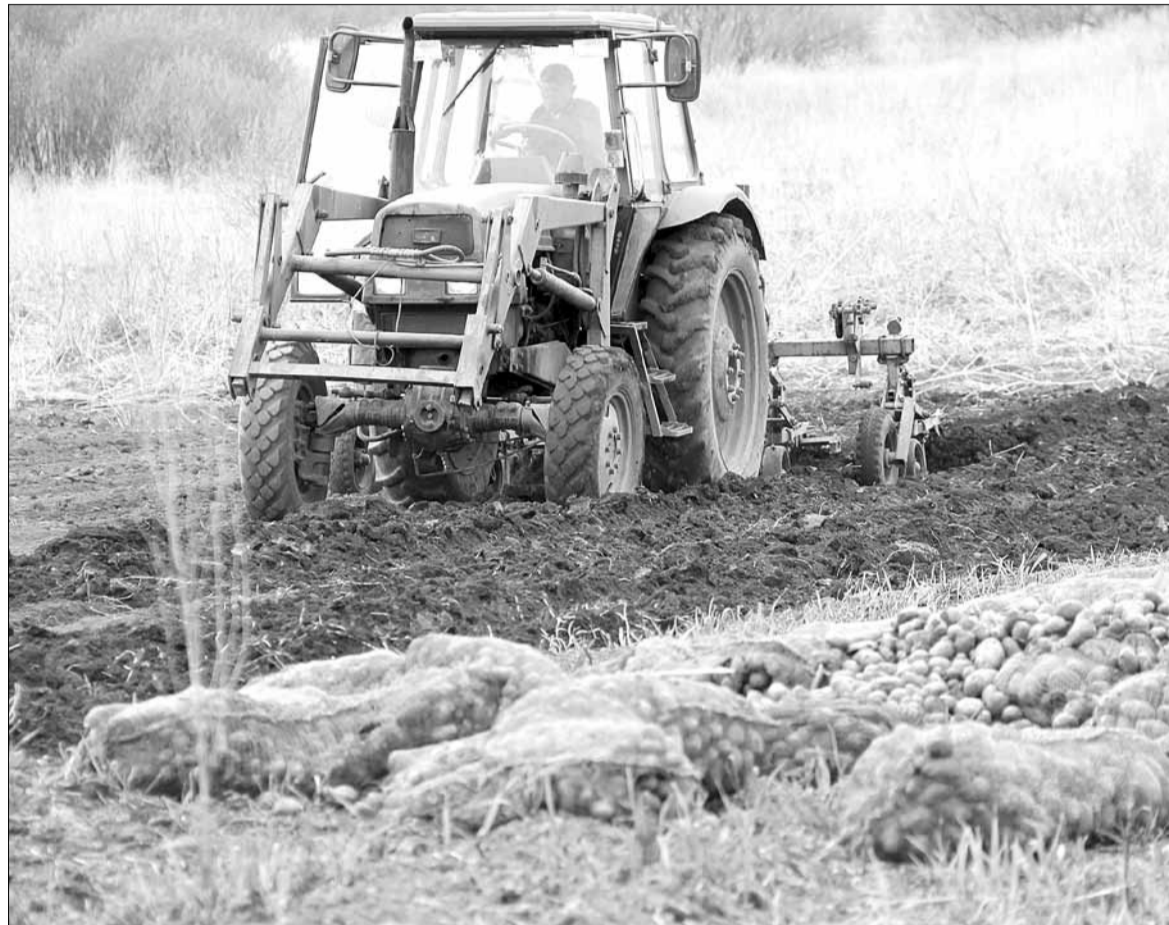
Тракторист фермерского хозяйства «Надежда» формирует гребни на вспаханном шиловском поле. Каждому из подавших заявление березовчан будет выделено для посадки картофеля по три гребня протяженностью по 100 метров.

В противовес кризису березовчане засадят картофелем землю мэрии