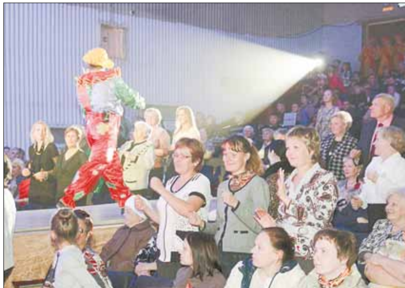
Аншлаг в зале 27 сентября 2014 года — во время театрализованного вечера, посвященного 50-летию ДК «Современник»