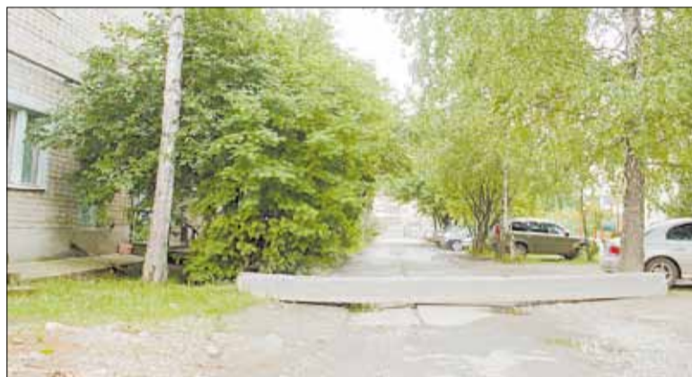
В качестве временной меры бетонная балка перекрыла сквозной проезд через дворы домов № 21 и 19 по Шиловской и дома № 10 по Гагарина.

— Зафиксировать факт проезда насквозь очень сложно, — начальник берёзовского отделения ГИБДД Григорий Шевченко объясняет, что сейчас полицейские практически бессильны в борьбе с нарушителями. — Его надо доказать. К тому же наши водители проезжают даже там, где установлены запрещающие знаки.