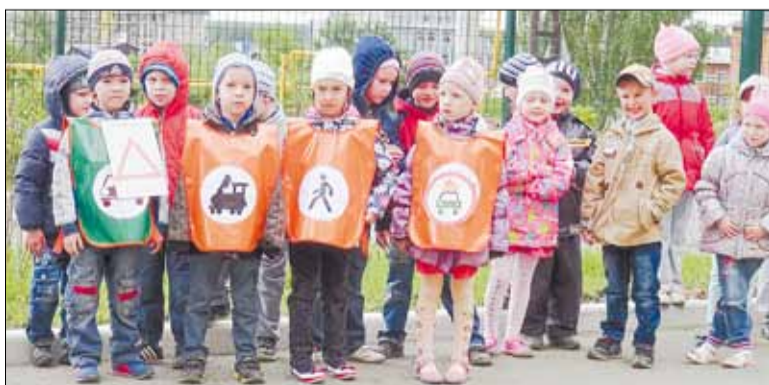
Дошколята во время урока.