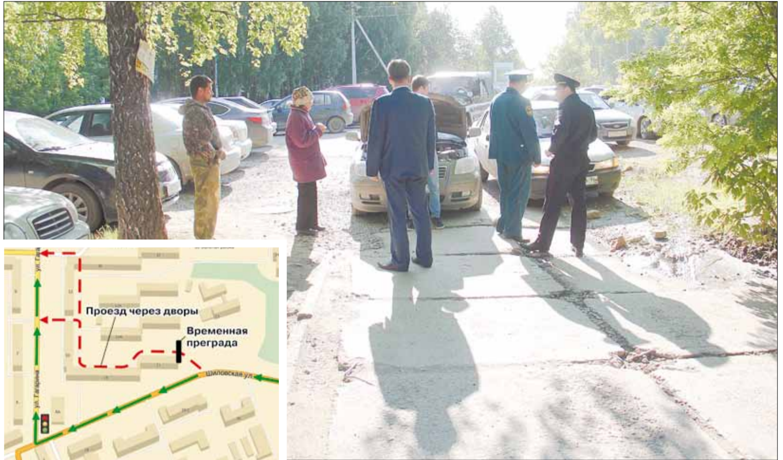
Второй раз с начала месяца представители мэрии, МЧС, ГИБДД и управляющей компании «ЖКХ-Холдинг» собрались во дворе домов, жители которых потребовали оградить их от противозаконного нашествия автотранспорта

Бетонные ограничители решено поставить на стыке между 19-м и 21-м домом. Кроме того, пожарные пообещали провести профилактическую работу с местными водителями, чтобы они не загромождали проезд спецтехнике. На въездах на придомовую территорию появятся дорожные знаки «Тупик» и «Жилая зона». Их установят силами управляющей компании «ЖКХ-Холдинг» и мэрии. Следить за тем, как водители соблюдают предписания указателей, обязаны сотрудники ГИБДД.