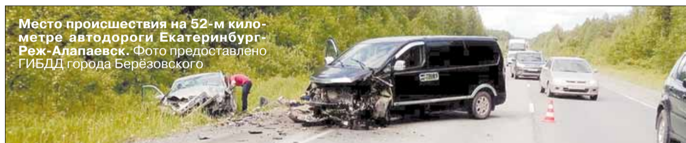
Место происшествия на 52-м километре автодороги Екатеринбург-Реж-Алапаевск.

Четыре человека получили травмы в результате столкновения минивэна «Хендэ Гранд Старекс» и легковушки «Мерседес Е270». Как сообщает Кристина Сабирова, инспектор по пропаганде отделения ГИБДД по городу Берёзовскому, 11 июня в 15:10 на 52-м километре автодороги Екатеринбург-Реж-Алапаевск 41-летний водитель уснул за ру-