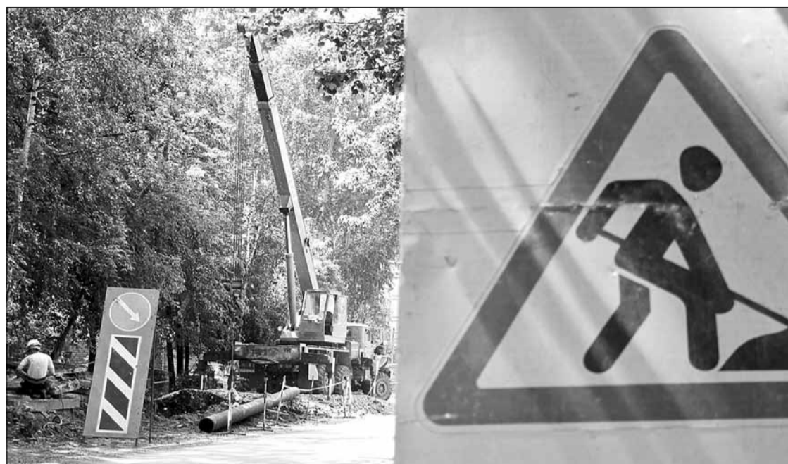
Первый этап опрессовок заставил коммунальщиков вернуться на ул. Шиловскую, где минувшей весной завершились работы по замене труб отопления возле домов № 12, 16. Новые порывы рабочие СТК вынуждены устранять рядом со следующим домом – № 18.