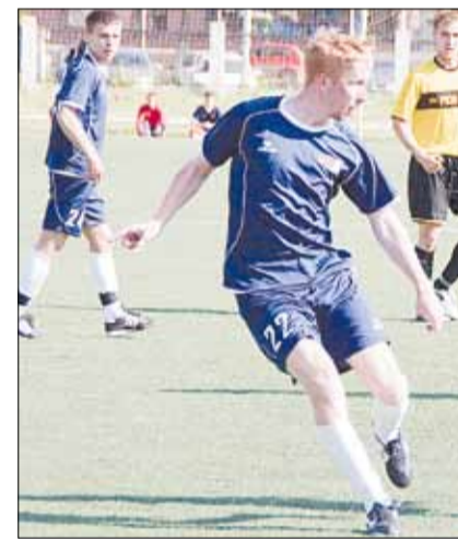
«BROZEX» в этом году им футболисты, руково