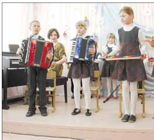
Юные музыканты на прошлогоднем открытии нового здания музыкальной школы в Ключевске

Воскресенье 21 июня Ночь +20...+24 День +29...+27