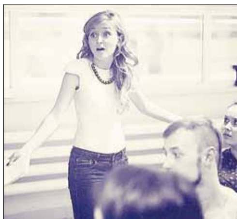
На репетициях мюзикла «Выпускной» в театре эстрады непрофессиональных актёров учили мастерству, движениям и вокалу