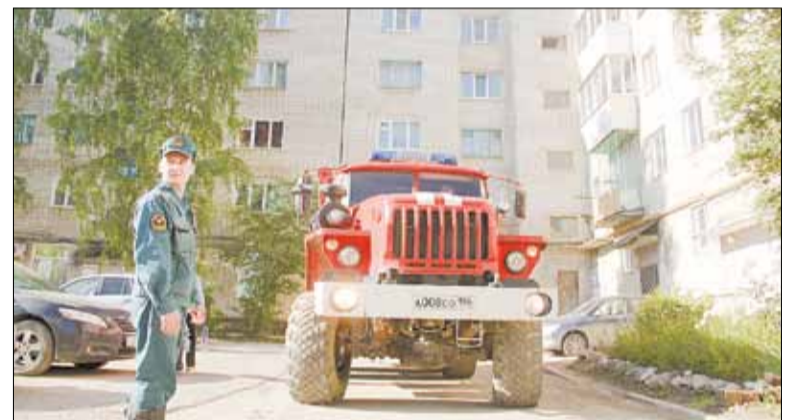
Для проверки подъездных путей пожарная машина проехала через двор, где ранее жители несколько раз выставляли «живое заграждение».