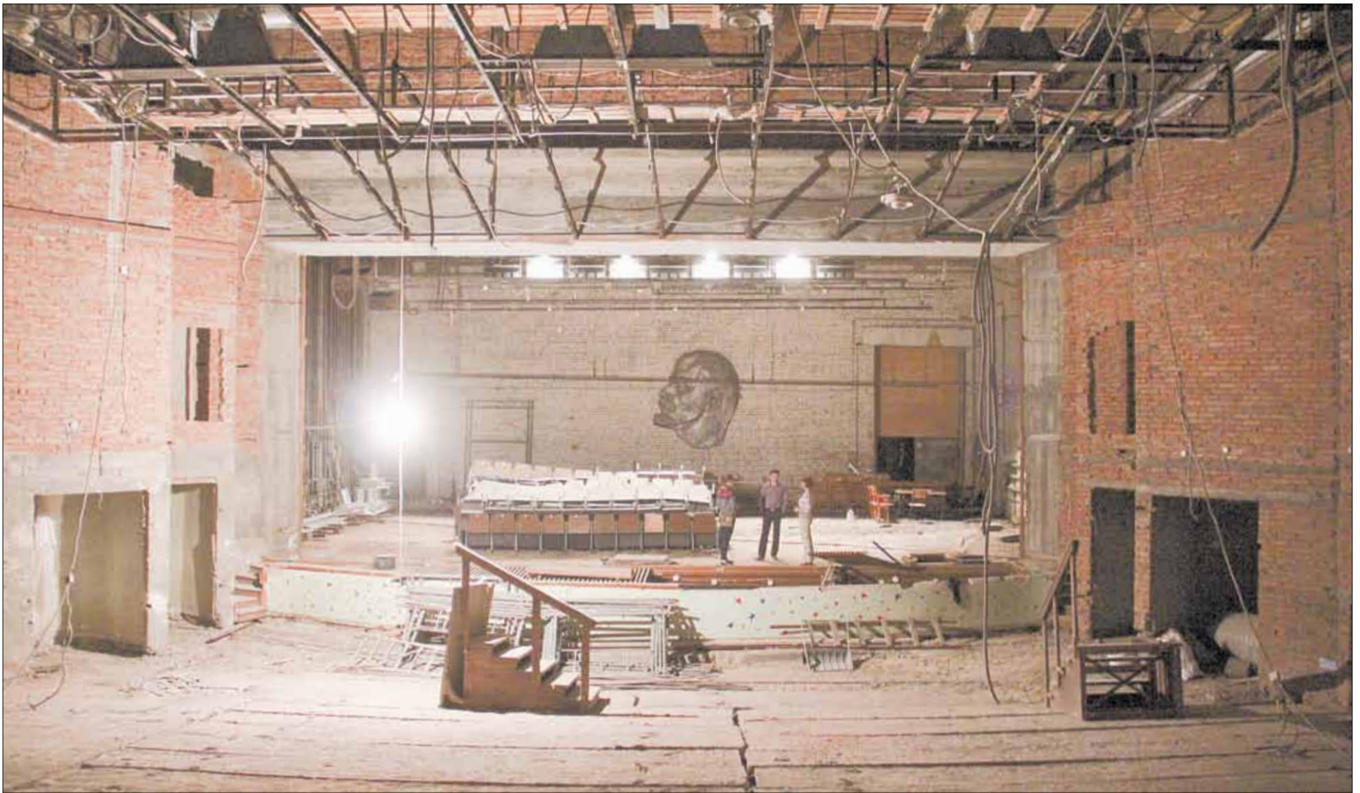
Расчищенный до основания зрительный зал дворца культуры «Современник» готов к воплощению новых идей. Часть сидений из зала переданы для использования в детском загородном лагере «Зарница» и филиале досугового центра в поселке Монетном.