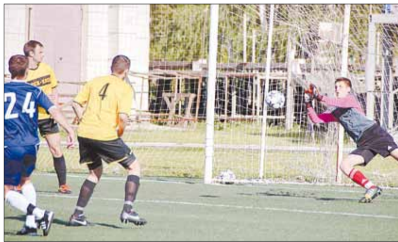
Опасный момент у ворот режевлян.