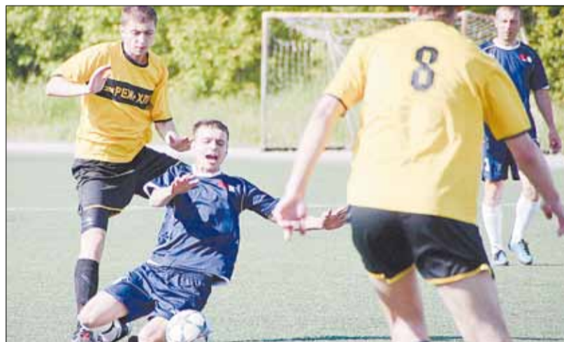
еет все шансы стать призёром областного чемпионата. В составе команды играют только местные игроки. Руководство клуба сознательно отказалось от приглашения иногородних игроков.