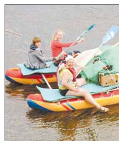
Сплав по реке Серга в июне 2014 года