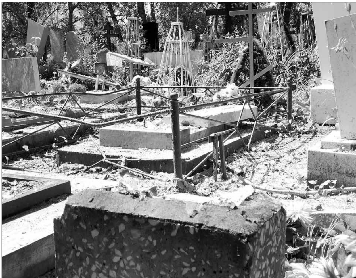
Упавшие от разгула стихии деревья серьезно повредили надгробия в разных местах центрального кладбища.