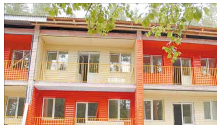
Ремонт в жилом корпусе лагеря приостановлен до осени.

Пишите: gorka-info@rambler.ru Звоните по тел. (34369) 4-53-95, сот. 8-904-982-33-11 Наш сайт: zg66.ru