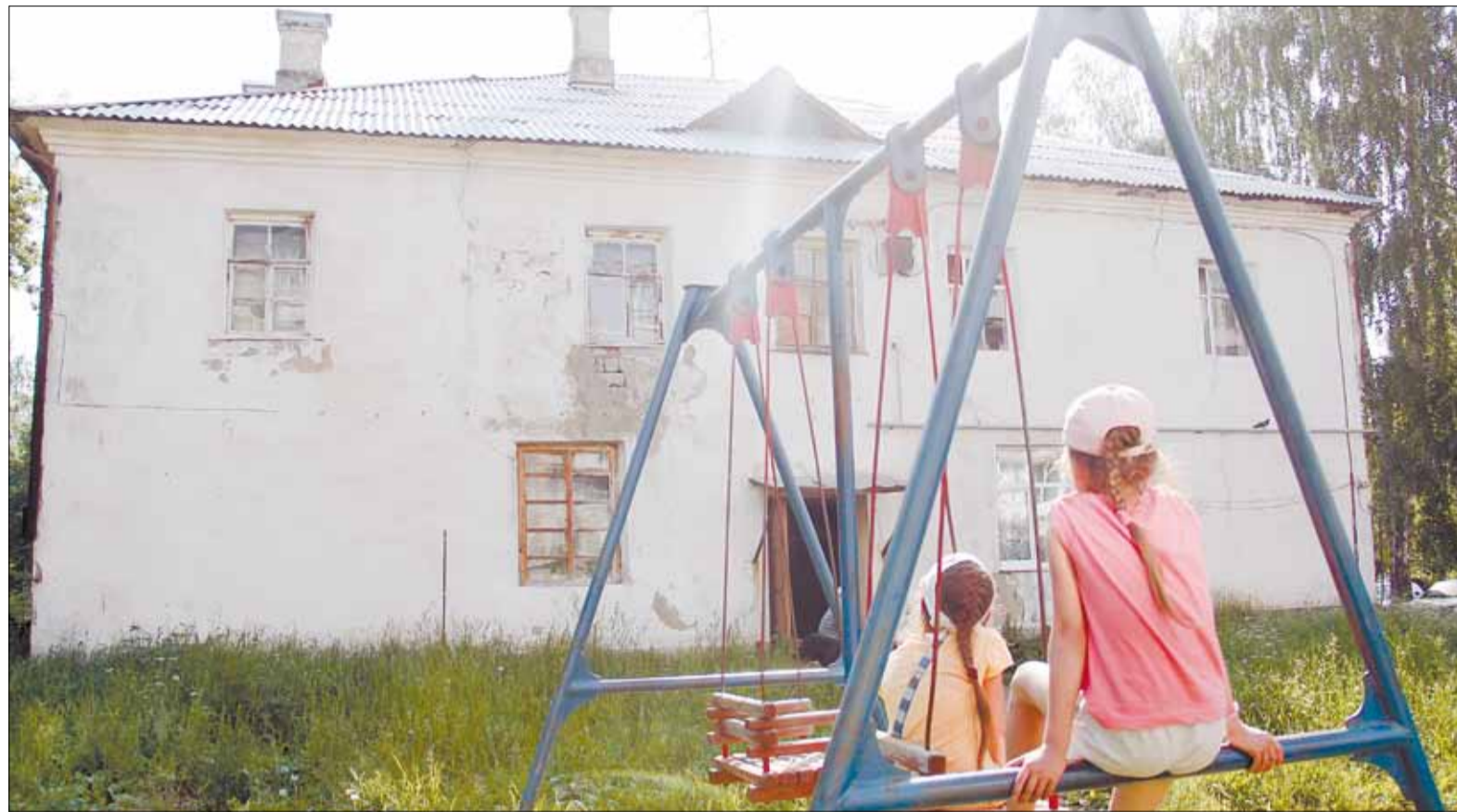
Собственников домов № 1 и 2 по ул. Советской в посёлке Кедровке чиновники наказали за неуплату взносов за капремонт, отложив этот самый ремонт в их домах еще на год. Как оказалось, в ситуации с неплатежами виноват сам региональный Фонд капитального ремонта — квитанции на уплату взносов кедровчанам доставили только в июне.

Новость об изменении региональной программы неприятно удивила жителей самого от-