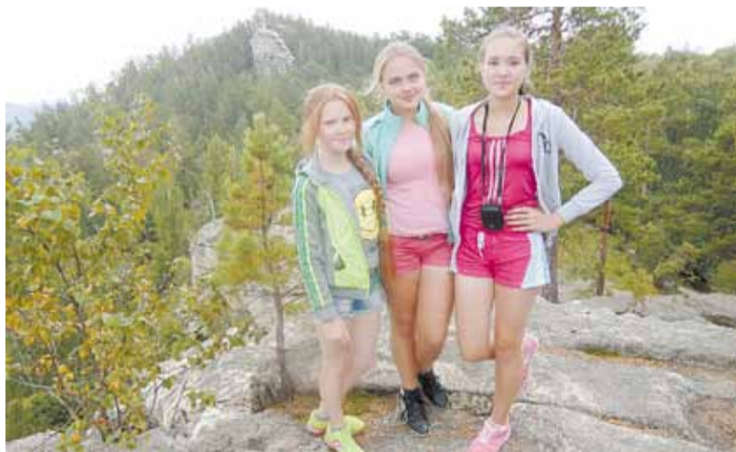
Берёзовские туристки на Аракульском шихане