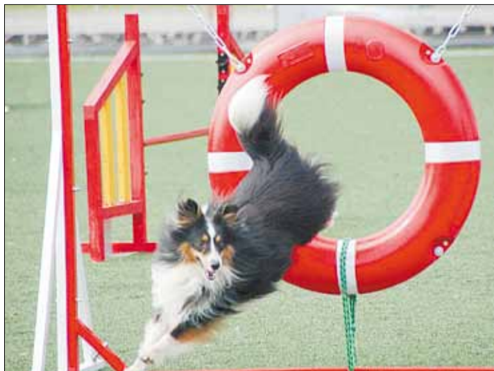
Чемпионат России по аджилити на стадионе «Горняк» в Берёзовском, 2013 год.

Тел. журналистов: (34369) 4-53-95, 8-904-982-33-11