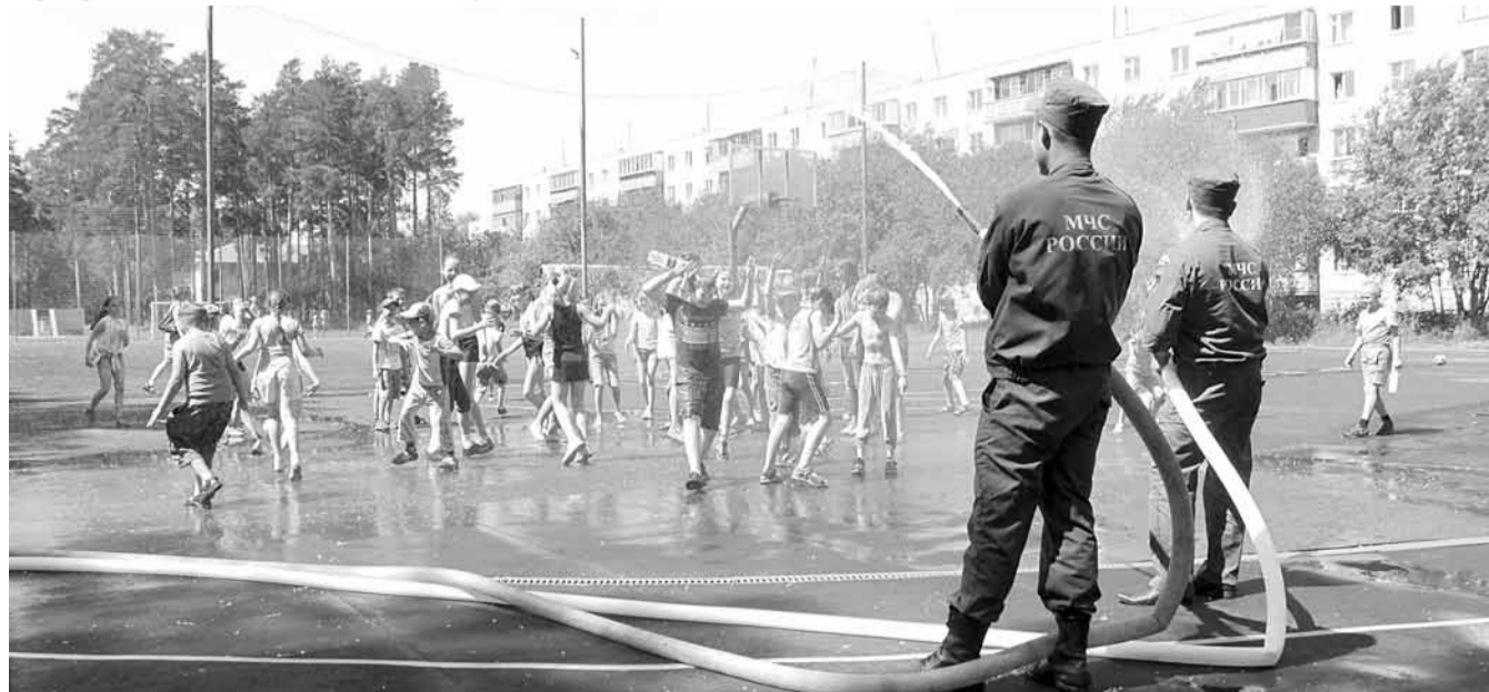
Погода в день эстафеты была настолько жаркой, что почти все ребята пожелали облиться водой из пожарных шлангов.