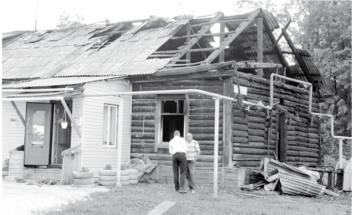
Хозяева пострадавших квартир уже на следующий день после пожара приступили к разборке сгоревших частей дома и их вывозу. Ремонтировать жилье собственникам предстоит за свой счет.

лей на Театральную со стороны Успенского храма. Пока машины проезжают перекрёсток, встречное направление стоит. При прежней схеме на дороге скапливались большие пробки, самые нетерпеливые водители проскакивали на жёлтый сигнал светофора.