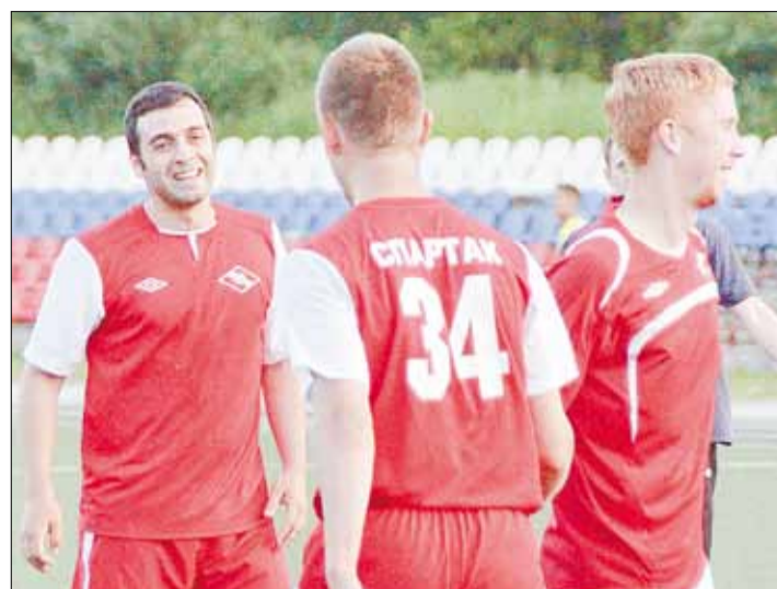
Футболисты «Спартак» радуются победе над «Родником». Счет встречи — 7:3.

Ручьи», сплывились по уральским рекам Серга и Чусовая. В планах — походы на горный хребет Шихан, сплав по реке Реж, а в конце июля берёзовские туристы отправятся на Кольский полуостров.