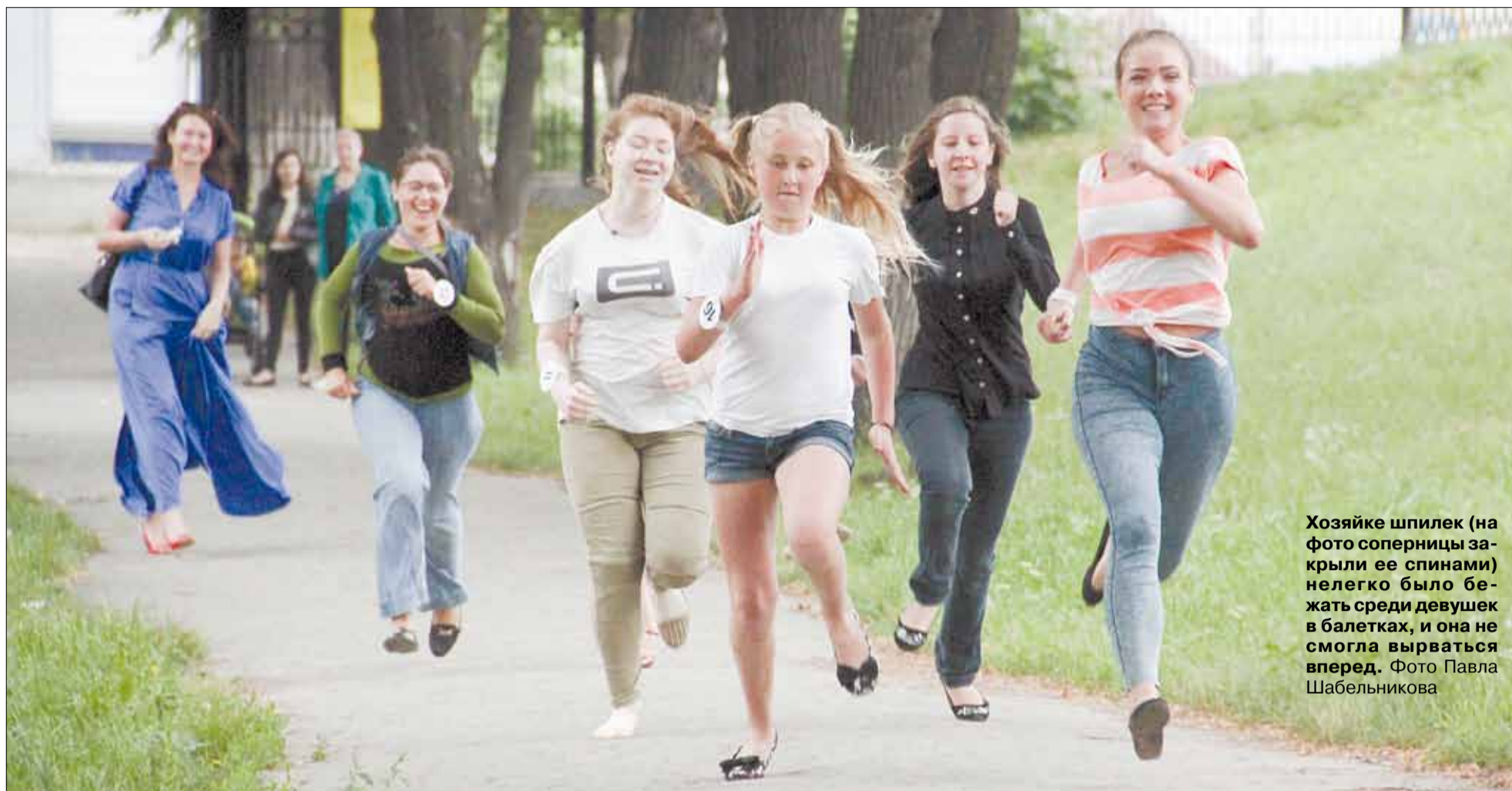
Хозяйке шпилек (на фото соперницы закрыли ее спинами) нелегко было бежать среди девушек в балетках, и она не смогла вырваться вперед.