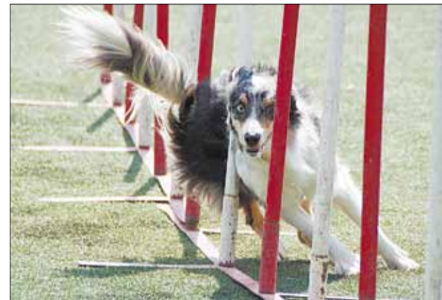
Прохождение препятствия «змейка» сопровождается специальной звуковой командой «трррррр».