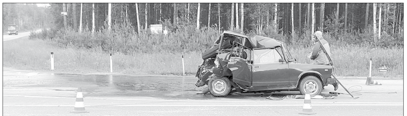
Материалы полосы подготовил Олег Манваров по информации Госпожнадзора, отдела МВД, прокуратуры города Берёзовского

Авария произошла в восьмом часу утра 27 июня на 29-м километре автодороги Екатеринбург-Реж-Алапаевск. Как сообщает ГИБДД по городу Берёзовскому, 74-летний водитель ВАЗ-21041 остановился на нерегулируемом перекрестке неравнозначных дорог для выполнения левого поворота и пропустил встречный транспорт. В это же время в попутном направлении, в сторону Режа, двигался грузовик «Тата» под управлением 32-летнего водителя. По версии полицейских, шофер грузовика неправильно выбрал дистанцию и не успел вовремя затормозить перед остановившейся «четверкой». С переломом правого плеча, тупой травмой живота и закрытой черепно-мозговой травмой пожилой автолюбитель был госпитализирован в больницу Берёзовского.