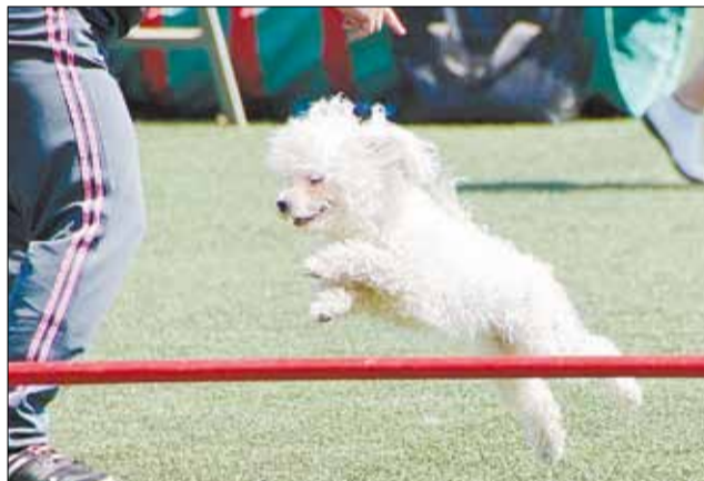
Маленькие собачки, как, например, подопечная Светланы Гузиной, прыгали чуть ниже, но в остальном не отставали от крупных пород