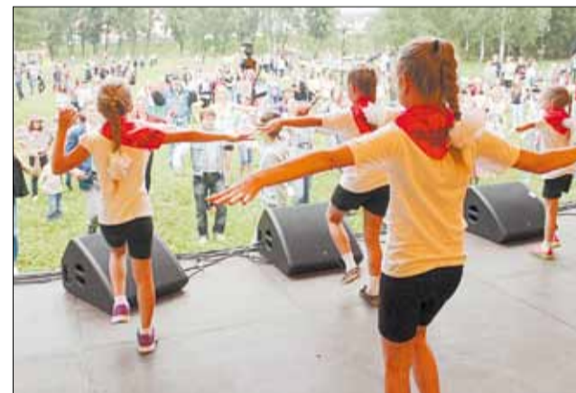
Девчонки из студии танца «Феерия» провели пионерскую зарядку, в которой участвовало большинство зрителей.