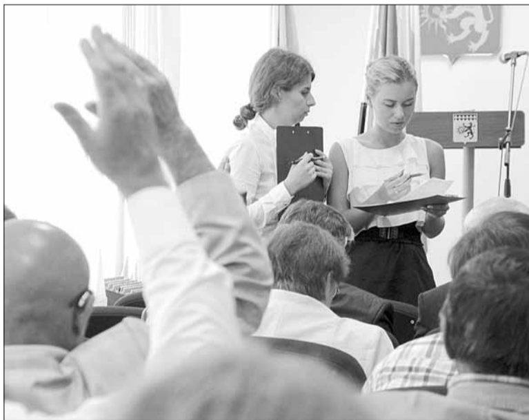
Думцы голосуют за утверждение положения о работе конкурсной комиссии.

Как пояснила Колупаева, текст документа составили в администрации губернатора и правительстве Свердловской области. Конкурсную комиссию сформируют