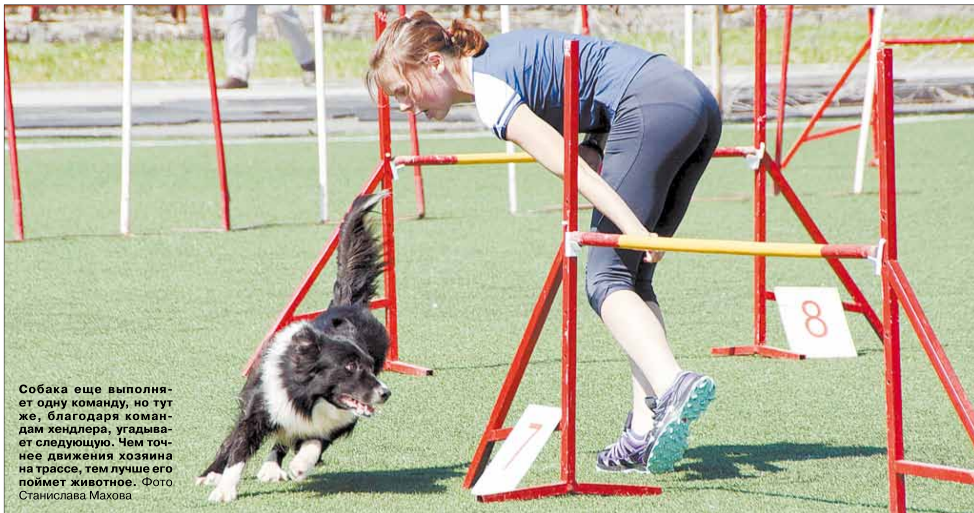
Собака еще выполняет одну команду, но тут же, благодаря командам хендлера, угадывает следующую. Чем точнее движения хозяина на трассе, тем лучше его поймет животное.