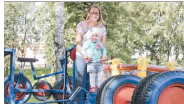
Рукотворные качели и тренажёры – очень популярное место в Историческом сквере для прогулок с детьми.