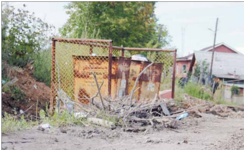
Контейнерная площадка на ул. Набережной. На деньги из депутатского фонда к ней будут оборудованы подходы.