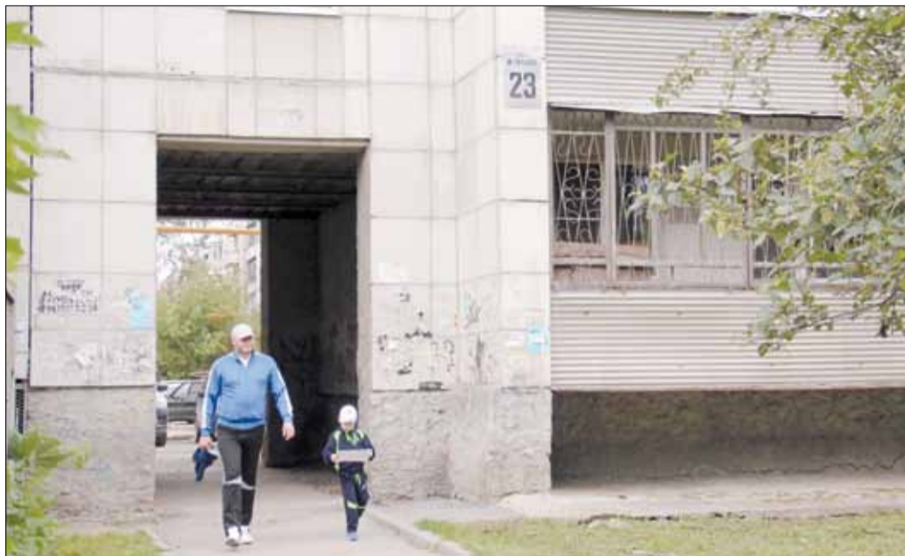
Арочный проезд между домом № 3 по ул. Смирнова и домом № 23 по ул. Максима Горького. На его ремонт депутаты выделили 180 тыс. руб.