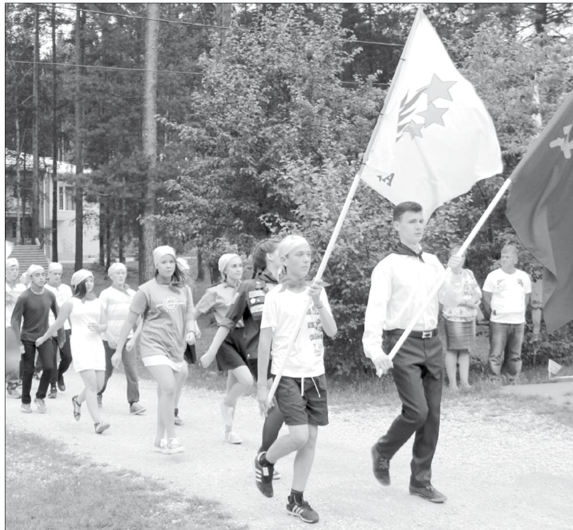
На торжественную церемонию открытия ребята выходили под флагами «Зарницы» и СССР.