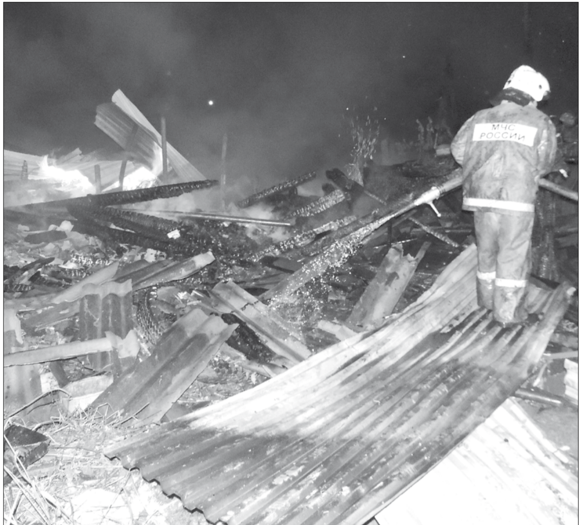
Сгоревшие сараи в посёлке Кедровка.