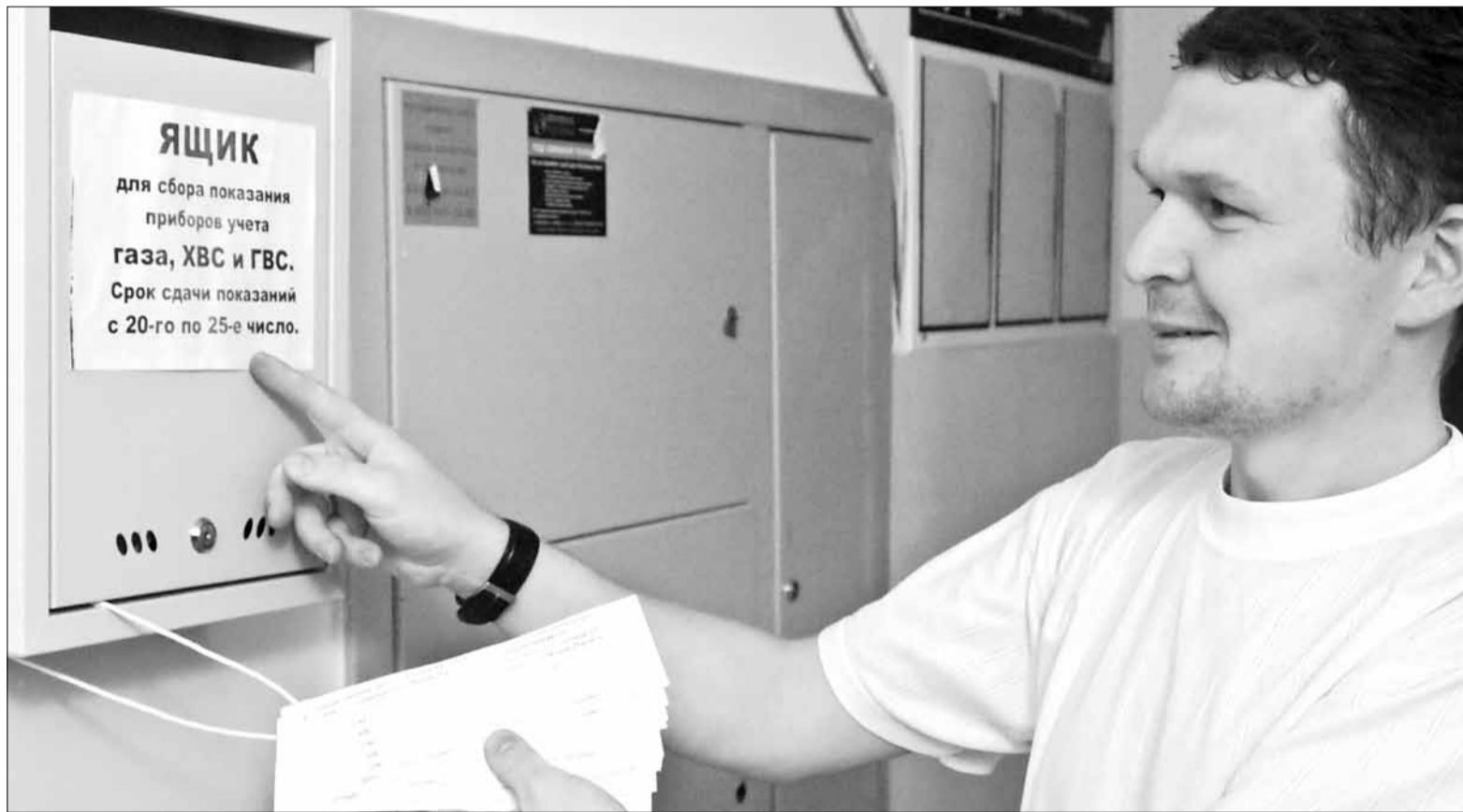
Показания индивидуальных приборов учёта жители многоэтажки опускают в ящики, установленные в подъездах. Затем члены правления ТСЖ все данные переводят в электронный вид и отправляют поставщикам ресурсов. Благодаря такому простому новшеству, удалось добиться практически 100-процентной собираемости показаний.

Ещё одна статья расходов — водоснабжение на общедомовые нужды — полностью исчезла из квитанций, приходящих собственникам восьмого дома. Те-