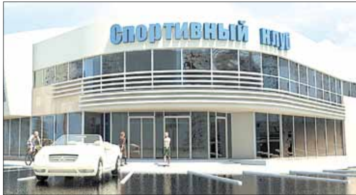
Примерный эскизный проект баскетбольного центра

Тел. журналистов: (34369) 4-53-95, 8-904-982-33-11