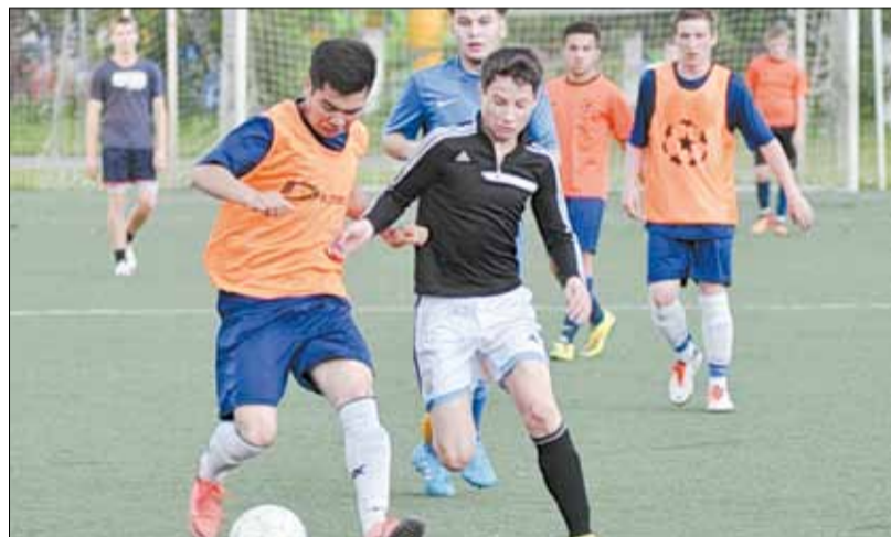
В рамках чемпионата Берёзовского. Кова