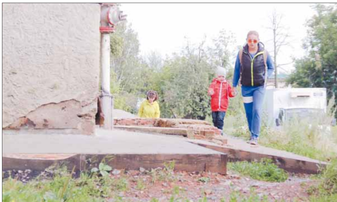
В обход разбитого участка на ул. Театральной народная тропа пролегает по отсыпке здания третьего дома.

В объёмном перечне значатся, в основном, ремонты школ, детских садов и работы по благоустройству — освещение улиц, асфальтирование дорог, тротуа-