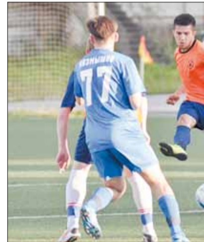
«Альянс» и сборная Монетного нынешним летом встречаются во второй раз – до этого они играли в первом. В обоих матчах подопечные Юрия Тырина разгромили противников – 7:0 и 8:1.