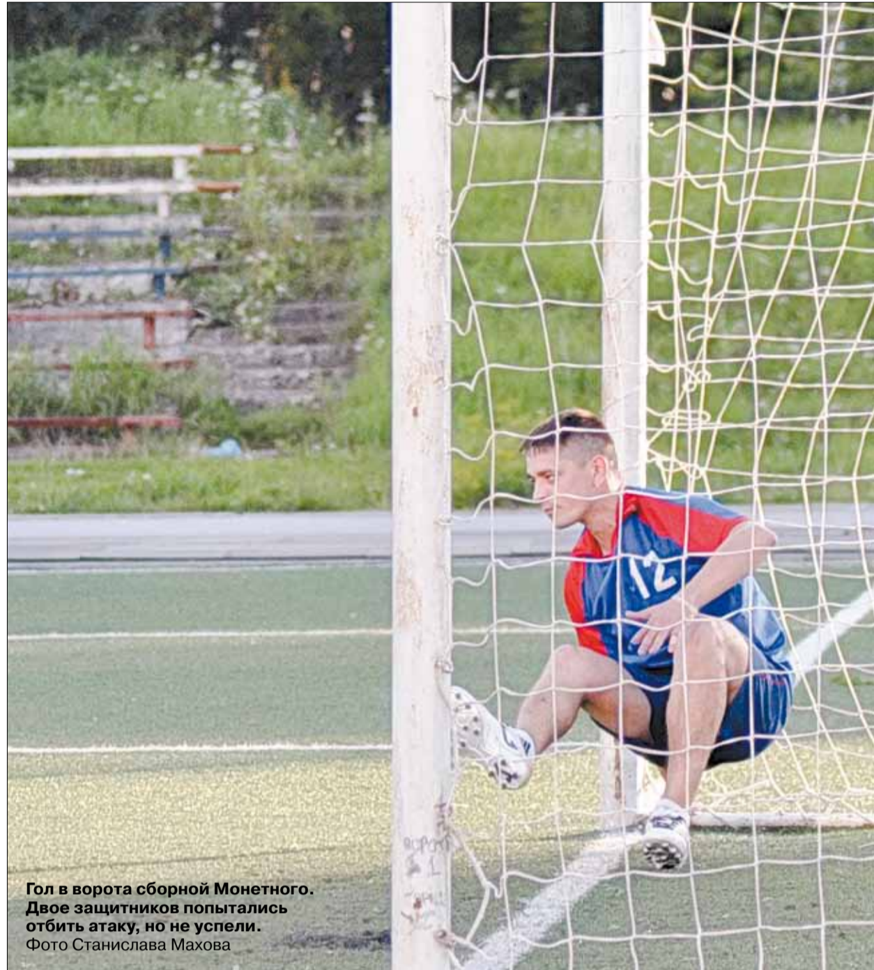
Гол в ворота сборной Монетного. Двое защитников попытались отбить атаку, но не успели.